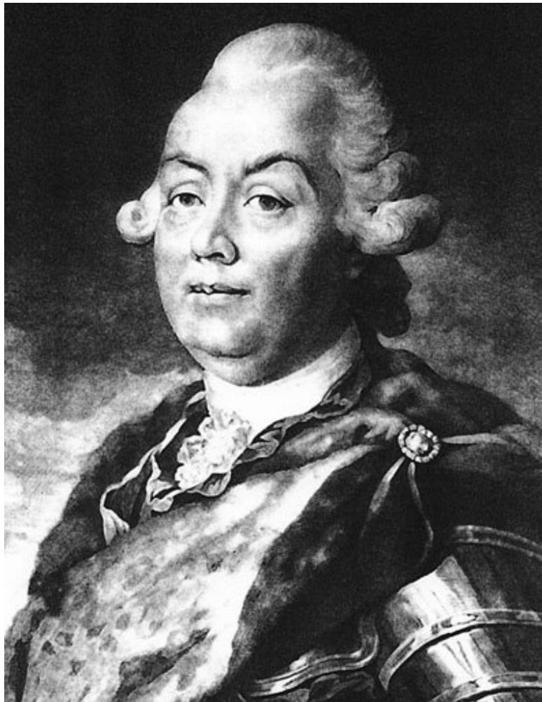
Д.Г. Левицкий. Портрет П.А. Румянцева