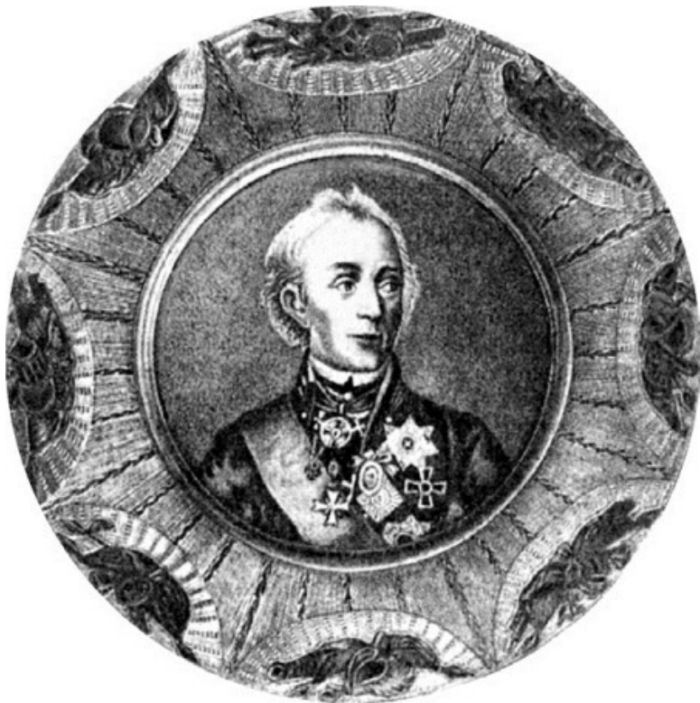
Неизвестный художник. Изображение А.В. Суворова на табакерке

С.Р. Воронцов (а затем и его сын М.С. Воронцов) считал храбрость, самоотверженность врожденными качествами русских солдат, а русских пехотинцев – лучшими в Европе. В своих записках о русском войске он подтверждал свою