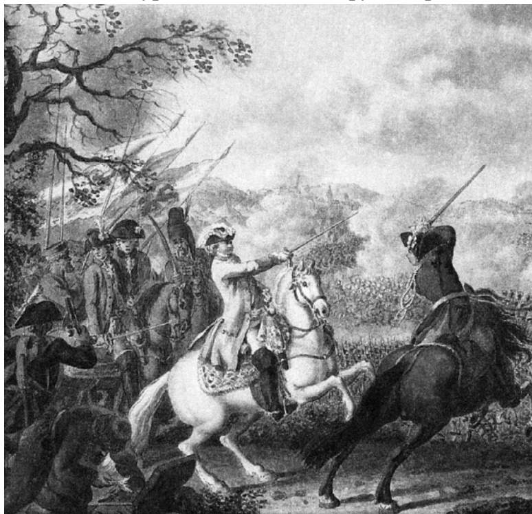
Д. Ходовецкий. П.А. Румянцева в сражении при Кагуле 21

7 (18) июля 1770 года состоялось сражение между первой армией генерала П.А. Румянцева и турецко-татарскими войсками крымского хана Каплан-Гирея. На стороне русских 38 тысяч человек, 115 орудий против 65 тысяч татарской конницы, 15 тысяч турецкой пехоты, 33 орудий противника.