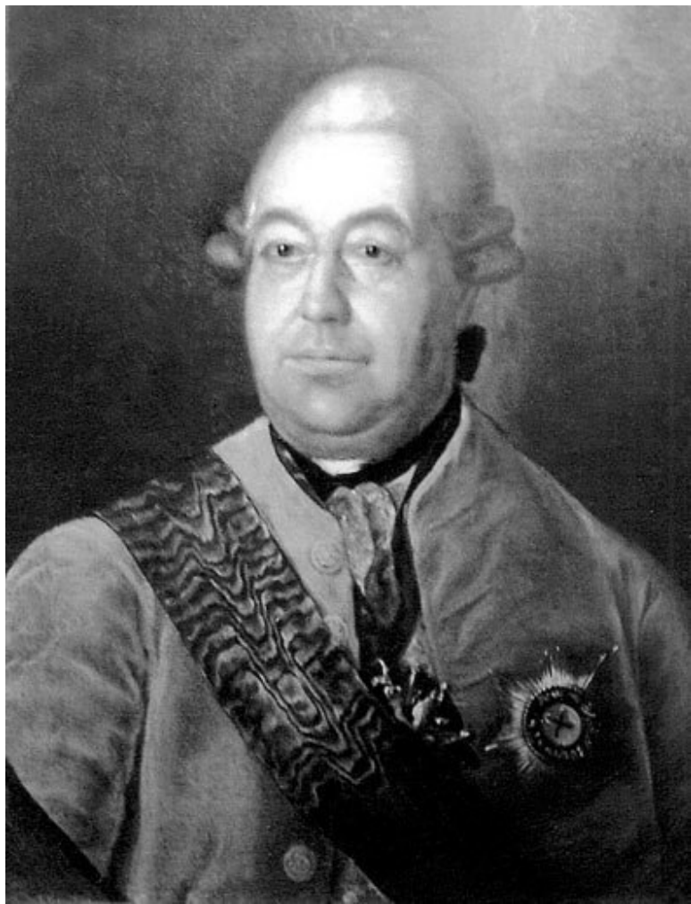
Г. Сердюков. Портрет Р.И. Воронцова