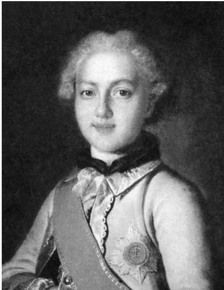
Неизвестный художник. Портрет Е.Р. Дашковой. 1762 г.