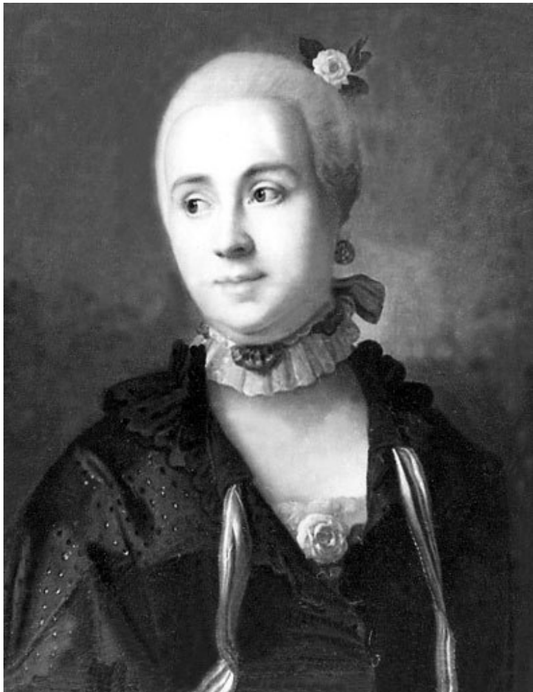
Неизвестный художник. Портрет А.К. Воронцовой