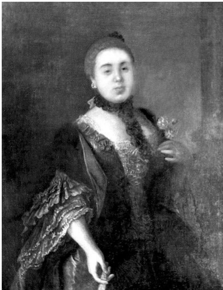
Неизвестный художник. Портрет Е.Р. Воронцовой (в за-