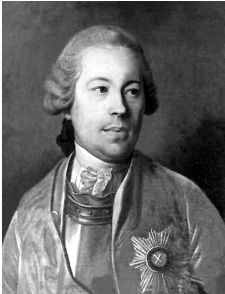
Неизвестный художник. Портрет М.И. Воронцова