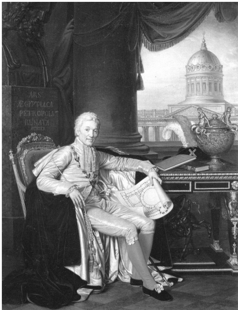
А.Г. Варнек. Портрет А.С. Строганова