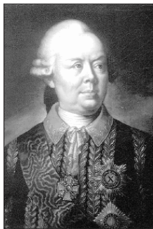
П. Румянцев-Задунайский. Художник Д. Левицкий

нее образование и первый военный опыт под руководством своего отца. В 1731 г. шестилетнего Петю по обычаям того времени записали в гвардию, в 1740 г. произвели в офицеры. Во время Русско-шведской войны 1741–1743 гг. он находился в действующей армии. Молодой капитан Петр Румянцев доставил императрице Елизавете в Петербург мирный договор со Швецией, подписанный при непосредственном участии его отца, и был повышен в звании сразу через три чина. За мирный договор отец получил графское достоинство «со всем нисходящим потомством», начиная с сына. Составленный отцом графский герб имел девиз: «Не только оружием». А новоиспеченный молодой граф Петр Румянцев в 1744 г. в чине полковника был назначен командиром Воронежского пехотного полка. Было ему тогда восемнадцать лет.