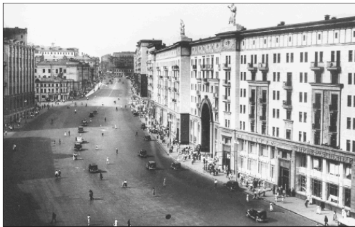
Улица Горького. 1934 г.

ятия, театры, парки культуры и даже города. В ноябре 1932 г. писатель Борис Лавренев так выразился по этому поводу: «Беда с русскими писателями: одного зовут Мих. Голодный, другого Бедный, третьего Приблудный – вот и называй города».