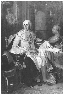
А. Румянцев. Художник В. Боровиковский

А еще Румянцев оставил на свете трех дочерей и сына Петра, ему-то и перешел дворец на Тверской улице в 1768 г. Но это было не самое главное приобретение Петра Александровича Румянцева. На Тверской он бывал нечасто, причиной тому – его легендарная биография.