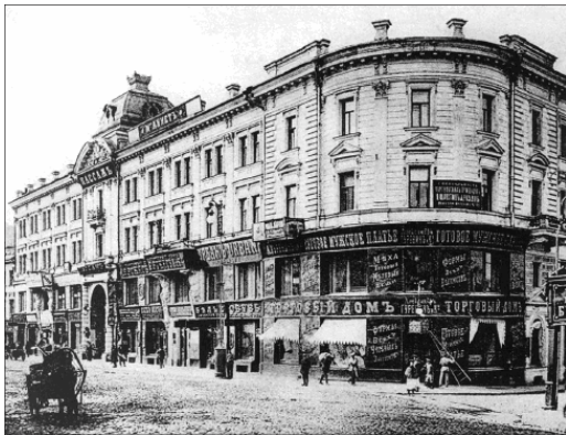
Постниковский пассаж. 1900-е гг.

Христос выгнал торгующих из храма. Аналогичный процесс произошел после 1917 г. и в Постниковском пассаже. Вместо магазинов здесь возник храм театрального искусства. Каких только театров здесь не было. Театр обзорный, Театр миниатюр, наконец, знаменитый театр Всеволода Мейерхольда, созданный им в 1920 г. и открывшийся сначала в доме 20 на Большой Садовой улице.