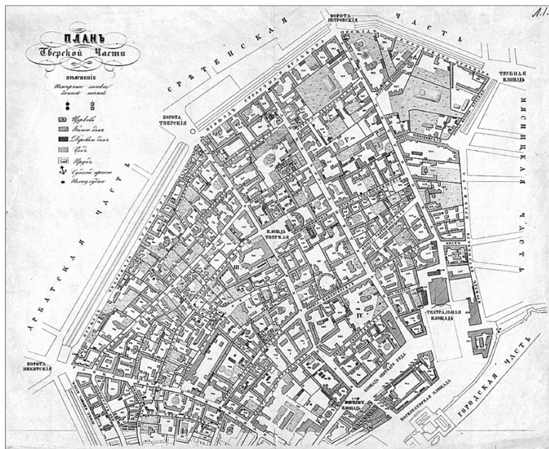
Тверская улица на карте Москвы середины XIX в.

следующим образом: снизу находились продольные дубовые бревна, на них сосновая мостовая, а сверху толстые доски. По краю мостовой шел частокол, окружавший стоявшие вдоль улицы дома.