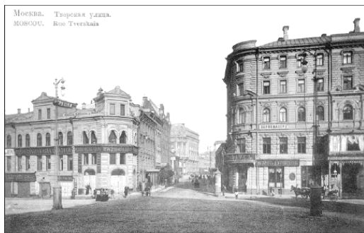
Тверская улица. 1900-е гг.

Подобные меры предосторожности предпринимались в связи с большим количеством «шалых людей», коих в Москве во все времена было в избытке. Известно, например, что еще в 1722 г. Петр I посоветовал гостям, которые приехали в Кремль 1 января, чтобы поздравить царскую семью с Новым годом, разъехаться по домам засветло «во избежание какого-либо несчастья, легко могущего произойти в темноте от разбойников».