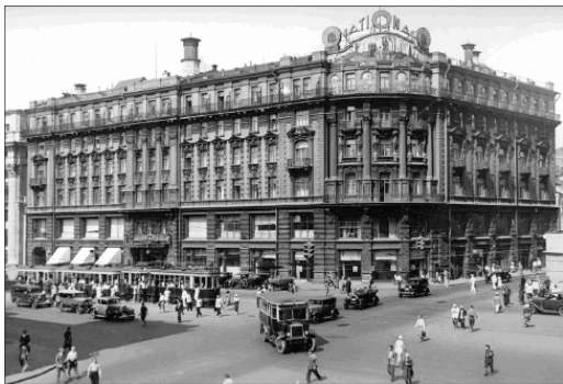
Гостиница в 1939 г.

кой конфет в руках, таящей в себе смертельную начинку – там была бомба для градоначальника. Обычно бомбометатель подстерегал Дубасова на подступах к его резиденции, но судьба никак не улыбалась террористам. Так шел день за днем.