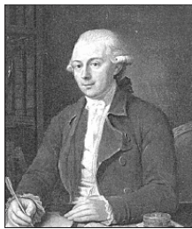
А. Мусин-Пушкин. Неизвестный художник

«Слово» являлось одной из жемчужин собрания Мусина-Пушкина. А кроме того, были там и Никоновская летопись, и Лаврентьевская летопись, и документы эпохи Ивана Грозного, и собственноручные записки Петра I, и еще немало ценнейших памятников и исторических источников различных эпох.