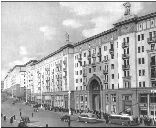
Улица Горького. Конец 1930-х гг.

Отдельным этапом стала прокладка метрополитена, рыли его открытым способом, найдя немало интересного. Одна из первых шахт метро была на углу Тверской и Охотного ряда. Очевидец вспоминал: «В шахту спускались по узкой вертикальной лестнице. Я спускался в тридцать втором году в брезентовом костюме. В этом месте, под Тверской и под Охотным, было чумное кладбище XVI в. Человеческих костей нашли немало. Вообще, где бы ни рыли в Москве, особенно под церквами, – множество скелетов. Одни лежат, другие стоят или находятся в наклонном положении. Находили и находят стоящих вниз головой. Отчего это? Может быть, от подпочвенных сдвигов, напора вод, а может быть, тут были и счета господ купцов, бояр и попов с неугодными