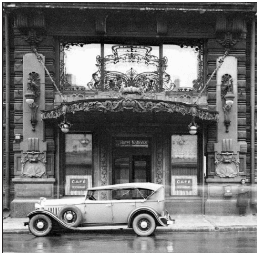
Главный вход в гостиницу. 1915 г.

вавшихся к нашему разговору. Когда мы вышли на улицу, они пошли следом за нами».