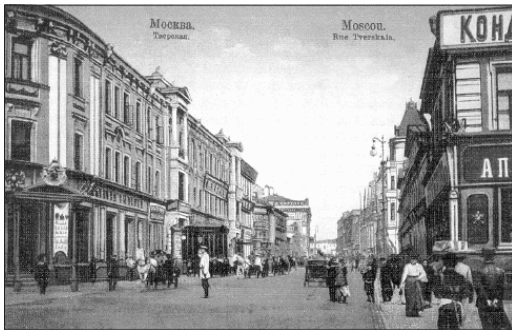
Тверская улица. Начало XX в.

А прошлое это – самое древнее из всех улиц Москвы. Как и следует из названия, улица поначалу была дорогой на Тверь, именно по ней въезжали в Москву великие князья, цари, императоры и прочие высокопоставленные лица, не говоря уже о чинах поменьше. «Тверь – в Москву дверь», – говаривали в старину.