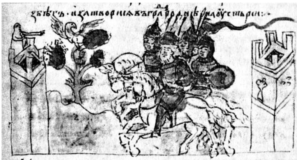
Отъезд киевского князя Ярополка из Киева в город Родно. Миниатюра Радзивилловской летописи

Чтобы оторвать Ярополка от сочувствовавшего ему окружения, Блуд якобы уговорил его бежать из Киева в город Родно, расположенный в устье реки Рось. Войско Владимира обложило его и там. По истечении какого-то времени в городе разразился страшный голод; «и есть