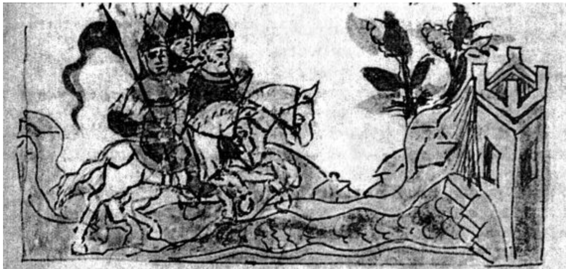
Подступ князя Владимира к Киеву. Миниатюра Радзивилловской летописи

Блуду, и тот, по словам Повести временных лет, «мысля убить Ярополка; гражаны же не бе лзе убить его», то есть киевский «полк» (ополчение рядовых горожан) служил Ярополку надежной защитой от любых покушений на его жизнь. Расстановка сил в осажденном городе, вероятно, была такова, что проязычески настроенной дружинной верхушке, желавшей сдачи Киева Владимиру, противостояла городская христианская община, по археологическим данным весьма многочисленная.