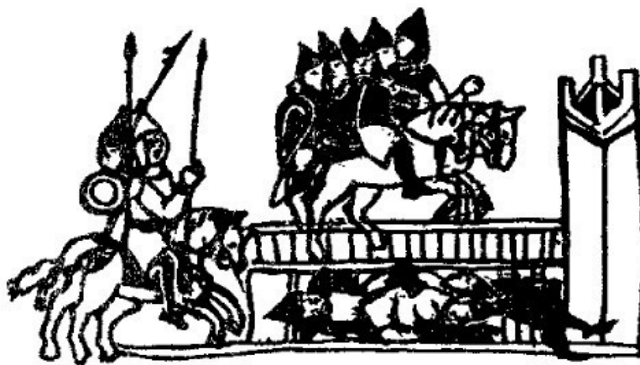
Гибель древлянского князя Олега Святославича. Миниатюра Радзивилловской летописи

И погребоша Ольга на месте у города Вручюга, и есть могила его и до сего дне у Вручюга». Ярополк же «перее власть [волюсть]» брата своего.