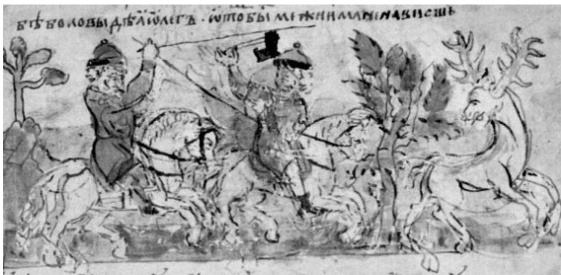
Убийство Люта древлянским князем Олегом Святославичем. Миниатюра Радзивилловской летописи

Свенгельд добивался правды в полном соответствии с законом русским: «Убьеть муж мужа, то мьститъ брату брата, или сынови отца, любо отцю сына... » Видимо, поэтому речи воеводы в конце концов были услышаны: «Поиди Ярополк на Олга, брата своего, на Деревьску землю. И изиде противу его Олег, и ополчистася». Однако в бою Олег не устоял и побежал «с вой своими в град, рекомый Вручий [Овруч]». Путь к городским воротам лежал через мост, перекинутый надо рвом. Преследуемые беглецы ринулись по нему всем скопом, тесня и сбрасывая друг друга в ров. Вместе со многими простыми воинами спихнули вниз и Олега. Под тяжестью придавивших его людей и лошадей князь задохнулся (по сведениям Иакова Мниха, мост, не выдержав тяжести, рухнул и придавил Олега во рву).