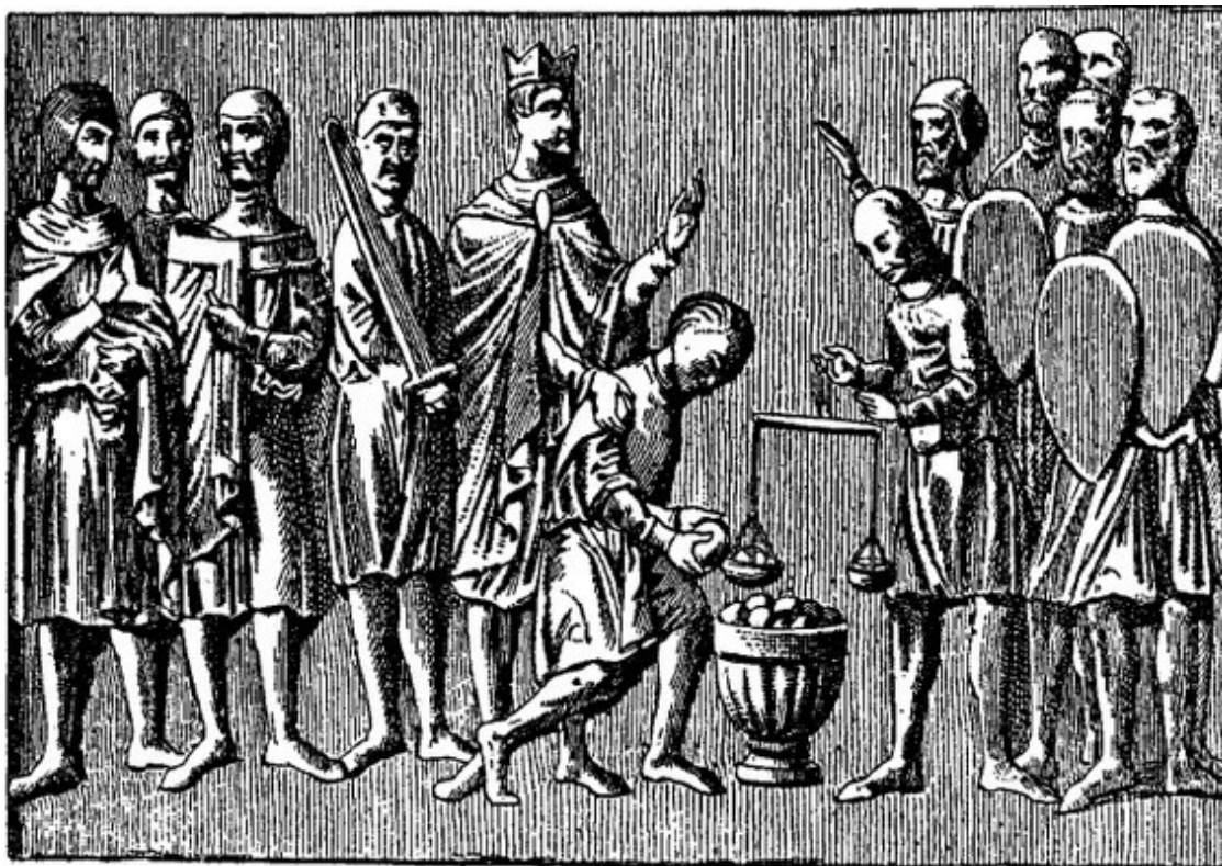
Болеслав I Храбрый выкупает у пруссов останки святого Адальберта-Войтеха. Бронзовый барельеф на дверях собора в Гнезно

Однако точно ли матерью Вышеслава была «чехиня»? Формальным поводом для сомнений на этот счет служит то обстоятельство, что во второй половине X в. Чехия имела официальный статус христианской державы. Между тем Владимир в середине 70-х гг. X в. не только оставался язычником, но и был уже женат на Рогнеде. Как же мог состояться брак между язычником-многоженцем и христианкой? Тем не менее такая возможность совсем не исключена.