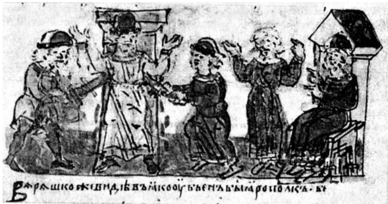
Убийство князя Ярополка двумя варягами. Миниатюра Радзивилловской летописи

Блуд, как передает летописный источник Татищева, ненадолго пережил своего господина. Вначале обласканный Владимиром, он вскоре навлек на себя гнев князя и был казнен. При этом Владимир будто бы помянул опальному воеводе его недавнее предательство: «Я тебе по обещанию моему честь воздал, яко приятелю, а сужю, яко изменника государя своего». Повесть временных лет ничего не сообщает о судьбе Блуда, но и не упоминает больше его имени.