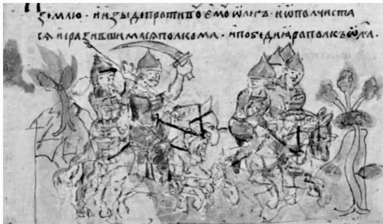
Бегство древлянского князя Олега Святославича. Миниатюра Радзивилловской летописи