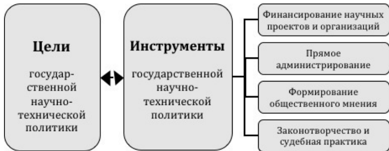
Рисунок 2.2.1.: Принципиальная связь целей и инструментов государственной научно-технической политики

На рисунке перечислены основные инструменты, которые использует государство для достижения целей в сфере науки и техники. Обратим внимание, что связь между ними обратная, так как не только цели политики определяют, какие инструменты будут использованы, но и используемые инструменты по достижению промежуточных результатов могут дать более широкое видение текущей ситуации и породить новые цели.