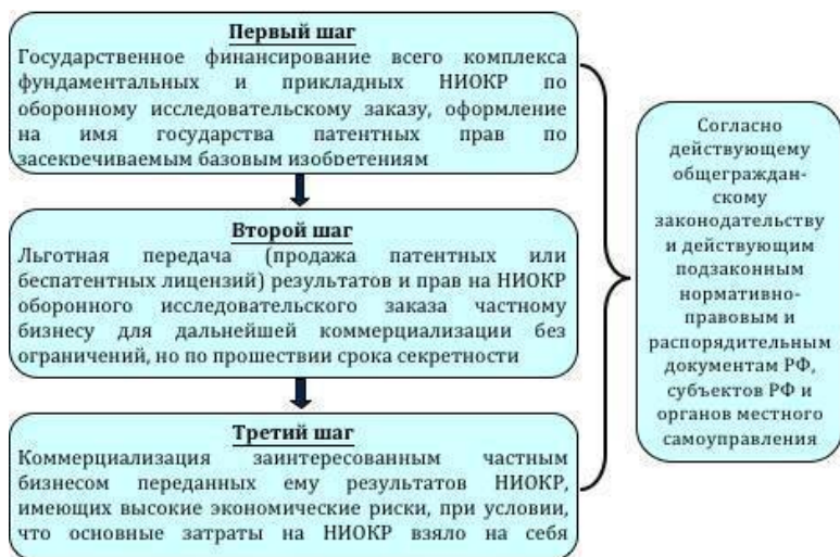
Рисунок 2.2.3.: Блок-схема прямого (договорного) государственно-частного партнерства по реализации крупных радикальных инновационных проектов.

ных крупных инновационных проектов возможно идей концессий для частного бизнеса, нацеленных на продолжение радикальных крупных инновационных проектов, которые начинает государство.