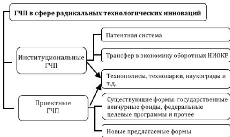
Рисунок 2.2.2.: Систематизация ГЧП в сфере технологических инноваций

На рисунке 2.2.2. в сжатом виде представлена обобщенная систематизация ГЧП в сфере технологических инноваций.