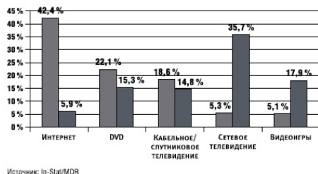
Рис. 5.1. Изменения в потреблении СМИ

Какая разница по сравнению с тем, чтоб было год назад! И какие перспективы открываются перед новым маркетингом! Обратите внимание, что, купив эту книгу, вы сделали правильный выбор, особенно если вы работаете в рекламной отрасли!