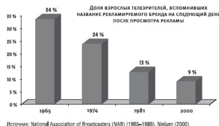
Рис. 2.1. Динамика количества телезрителей,