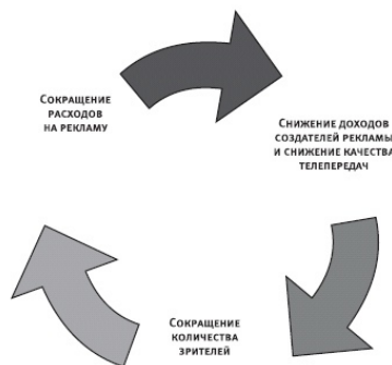
Рис. 4.1. Порочный круг сетевого телевидения

Согласно прогнозу In-Stat/MDR на 2003–2009 годы, объем расходов на электронную рекламу в США должен возрасти с $95,9 млрд в 2004 году до $114,4 млрд в 2009 году. Этот рост будет вызван прежде всего рекламой, размещаемой в Интернете, на кабельном телевидении и в электронных играх. Мы должны быть к этому готовы. Если рекламодатели до сих пор сомневаются в эффективности использования альтернативных механизмов рекламы и, так сказать, с опаской смотрят на него из-за изгороди, может быть, пора пропустить ток через изгородь, чтобы подтолкнуть их к немедленным действиям.