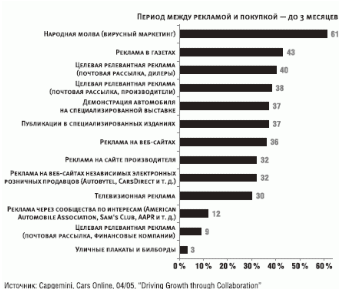
Рис. 7.1. Никакая реклама не сравнится с народной молвой

Потребители стали умнее, а значит, сильнее. Информация и знания позволяют им поступать так, чтобы быть в выигрыше (а продавцы соответственно оказываются в проигрыше).