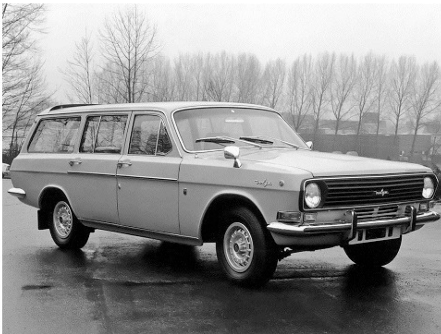
Волга ГАЗ 24—77 (24D)

Это было печально, но меня вполне удовлетворила дизельная Волга, компании Scaldia-Volga из Бельгии.