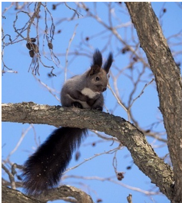
Сибирская черная белка

Наш хозяйственник за лето даже выложил в своей палатке паркетный пол елочкой из некрашенных дощечек ящиков из-под аммонита.