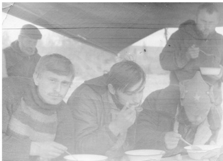
Автор (за столом справа – вылавливаю комаров из супа

Здесь же на косе в сторонке сидел и вертолет МИ-4.