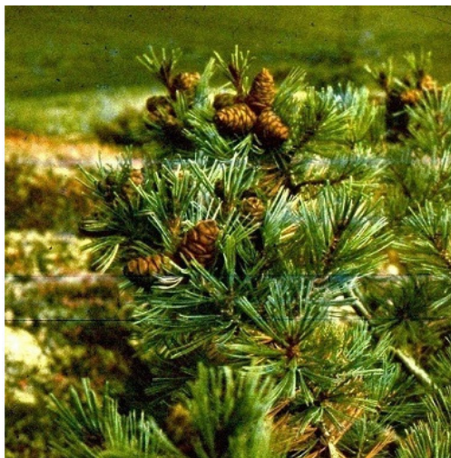
Стланик с кедровыми шишками

Но, с приближением отъезда домой, надо было подумать и о способе перевозки белки в Москву. Досмотр нас не пугал, в те 60-70-е он был формальным, можно было хоть белку везти, хоть огромные рога сохатого. Но не тащить же больший ящик.