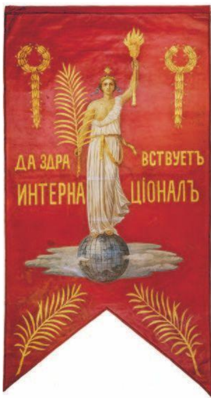
Знамя железнодорожного цеха Путиловского завода, 1917. ГМПИР

«Крылатые девы» примыкали к раннесоветским интерпретациям художественного наследия Великой французской революции 9 , а потому задержались в новой геральдике чуть дольше «России в цепях». Фигуры Свободы, Революции, Победы, Справедливости широко использовались в театрализованных политических шествиях, а затем и в декоративном оформлении городов в дни политических празднеств – в первую очередь, в композициях триумфов с аллегорическими колесницами 10 . На Первомайской демонстрации в Петрограде 1918 года шествия профсоюзов на Скобелевской площади сопровождались оркестром и автомобилем