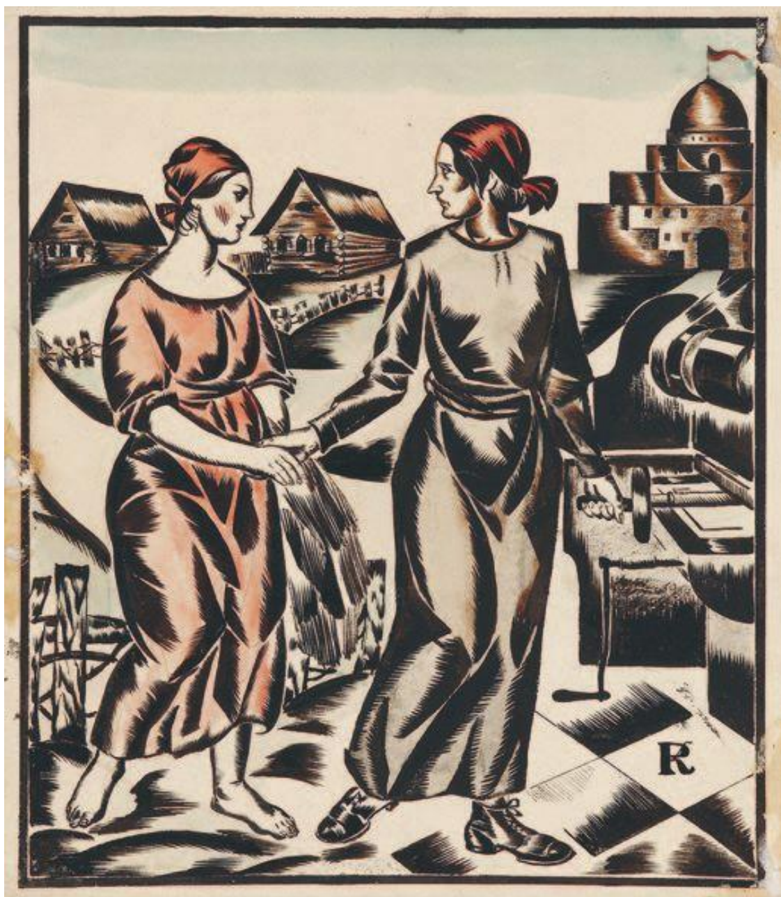
Женская версия сюжета «смычки». Рудаков К. Рисунок для журнала «Работница и крестьянка», 1923. Собрание Р. Бабичева

В отличие от дев Победы, образ Ленина предполагалось наделить не только портретными чертами, но и современным эпохе мужским гендером, избегая как стилизаций, так и излишнего экспонирования тела. Однако символизм не был вполне побежден реализмом. Заметная часть проектов мемориала вождю для конкурса 1924 года, как и многие воплощенные версии первой волны скульптурной ленинианы 26 , имели вид фигуры, облаченной в пиджак и брюки, но помещенной на вершину аллегорической композиции. Это закрепляло сложившиеся в Гражданскую войну представления о взаимосвязи гендерной и классовой иерархии советского общества. На вершине сословной пирамиды стояли образы военизированного труда, воплощенные в союзе рабочего и красноармейца, чуть ниже помещалась другая пара – соединенные в сюжете «смычки города с деревней» рабочий и крестьянин. Низший этаж социальной лестницы занимали образы женщин, как деревенских, так и городских: они персонифицировали «темноту»,