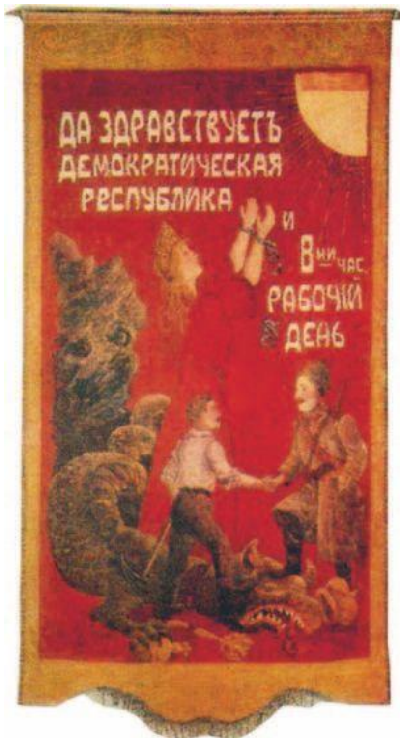
Знамя Трубной мастерской Ижорского завода, 1917. ГМПР