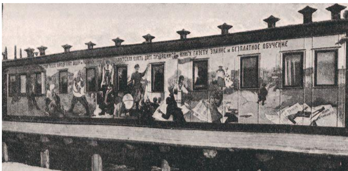
Агитпоезд «Красный казак».

Новаторской формой передвижной выставки-плаката, позволившей значительно расширить аудиторию, стал агитационно-инструкторский поезд 33 . Агитпоезда освещали минимальное количество сюжетов, оставляя в приоритете самые ударные политические вопросы: цели и перспективы революции, военные конфликты и «смычку города с деревней». Например, роспись поезда «Октябрьская революция» включала сцены борьбы с мировым капиталом и Антантой, композиции на темы союза крестьян и рабочих в войне и труде и сатиру на патриархальные обычаи: с 29 апреля 1919 года по 12 декабря 1920 года он совершил 12 больших поездок, побывав почти на всех фронтах.