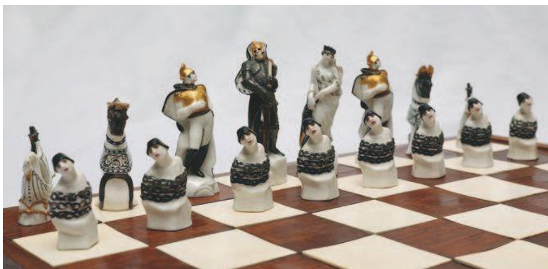
Данько Н. Шахматы «Красные и белые». Петроград – Ленинград, 1932. ГЦМСИР

Данько смягчила оппозиции, заставляя задуматься над глубоким сходством красных и белых аллегорий, принадлежащих одной эпохе. Скованные черными цепями бледные рабы-пешки Белой армии, чьи лица искажает печаль, решены в контрасте с пешками Красных – золотоволосыми крестьянами в красных рубахах, вооруженных серпами. Красный король, Молотобоец в пролетарской кепке, и Белый король, Смерть в латах и горностаевой мантии, предстают в ее трактовке Арлекином и Пьеро Советской России.