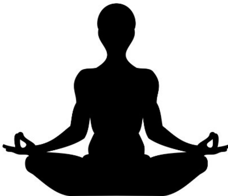
Позиция для медитаций (классическая)