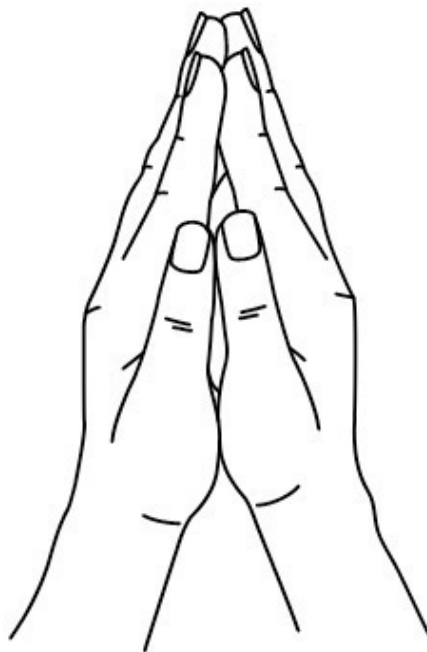
Позиция рук "Гассе"

Сеанс самоисцеления длится 5—10 минут. Сеанс работы с намерением – 10—15 минут. Сеанс работы с кармой Рода – 10—20 минут. Вы сами ощутите, когда энергия остановится.