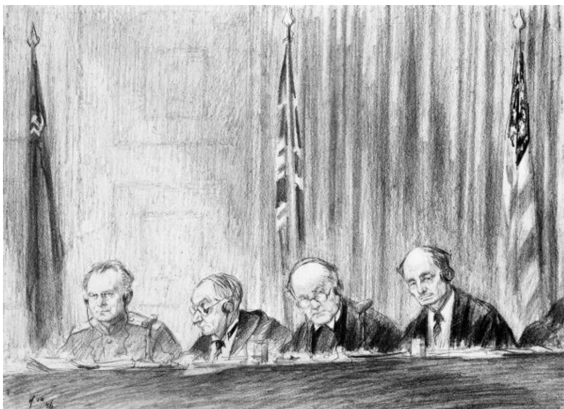
Судьи Никитченко И. Т., английский судья лорд Дж. Лоренс и Ф. Биддл

Членами Трибунала были назначены: от СССР – заместитель Председателя Верховного суда СССР И. Т. Никитченко, от США – бывший генеральный прокурор Ф. Биддл, от Великобритании – главный судья лорд Дж. Лоренс, от Франции – профессор уголовного права А. Доннедье де Вабр.