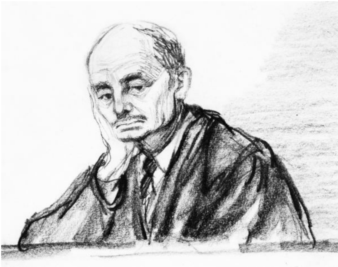
Судья Ф. Биддл

Каждая из четырёх стран – участниц Лондонского соглашения об учреждении Международного военного трибунала направила на процесс своих главных обвинителей, их заместителей и помощников. Советскую делегацию возглавил Роман Андреевич Руденко, с 1944 г. занимавший пост прокурора Украинской ССР.