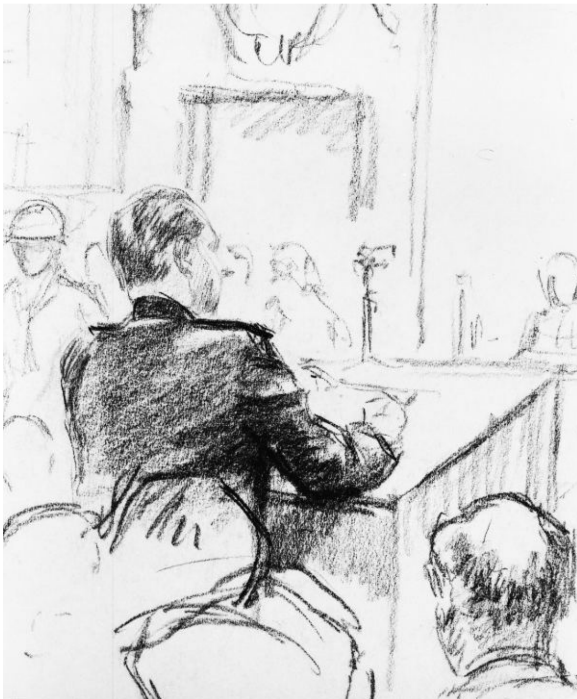
Роман Андреевич Руденко

На первое совместное заседание главные обвинители от СССР, США, Великобритании и Франции собрались для составления согласованного списка подсудимых. Вначале предполагали, что это будет, скорее всего, 10–12 человек из разных властных структур нацистской Германии. Член Трибунала от СССР И. Т. Никитченко настаивал на том, что в списке обязательно должны находиться также и немецкие промышленники. В результате число подсудимых увеличилось.