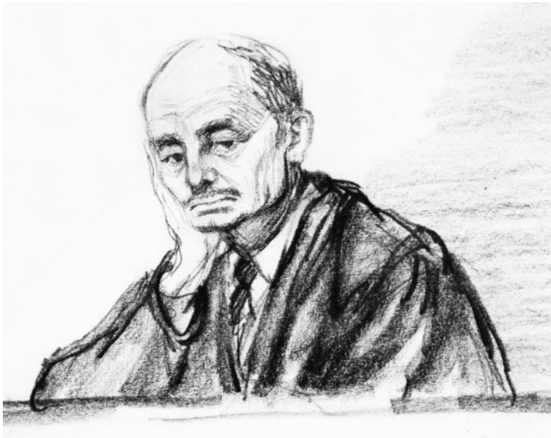
Судья Ф. Биддл

Каждая из четырёх стран – участниц Лондонского соглашения об учреждении Международного военного трибунала направила на процесс своих главных обвинителей, их заместителей и помощников. Советскую делегацию возглавил Роман Андреевич Руденко, с 1944 г. занимавший пост прокурора Украинской ССР.