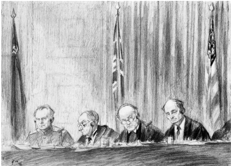
Судьи Никитченко И. Т., английский судья лорд Дж. Лоренс и Ф. Биддл