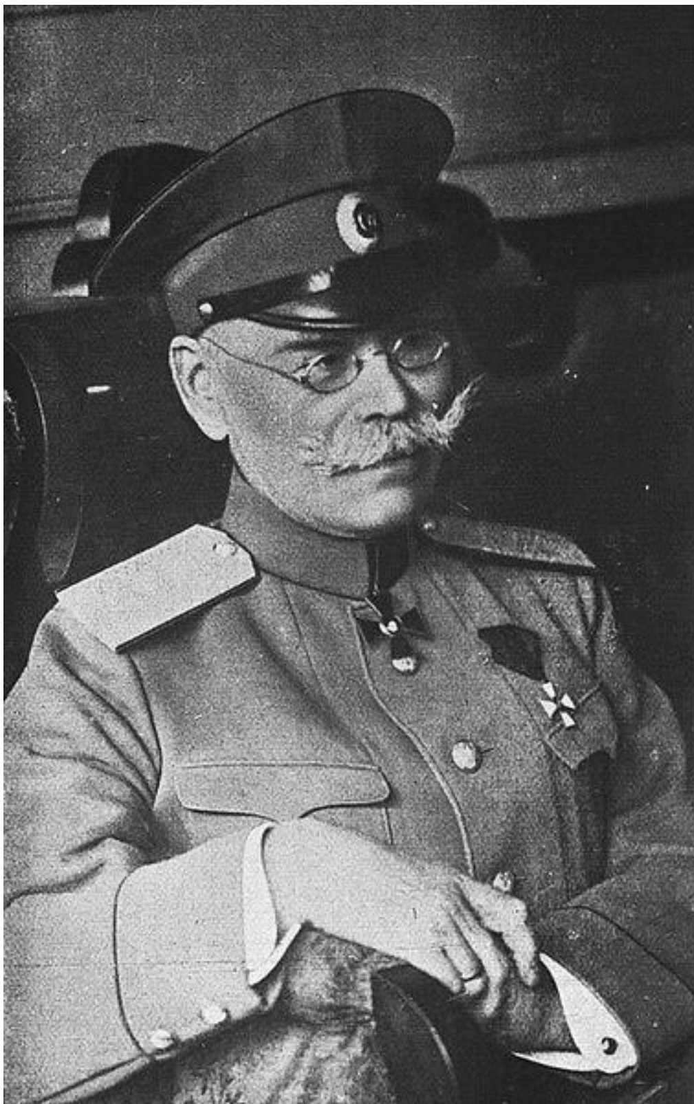
Генерал М. В. Алексеев

Больше всех не повезло с этой точки зрения генералу Алексеву. Несчастный старик до конца своих дней носил позорное клеймо заговорщика. А вся вина Михаила Алексеевича заключалась лишь в том, что он стал адресатом письма Гучкова, на которое даже не ответил. Но кого волнуют такие мелочи, если сам Гучков тут же раззвонил на весь свет, что и известный русский генерал теперь с ним заодно? Все ясно, Алексеев виноват. И генерал Корнилов будет