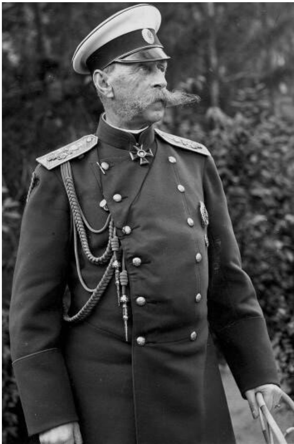
Граф В. Б. Фредерикс. Министр двора Николая II

Этим словам Николая II выпала счастливая жизнь. Кто только их не цитировал за прошедшие 100 лет! Кто только не искал в них вдохновения для описания роковых событий Российской империи! Но почти все старательно обходят один незначительный нюанс: а кто виноват? В самом деле, кто виноват, что в тяжелейший для страны момент не нашлось никого, кто взял бы на себя ответственность за веру, царя и Отечество? Кто держал на должности петроградского градоначальника Балка? Кто не разогнал Государственную думу сразу после речи Милюкова? Кто упорно не хотел принять единственно здравый план действий, предложенный генералом Алексеевым? Да, кругом измена. Тут не поспоришь. Но трусость-то – чья? И чей обман?