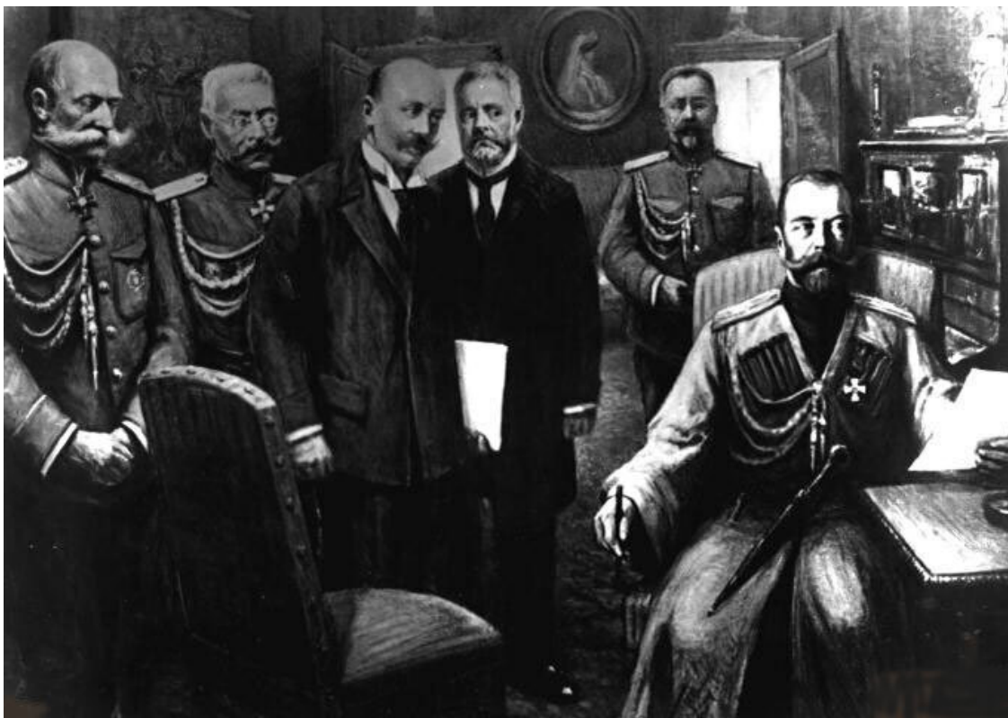
В. В. Шульгин (третий слева) в момент отречения. Ирония судьбы: он был убежденный монархист

Граф Фредерикс – убежденный монархист. Последний министр Императорского двора Российской империи. Прожил после революции еще 10 лет. У него была масса возможностей разоблачить невиданную в мировой истории подлость: обманули помазанника Божьего. Нельзя утверждать, что он круглые сутки находился под контролем чекистов. Во-первых, реалии начала 1920-х годов были несколько иными, чем в 1937-м. А во-вторых, граф Фредерикс в 1924 году покинул родину и переселился в Финляндию. Выражаясь языком монархистов – что нынешних, что прежних, – в страну, свободную от красной заразы, от коммунистической сволочи. Рядом – хорошо знакомый графу генерал Маннергейм. Вопрос: кто мешал Фредериксу сорвать покровы и разоблачить отречение, которого якобы не было?