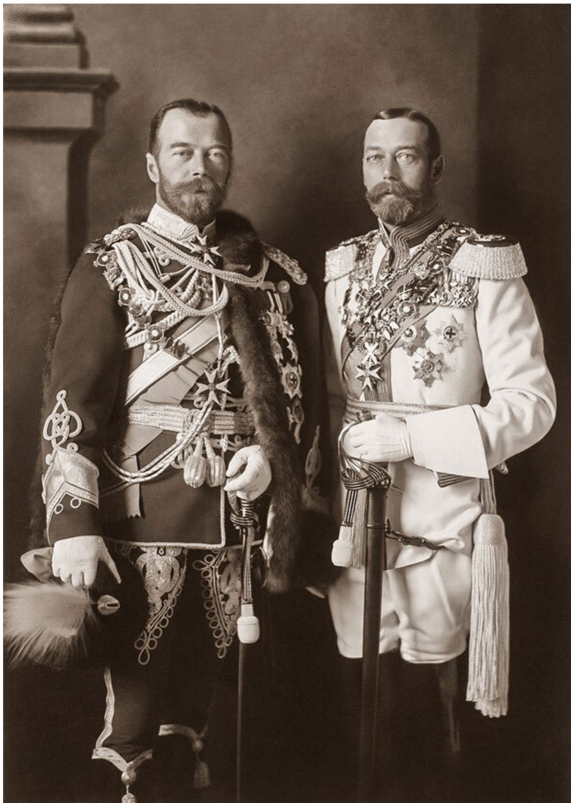
Николай II и Георг V в Берлине

Можно продолжать бесконечно. Ах, как сладка была бы долгожданная победа русского оружия в Великой войне, как желанна и заслуженна! Добыта доблестью десятков тысяч храбрых сынов народов России. Обильно политы нашей кровью поля Галиции и Мазурские болота. Выкошена почти вся кадровая русская гвардия, цвет офицерства полег. Заслужили ли мы победу? Конечно! Но вот то ли англичане, то ли немцы, то ли большевики, а может, все они