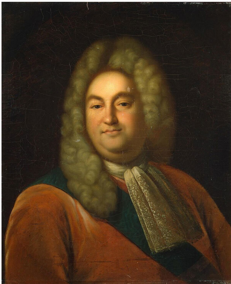
Вице-канцлер барон Петр Павлович Шафиров