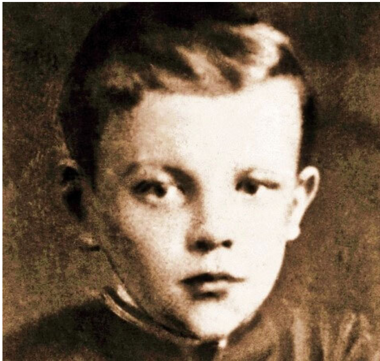
Володя Ульянов – мальчик с кудрявой головой

Началось создание новой квазирелигии еще в 1923 году. Ленин был еще жив, поэтому особенно не усердствовали, наиболее нетерпеливых даже одергивали. Старательно работали по лекалам Гражданской войны: мудрый вождь пролетариев ведет рабочих и крестьян Советской России к победе и счастью. Но все изменилось со смертью Владимира