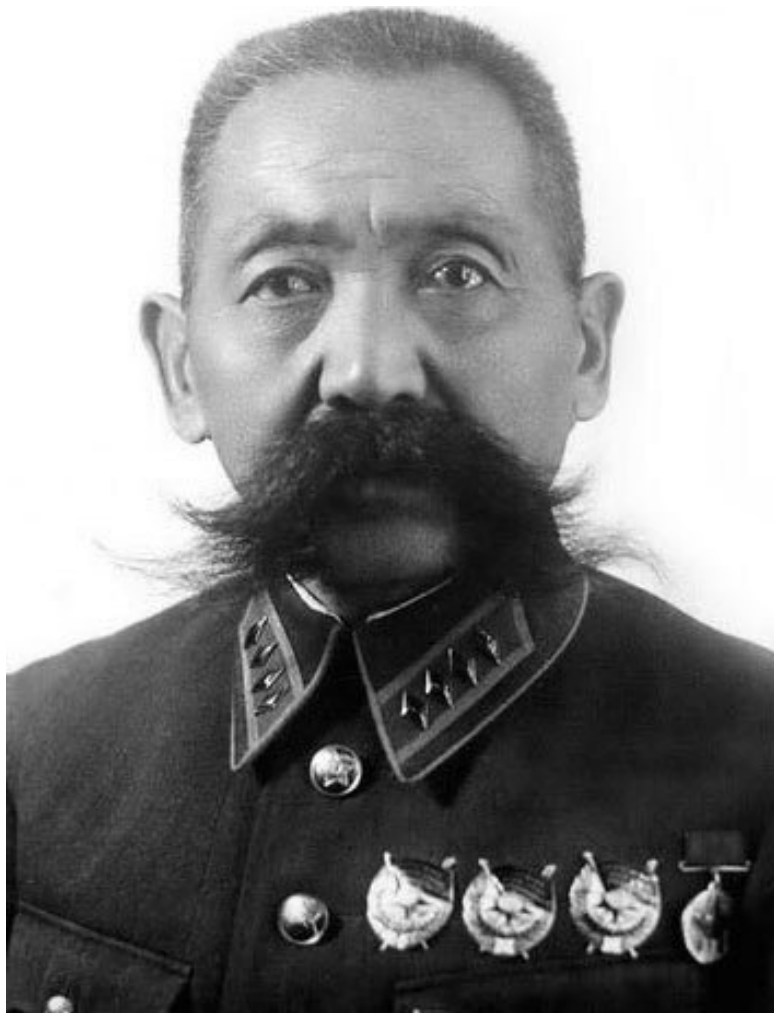
О. И. Городовиков – командир кавалерийской дивизии в