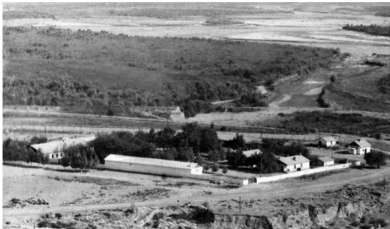
Застава «Файзабад-кала». 1980-е годы

Оказавшись в пограничной зоне, Довлатов поселился у родственников в одном из кишлаков колхоза «Пограничник», на участке моей заставы «Файзабад-Кала», находившейся на правом фланге Пянджского отряда. Несколько дней он ходил по полям, иногда приближаясь к КСП 1 , изучал, как устроена система охраны рубежа, когда сменяются наряды и так далее. Наиболее подходящим для перехода границы местом оказался участок возле бахчи, где рубеж основных инженерных сооружений пересекал арык, по которому происходил сброс воды с поливных полей в реку Пяндж. Ря-