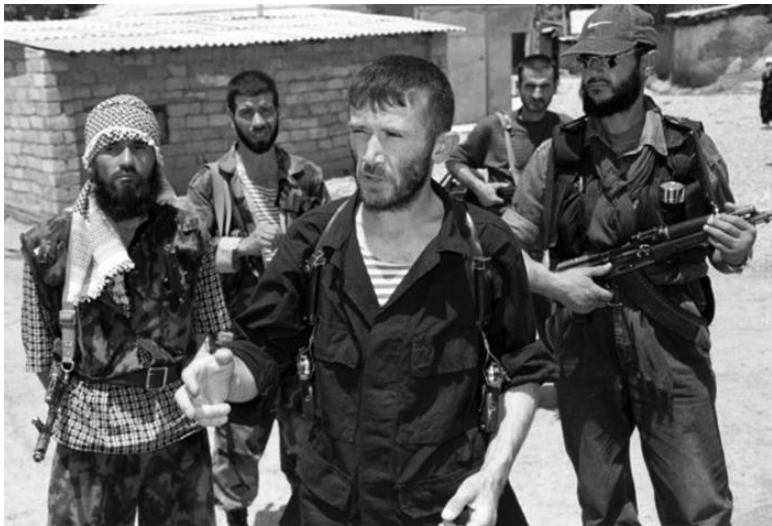
Боевики таджикской оппозиции.

Между тем в мае 1992 года в Душанбе начались волнения. По всей республике начали возникать незаконные вооруженные формирования разного политического толка, местные жители стали формировать комитеты самообороны. Одновременно страна превратилось в лоскутное одеяло.