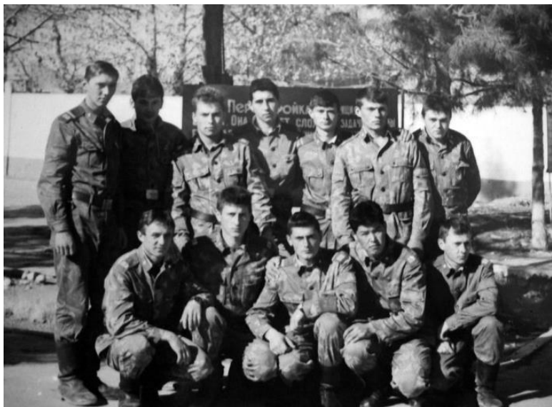
Пограничники заставы «Файзабад-кала». Конец 1980-х годов

Довлатов познакомился с бахчевником. Тот также сообщил незнакомцу некоторую информацию, связанную с охраной границы, и предупредил его, чтобы тот не ходил за «систему», иначе будет задержан пограничниками.