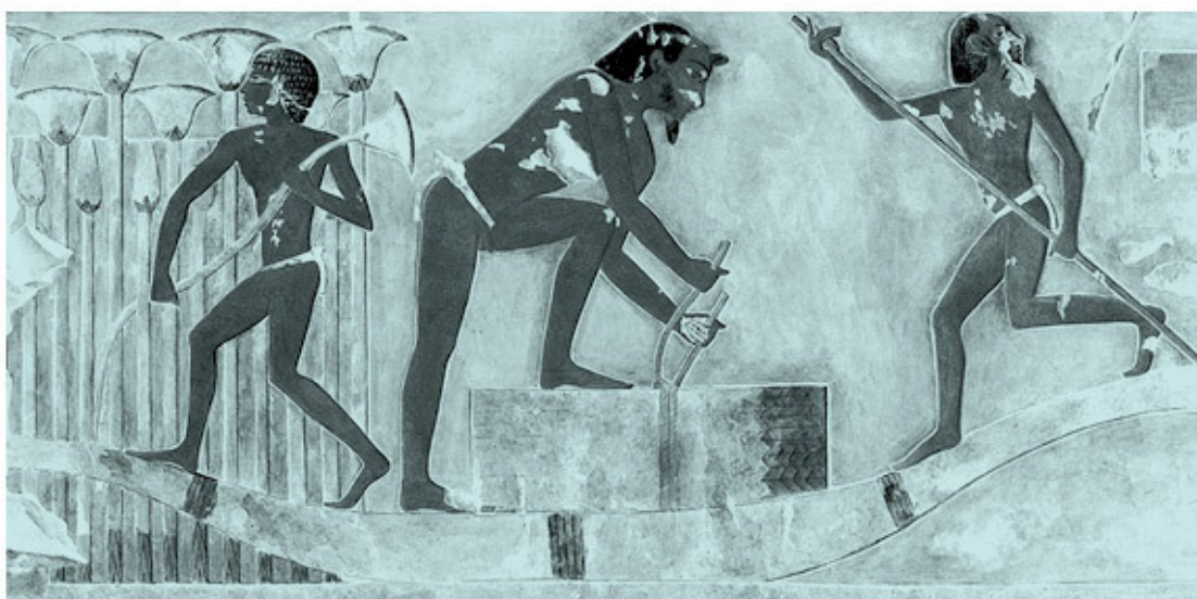
Сбор папируса. Изображение из гробницы Пуимре в Фивах. XV в. до н. э.

Во второй – только для написания текста использованы черные чернила, для рубрик – красные, а виньетки красиво раскрашены разными цветами. В папирусе Ани, который принадлежит ко второй группе, текст и виньетки хотя и сопоставимы с более ранними памятниками фиванской версии, но занимают совершенно особое во всех отношениях место. Сопоставимый по основным параметрам с папирусами XVIII династии, папирус Ани имеет орфографические особенности, которые нигде более не встречаются. Почерк первой секции указывает на период расцвета XVIII династии, но, поскольку некоторые знаки писец выписал в индивидуальной, своеобразной манере, палеографические свидетельства не имеют решающего значения.