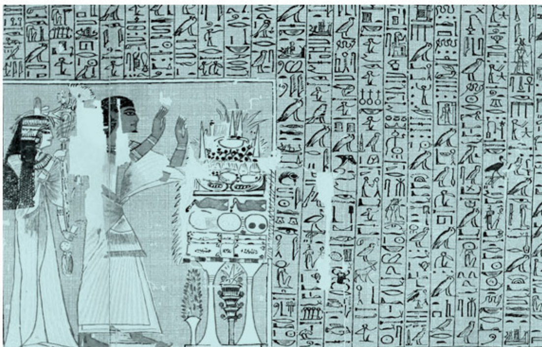
Виньетка из папируса Ани (таблица I)