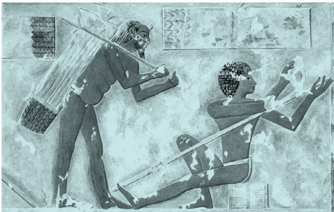
Обработка папируса. Изображение из гробницы Пуимре в Фивах. XV в. до н. э.

Папирус Ани можно разделить на две части. Первая содержит необычные версии двух гимнов Ра и Осирису, виньетку с изображением восхода солнца (глава XVIa) и сцену загробного суда с сопровождающими надписями, некоторые из которых нигде больше не встречаются. Ко второй части относятся 62 главы фиванской версии «Книги мертвых» в следующем порядке: I, XXII, LXXII, рубрика, XVII, CXLVII, CXLVI, XVIII, XXIII, XXIV, XXVI, XXXb, LXI, LIV, XXIX, XXVII, LVIII, LIX, XLIV, XLV, XLVI, L, XCIII, XLIII, LXXXIX, XCI, XCII, LXXIV, VIII, II, IX, CXXXII, X, [XLVIII], XV, CXXXIII, CXXXIV, XVIII, CXXIV, LXXXVI, LXXVII, LXXVIII, LXXXVII, LXXXVIII, LXXXII, LXXXV, LXXXIII, LXXXIV, LXXXIa, LXXX, CLXXV, CXXV, Введение и Отрицательная исповедь, XLII, CXXV, Приложение, CLV, CLVI, XXIXb, CLXVI, CLI, VI, CXLVIII, CLXXXV, CLXXXVI. Названия этих глав в нумерации Р. Лепсиуса звучат следующим образом: