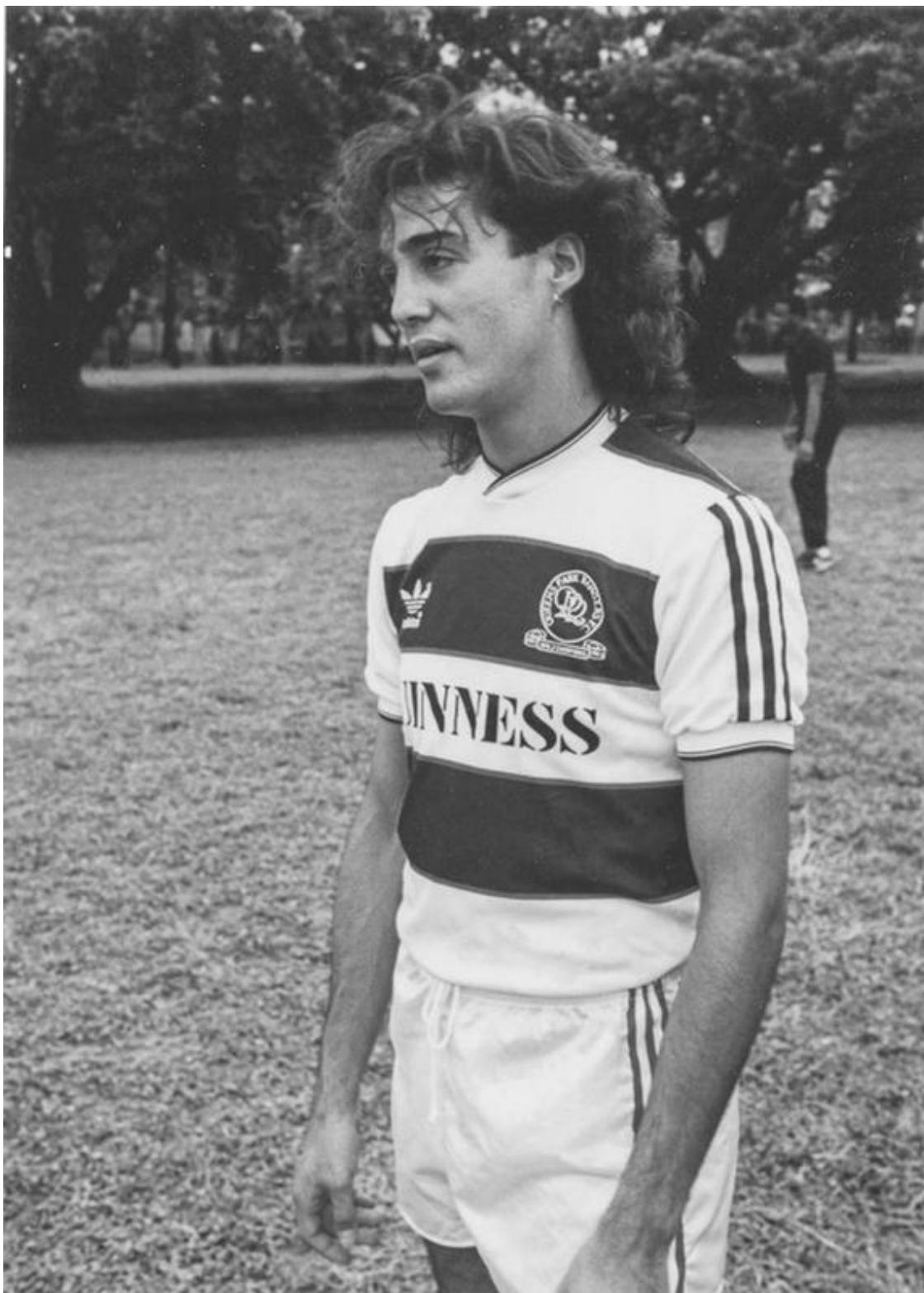
Пеле # Кройф # Робсон # Риджли #

В течение следующих нескольких дней я все больше и больше узнавал о своем новом лучшем друге. Главным открытием стала решительность, что противоречило моему первому впечатлению о нем как о застенчивом и неуверенном подростке. Йог быстро освоился в Bushey Meads.