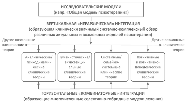
Рис. 1. Две модели теоретической интеграции в психотерапии (Orlinsky, 2009)

том вне теоретической ориентации терапевта. Двумя репрезентативными подходами этого направления являются мультимодальная терапия Лазаруса (англ. Multimodal therapy ; Lazarus, 2005) и систематический выбор лечения Ботлера с коллегами (англ. Systematic treatment selection ; Beutler, Harwood, 2000; Beutler et al., 2006).