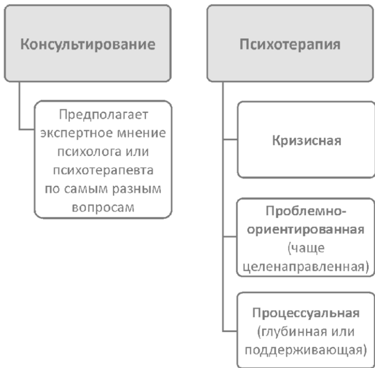
Рис. 3. Уровни индивидуальной работы

Психотерапевтическая помощь в целом разнообразнее консультативной. В самом общем виде психотерапевтический уровень включает три дополнительных: