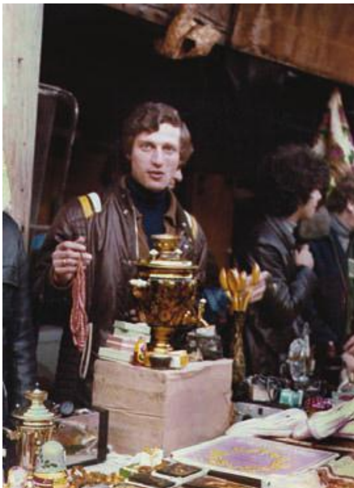
Рынок «Американо». Италия, 1977