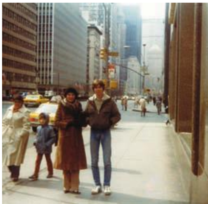
NEW-YORK. Бродвей, 1978