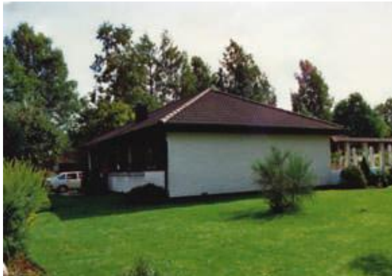
Наш дом в Швеции.

А запахи – о них как рассказать здесь мне. Они везде – и от сырой земли, остатков снега, В листе опрелом жухлом по весне, И от всего охватывает душу нега.