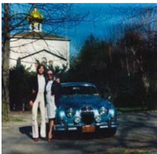
Наша церковь, 1978