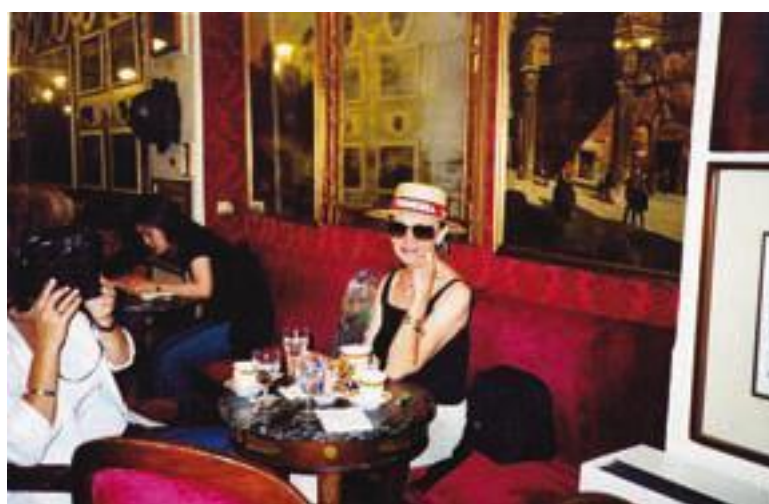
Кафе «Эль Греко». Вечный город. 25 лет спустя.

На костылях пришли, но не одни, а с помощью друзей, Внутри в ногах обоих вставлены эндопротезы, Заснули год назад бедняги за рулем И получили новые суставы из «титановой железы».