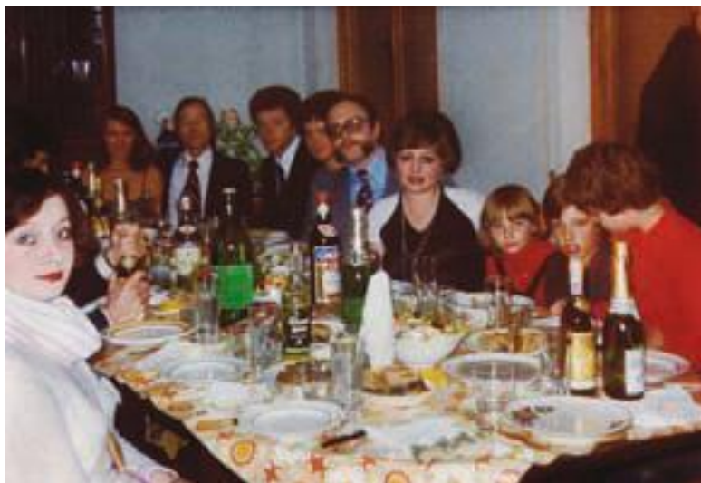
Эмигранты из Москвы. Италия. Ладисполи, 1978 Проводы в Америку.

Ну что, вернусь на пару месяцев назад, От славной встречи с Моней – даты, И в семьдесят шестом – тридцатом сентября Нас окружили в Шереметьево солдаты.