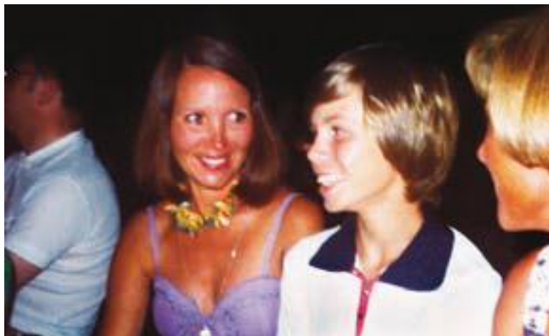
Жена и сын цветами расцвели за лето. 1977

Но не бойсь – там «Ospidale» рядом, Две «Скорых помощи» там «Subbito» придут, И бедного тебя, с огромной шишкой, К хирургам на носилках принесут.