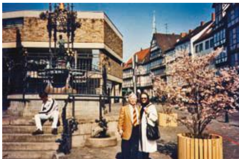
Ганновер. Домам 300–400 лет. Весна 1985 года.

Но, слава Богу, ни наркотиков, ни дури, В то время по Германии почти и не сыскать, Случаются, я думаю, банальные студенческие пьянки, Но лучше ты у Пушкина спроси, нам их не избежать.