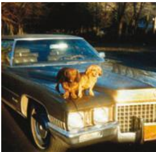
Наш «Кадиллак». Наши две собачки: «Итальянец и русская девочка». Из этого «Кадиллака» выпал американский

Невероятный тот авто стоял почти что новый, Ведь это целый самолет, вот это да, Там двигается все простым нажатьем кнопки,