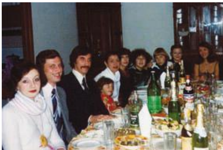
Эмигранты из Москвы. Италия. Ладисполи, 1978 Проводы в Америку.

Никто в последний путь нас не сопровождал, А в стороне стояла мать, тихонечко рыдая. Догадываюсь я, что думала она, В то никуда и без надежды встретиться сыночка провожая.