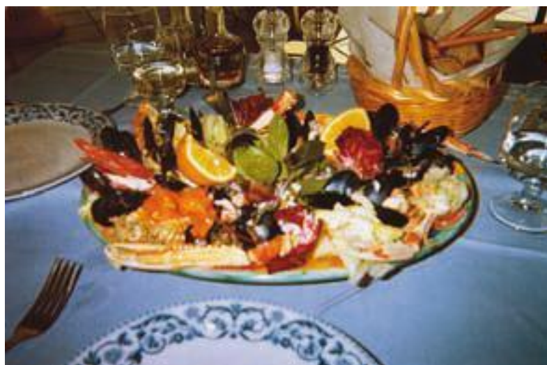
Таким блюдом балуют гостей в Ristorante Antonio u Nello Sorriso.

Теперь, гуляючи по Via Roma, И ты мне в этом даже не перечь, Я, как большой лингвист, – я в этом разбираюсь, Я слышу от детей украинскую речь.