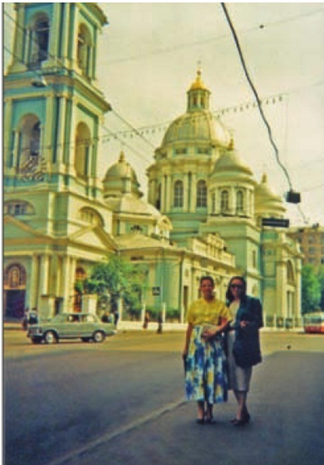
Елоховская церковь. В этой церкви крестили А. С. Пушкина.

На праздники весны здесь выпускают птицу, Относит птичек вдаль воздушный ветерок, И хочется воды намоленной напиться, И хочется ее забрать с собою впрок.