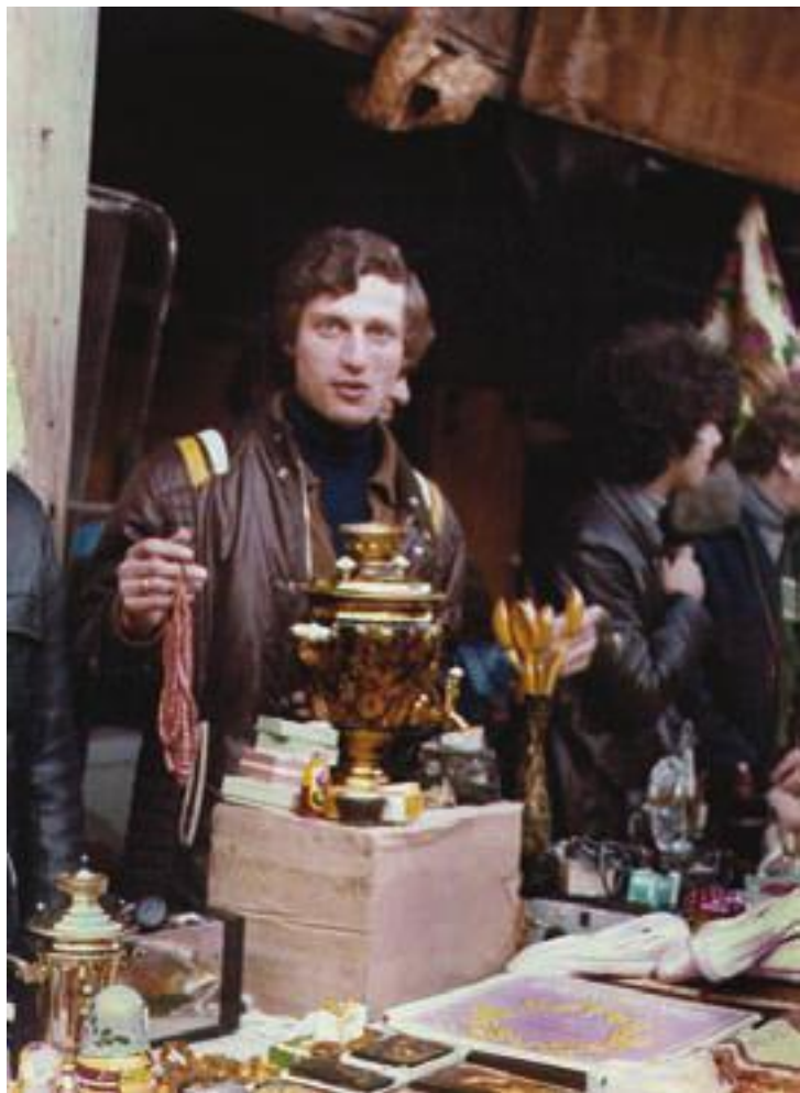
Рынок «Американо». Италия, 1977