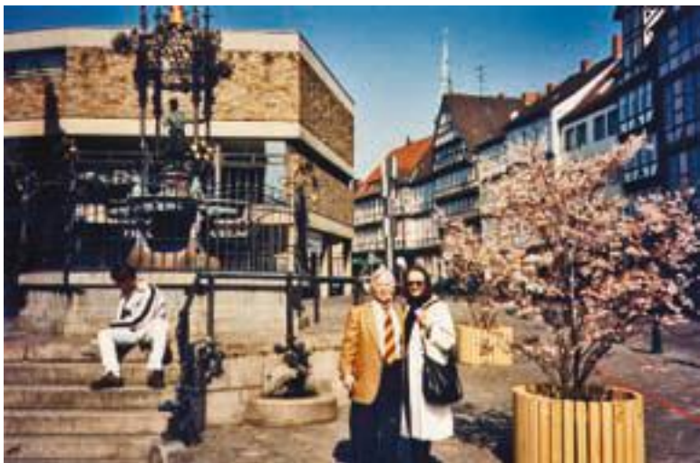
Ганновер. Домам 300–400 лет. Весна 1985 года.

Но, слава Богу, ни наркотиков, ни дури, В то время по Германии почти и не сыскать, Случаются, я думаю, банальные студенческие пьянки, Но лучше ты у Пушкина спроси, нам их не избежать.