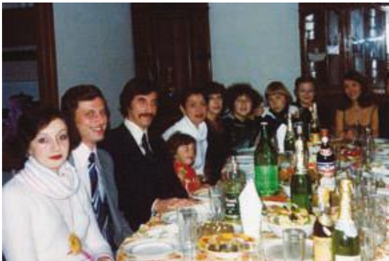
Эмигранты из Москвы. Италия. Ладисполи, 1978 Проводы в Америку.

Никто в последний путь нас не сопровождал, А в стороне стояла мать, тихонечко рыдая. Догадываюсь я, что думала она, В то никуда и без надежды встретиться сыночка провожая.