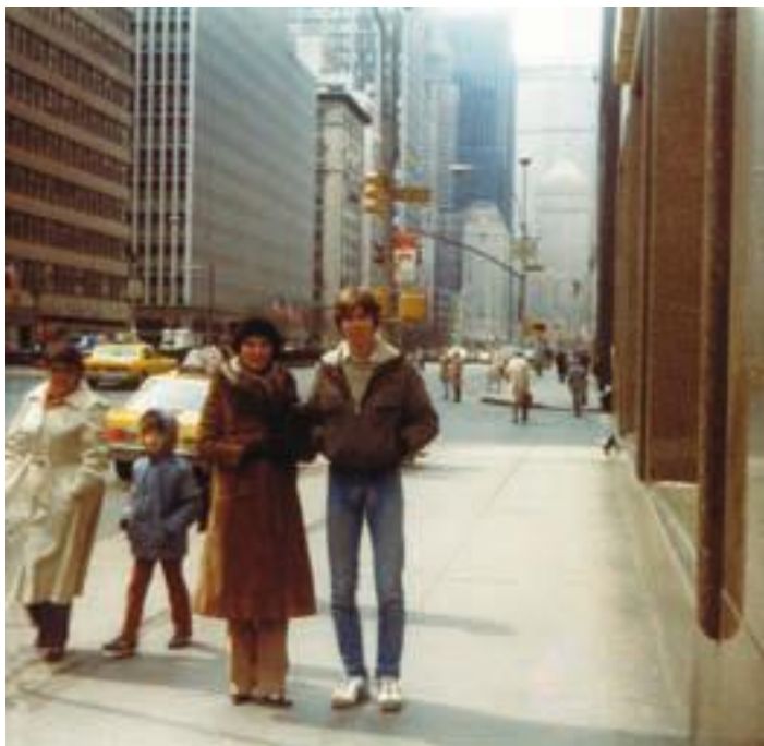
NEW-YORK. Бродвей, 1978