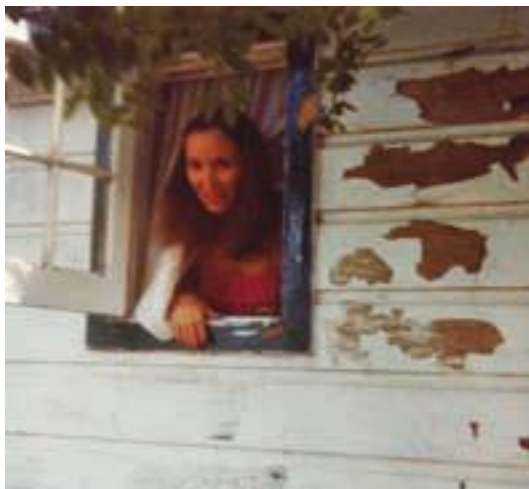
Америка-наш дом. 1978