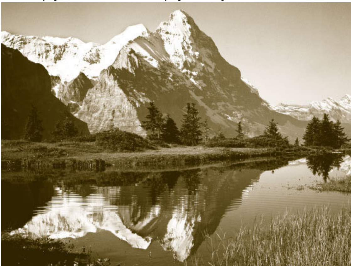
Горы в Швейцарии

Дом для отдыха, выбранный благодаря его высокогорному расположению и близости к лесу, который служит ему защитой, санаторий является чем-то вроде тюрьмы: проживающие в нем похожи на добровольных затворников, приехавших сюда, чтобы подчиниться жесточайшей дисциплине – единственному, что способно помочь им выпутаться. ...Гала помнит выражение страха в глазах близких, страха вызванного одним названием болезни (как потом это будет с раком или СПИДом: достаточно лишь их упомянуть). Ей знакома тревога тяжелобольных – та, что бродит ночами по комнате, в то время как эхо разносит по гулким коридорам приступы зловещего кашля безнадежных больных. Даже если врачи утверждают, что болезнь девушки в зачаточном состоянии и у нее чахотка в легкой форме, она может считать себя приговоренной к более или менее отдаленному трагическому исходу. Гала думает, что дни ее сочтены и она умрет молодой. Отсюда ее неудержимое стремление жить.