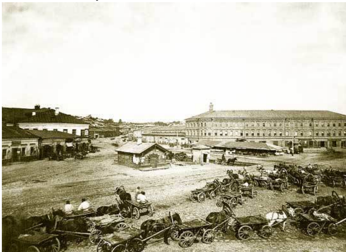
Казань. Конец XIX – начало XX вв.