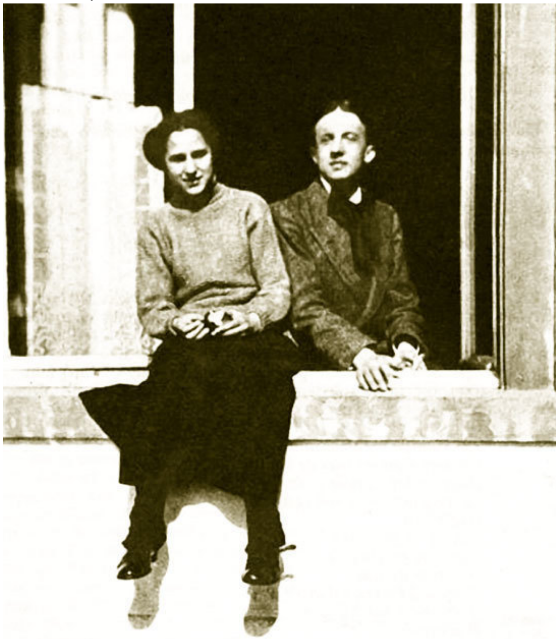
Гала и Поль Элюар в Клаваделе. 1913 г.