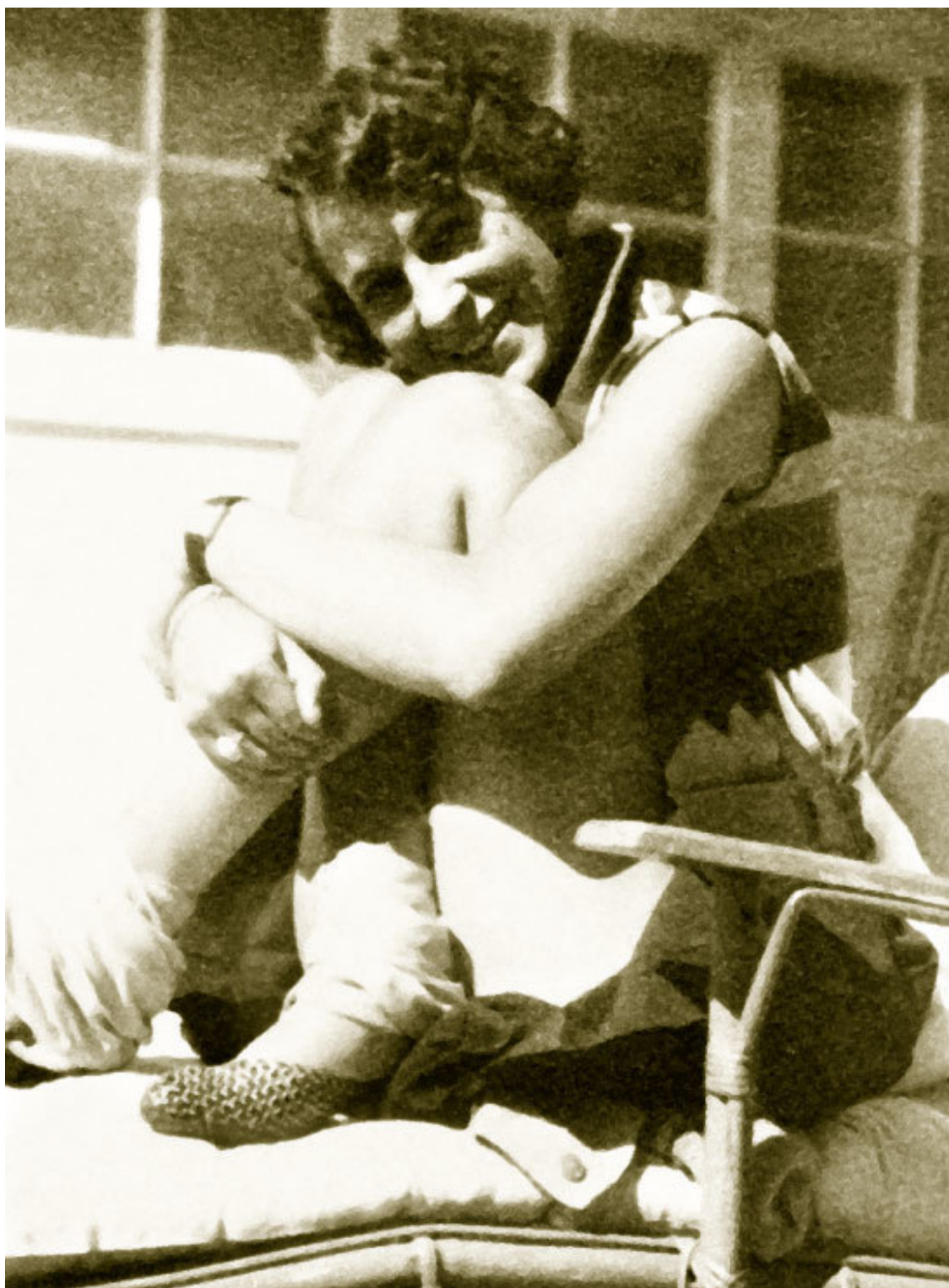
Гала заронила семя любви в сердце семнадцатилетнего Поля

Но до этого еще далеко. А ею уже было написано: «Я люблю тебя бесконечно. Это единственная правда». Это своеобразная клятва молодой девушки своему жениху в канун свадьбы.