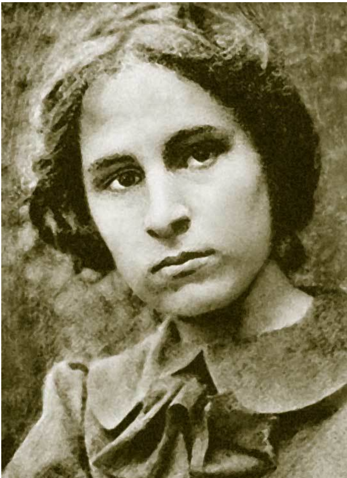
Елена Дьяконова в 16 лет

Как уже говорилось, семья Дьяконовых-Гомбергов переехала в Москву, поселившись в доме номер 14 по улице Трубниковской, на последнем, шестом этаже нового дома. Девочка идет учиться в гимназию (позже здесь будет учиться и ее младшая сестра), в одном классе с ней Анастасия – дочь университетского профессора истории И.В. Цветаева. Они быстро становятся подругами, и вскоре Елена уже частый гость в красивом и богатом доме Цветаевых в Трехпрудном переулке. Елена вовсе не была зажатой провинциалкой из Казани, попавшей