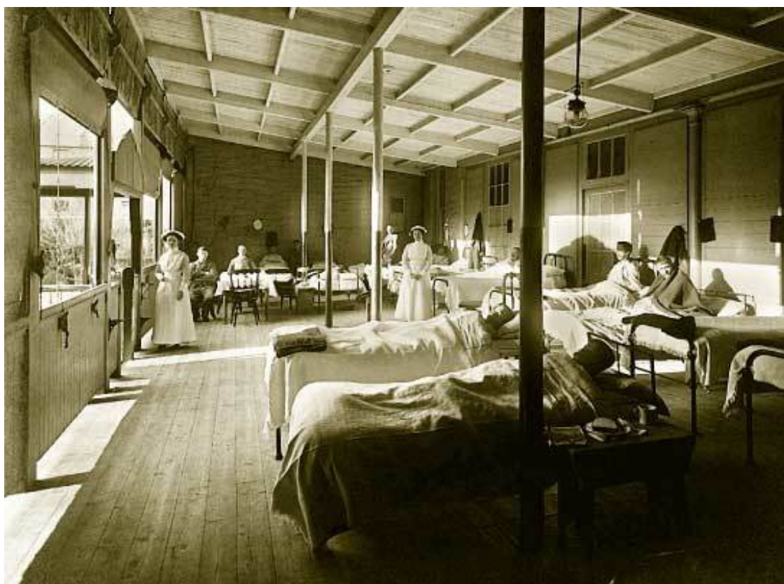
В стенах лечебного пансионата

Исследователи жизни будущей Музы также отмечали черты ее характера и поведения, к которым стоило бы присмотреться психологам и психиатрам. Что, без сомнения, стало бы ключиком к шкафу с пресловутыми скелетами. «Восемнадцатилетняя Гала – нелюдимая, холодная, суровая, раздражительная, одинокая. Девушка до такой степени замкнута, что это наводит на мысль: не скрывает ли она что-нибудь? Есть ли ей о чем умалчивать? Тайна происхождения? Болезненные воспоминания? А может, она предпочитает навсегда отделаться от своего прошлого, чтобы не оживлять, думая о нем беспрестанно, неизбежное страдание. Елена ничего не говорит о своем прошлом, о своей биографии. Любой вопрос о предыдущей жизни выводит ее из себя».