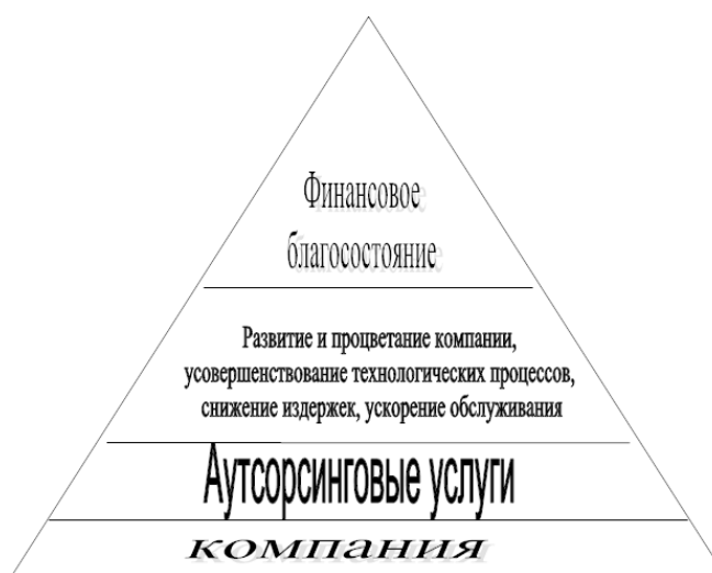
Рис. 1 Пирамида использования фирмой аутсорсинговых услуг.

С точки зрения перспектив бизнеса по ведению учета, можно смело говорить о тенденции к расширению, росту ассортимента деловых услуг эккаунтинговых компаний, как на западе, так и российских учетных центров. Имеющаяся тенденция вызвана не только и не столько соображениями маркетинга и желанием диверсифицировать свой бизнес, сколько потребностями клиентов и прекрасной возможностью объемнее использовать получаемую от клиентов ценную информацию в совокупности с реальным, собственным опытом.