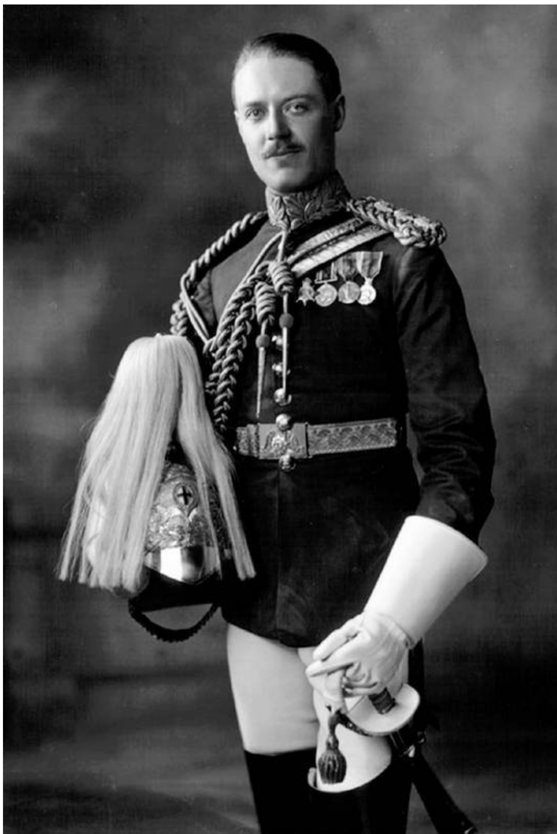
Альберт Эдвард Джек Спенсер, виконт Элторп – дедушка Дианы по отцу. Фото 1921 года