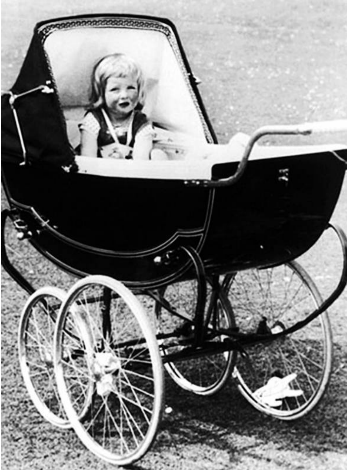
Диане исполнилось два года

Граф Спенсер, недовольный происходившим и лишенный всяческого сочувствия, стал настойчиво требовать рождения наследника. Но теплым вечером 1 июля 1961 года на свет появляется девочка Диана Фрэнсис. И лишь в мае 1964 года родился долгожданный наследник рода Спенсеров Чарльз.