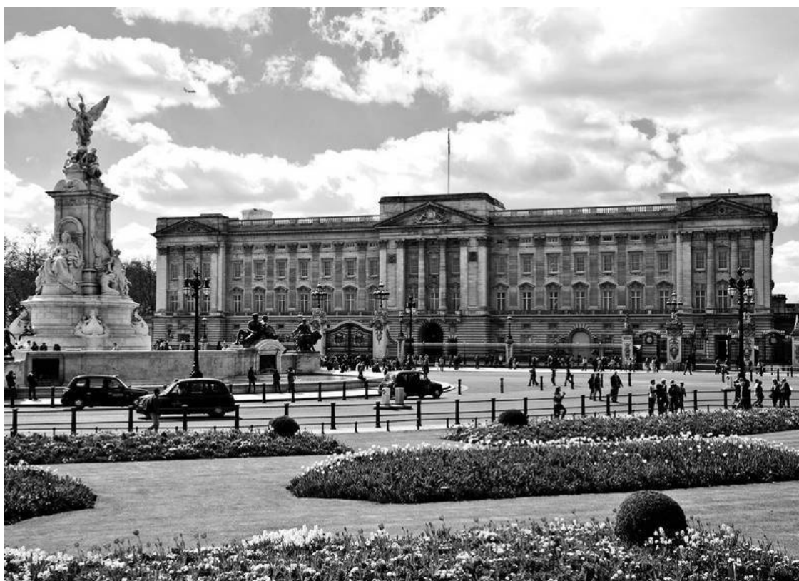
Букингемский дворец – официальная лондонская резиденция британских монархов

– Отъезд матери стал самым болезненным эпизодом моего детства. От меня просто утаили факт, что я покинута навсегда, – призналась как-то принцесса Уэльская своей подруге Козиме Сомерсет.