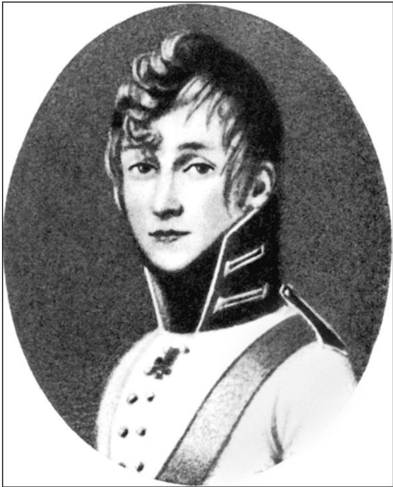
Сергей Николаевич Тургенев – отец писателя. Неизвестный художник. 1810-е гг.