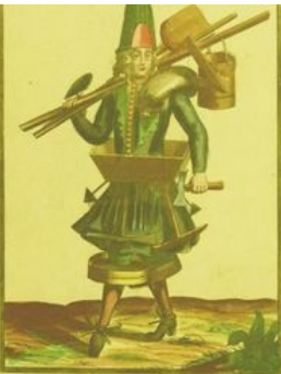
Habit de Maçon