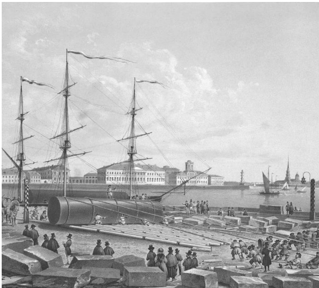
Перед нами город, возникший в эпоху зарождающегося империализма.