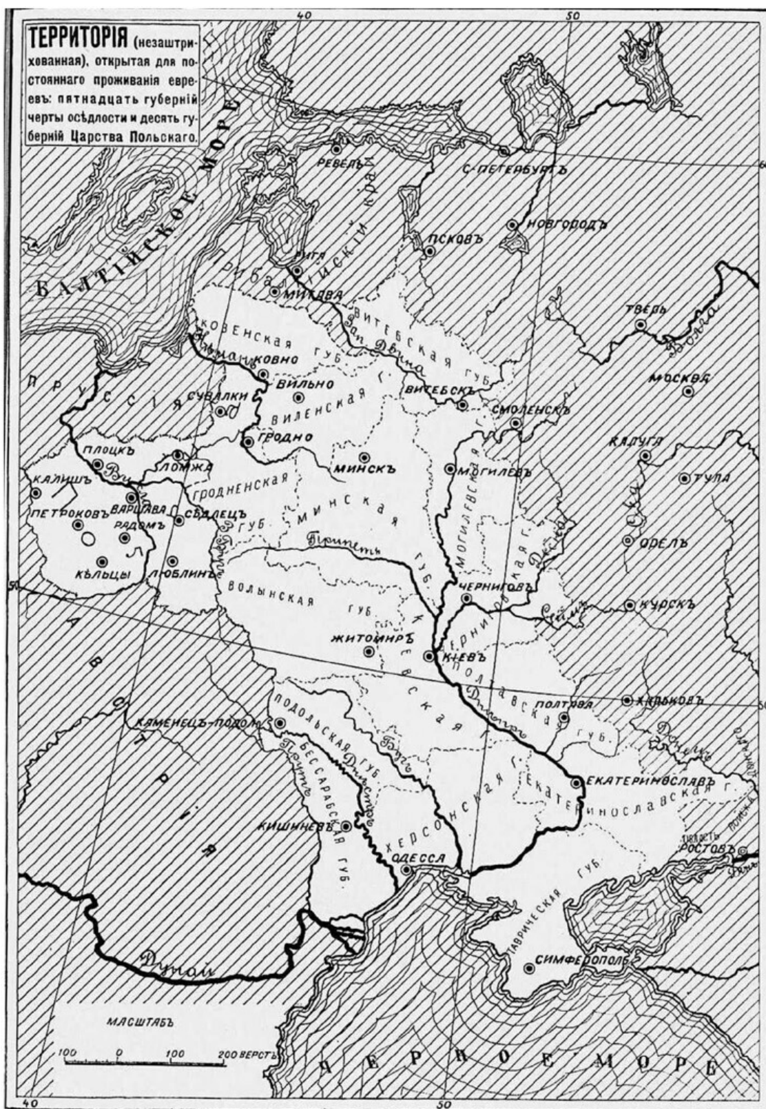
Рис. 3. Черта оседлости. Карта из книги Ю. И. Гессена «История евреев в России» (СПб.: Тип. Л. Я. Гинзбурга, 1914)

Вплоть до XIX века обвинения в ритуальном убийстве были мало распространены в Российской империи – по двум причинам: слабый интерес православных к ритуальным убийствам как таковым и отсутствие евреев, которым запрещалось проживать в империи до конца XVIII века. Однако в результате разделов Речи Посполитой при Екатерине II население страны