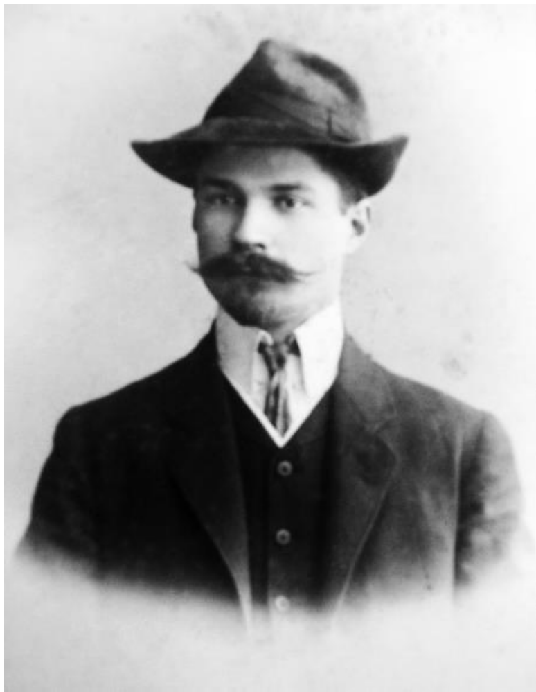
Замятин в Санкт-Петербурге (приблизительно 1910 год)