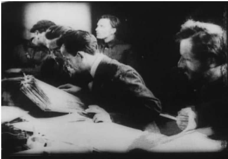
Фото 1. Секретари суда читают досье. «Кино-правда № 7», 1922. Стоп-кадр

нием и являются определяющими для этих служб.