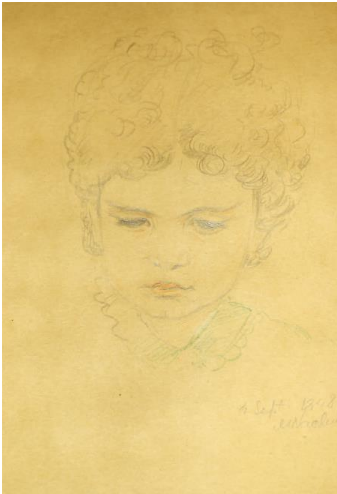
Рис. 4. Магда Нахман. Портрет Примаверы, 1948

Полтора месяца. Был только день первый, но я уже чувствовала, что время ограничено. Сразу после ухода моей хозяйки (которая сначала повозила меня по магазинам, а потом накоп-