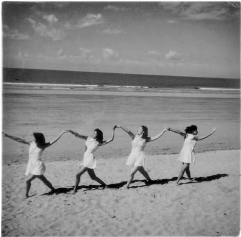
Рис. 3. Ученицы Хильды Хольгер на пляже Джеху

В этот ранний час пляж, окутанный легким туманом, был почти пуст. Несколько человек занимались йогой, кто-то совершал пробежку вдоль воды, фотографы расставляли свои