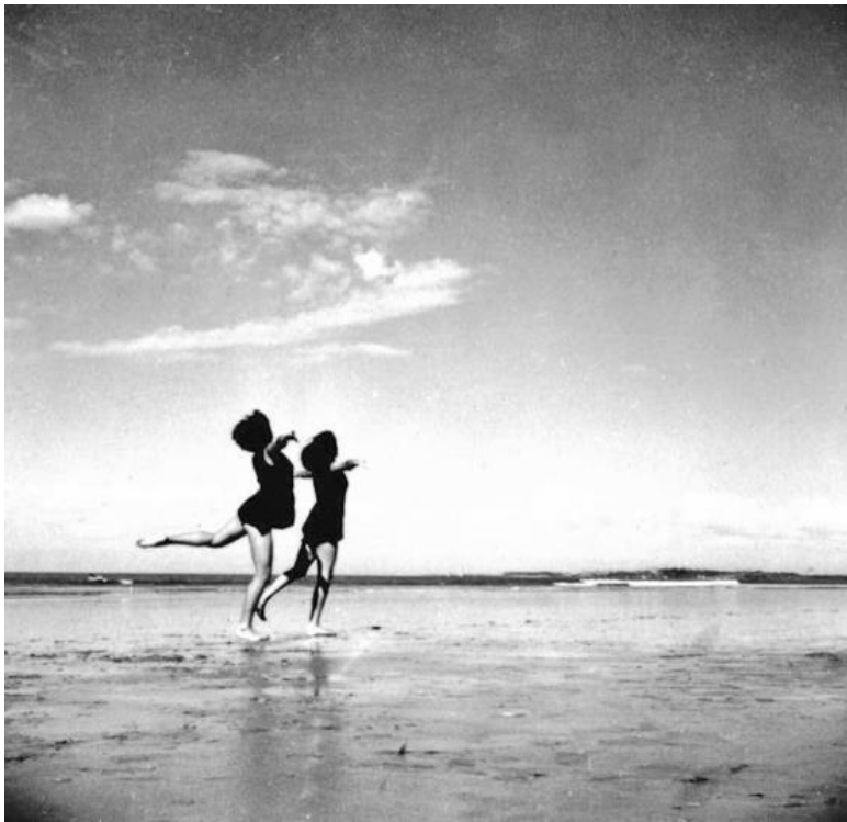
Рис. 2. Ученицы Хильды Хольгер на пляже Джеху в Бомбее

Магда прожила в Бомбее с 1936 до 1951 года. Город был застроен англичанами в стиле неоготики. В середине 1930-х Бомбей превратился в строительную площадку. На осушен-