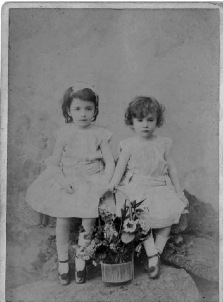
St. Petersburg G. W. ... R. ... & F. Schrader