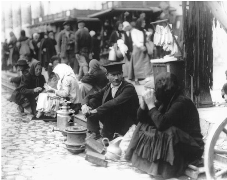
Рис. 1. Торговля на тротуарах на Сухаревском рынке (Сухаревке).

Правовой статус базаров был неоднозначным. Общего запрета на них никогда не существовало, как и общего запрета частной торговли. Местные чиновники время от времени принимали в отношении спонтанных рынков жесткие меры: во многих городах отряды милиционеров и чекистов перио-