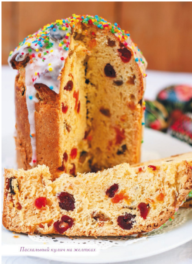
Пасхальный кулич на желтках