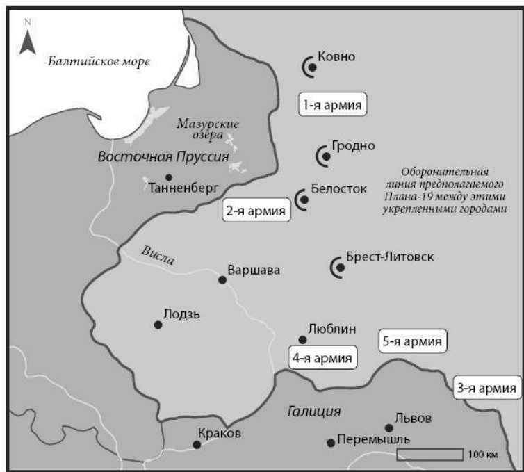
Карта 2. Русские войска в Польше. План 19 и 19 А

в Восточной Пруссии в районе Мазурских озер, в то время как 3-я, 4-я и 5-я армии должны были вторгнуться в австрийскую Галицию, соединившись на линии Львов – Перемышль, и предотвратить отступление австрийских войск либо за Днестр, либо к Кракову (см. карту 2) [Восточно-Прусская операция 1939:92-95]. Эта стратегия была реализована в августе 1914 года.