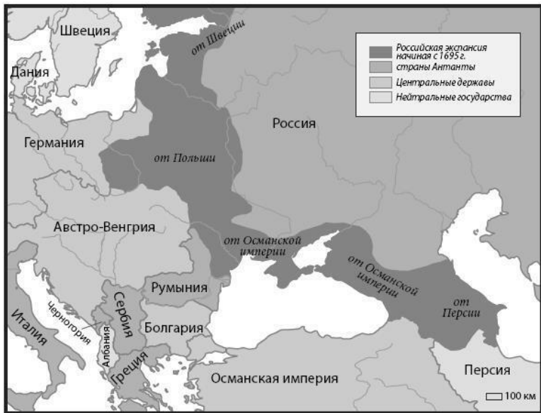
Карта 1. Имперские окраины в Восточной Европе

Этническая ситуация в торговле была столь же сложной. Армяне и греки играли значительную роль в торговой системе Османской империи, а евреи – такую же роль в России. Российская империя в основном ограничивала территорию проживания евреев чертой оседлости и ущемляла в правах владения землей, поэтому евреи почти исключительно занимались торговлей на огромных территориях региона, покупая и продавая товары крестьянам-славянам. Соци-