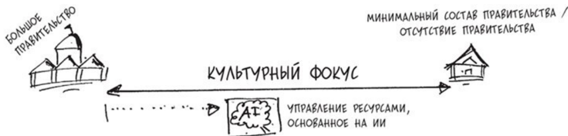
Рисунок 5. Управление государственными ресурсами на основе искусственного интеллекта позволит большому правительству снизить затраты, уменьшая количество аргументов против социальной политики

Социальные сети и распространение коллективного и родового взгляда на человечество также вовлекают всё более широкие слои населения в политическую жизнь по всему земному шару.