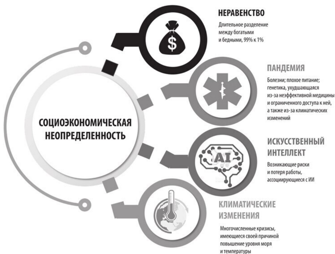
Рисунок 2. Основные факторы стресса, ведущие к эпохе разрушительных социальных перемен

Общемировое сопротивление стимулирующим неравенство факторам при поддержке растущих опасений по поводу безработицы, вызванной внедрением технологий и усиливающимися последствиями изменения климата, выльется в коллективные действия, с помощью которых мы попытаемся спастись от хаоса. Пандемия – всего лишь кратковременный кризис, но вероятны и новые пандемии. Зарождающееся глобальное движение уже возглавляет поколение людей, которые отвергают общепринятую точку зрения, идеологически ориентированы на более всестороннее мышление, обладают большей социальной сознательностью и верят, что технологии можно использовать для решения самых сложных мировых проблем. Они хотят подтолкнуть нас вперед, тогда как старая гвардия бесится из-за того, что мы движемся слишком быстро, и вспоминает старые добрые времена. Это известный конфликт поколений, но, когда политики стареют и ностальгируют, всё перерастает в более широкий социальный конфликт.