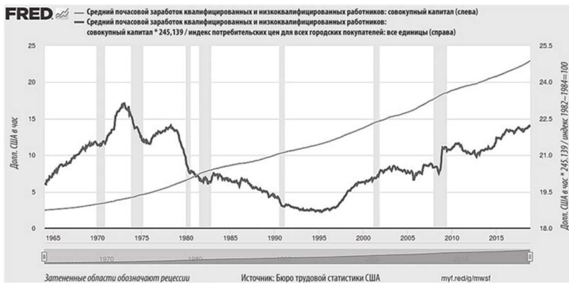
Рисунок 8. Реальный рост заработной платы в Соединенных Штатах сегодня остается ниже уровня 1970-х годов

Экономисты, оглядываясь на эпоху, предшествующую Великой депрессии в США, считают производственную линию Генри Форда ключевым механизмом, обеспечившим более широкое распределение богатства. Бум производства и технологических инноваций после Второй мировой войны позволил Соединенным Штатам создать крепкий средний класс. Сегодня же реальная заработная плата большей части населения США фактически не растет в течение более чем 40 лет. Стремление обвинить в этом отсутствии улучшений иммигрантов или внешние факторы, а не перекосы политической системы, – хорошо зарекомендовавшая себя политическая стратегия, восходящая к Калифорнийской «золотой лихорадке». Есть ли более рациональное объяснение такому длительному разрушению ядра среднего класса?