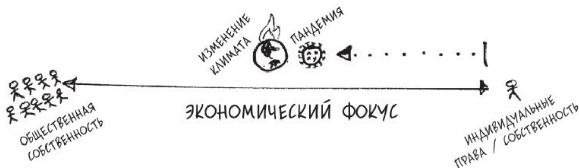
Рисунок 4. Экономическая неопределенность, вызванная неравенством, пандемиями и изменением климата, заставит капитализм решать общие проблемы, связанные с доходами отдельных лиц

Следуя традиции, политики утверждают, будто капитализм – неотъемлемая часть экономической системы, гарантирующей права личности. Но капитализму не удалось предотвратить величайшие кризисы, с которыми мы столкнулись, а потому необходимо искать баланс между правами личности и интересами общества, поскольку экономика должна работать на благо всех граждан в долгосрочной перспективе. Таким образом, изменение климата, неравенство и продолжающиеся пандемии в течение следующих нескольких десятилетий будут подталкивать экономическую политику ближе к центру.