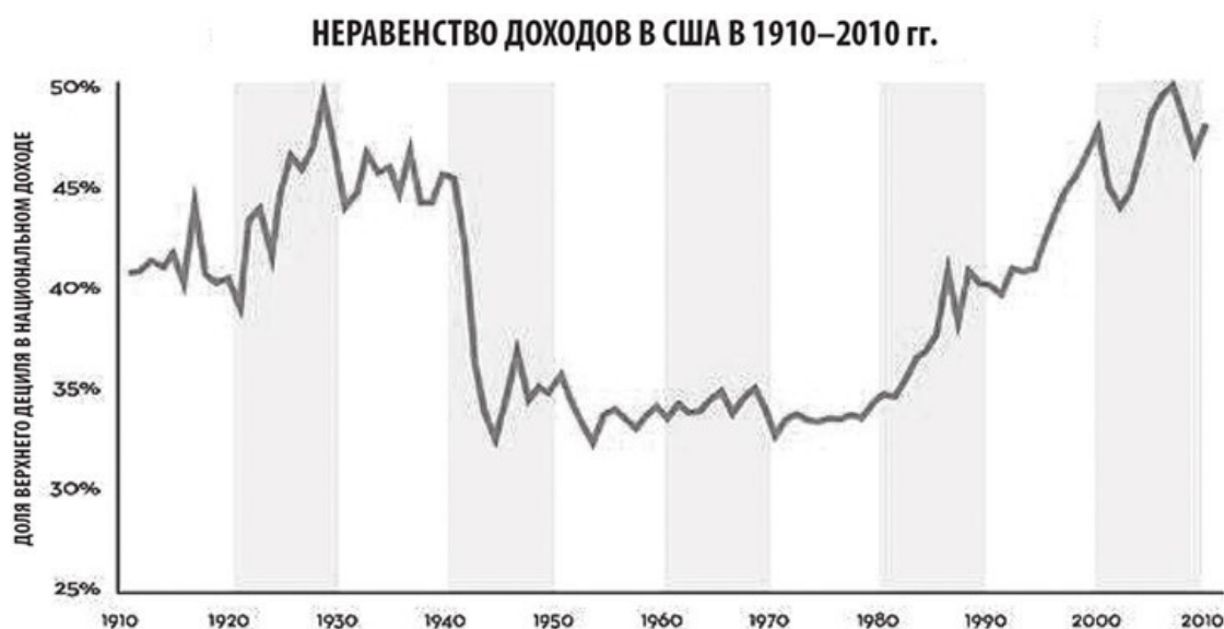
Рисунок 3. Коэффициент Джини в США с 1910 года по сегодняшний день. К концу 2020 года расчетный коэффициент Джини составлял 0,54 (самый высокий показатель в истории)

В то время как многие другие западные страны за последние несколько десятилетий пострадали от аналогичного роста неравенства, форма крайнего капитализма в Соединенных Штатах имеет свои недостатки. Как отметил экономист Томас Пикетти в своей книге «Капитал в XXI веке» 18 , в настоящее время в Соединенных Штатах уровень неравенства «вероятно, выше, чем в любом другом обществе в любое время в прошлом и в любой точке мира». И так было еще до того, как пандемия коронавируса обострила эту проблему.