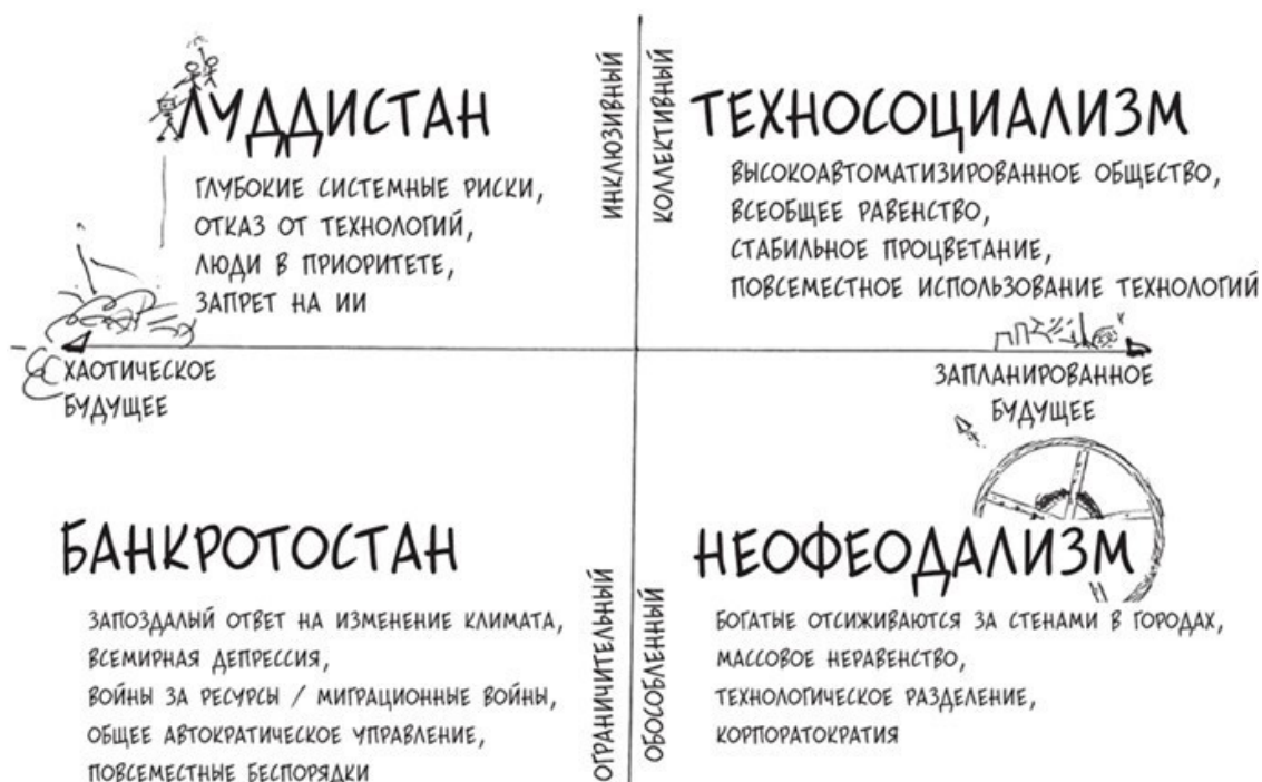
Рисунок 6. Вероятные варианты будущего для человечества

• Неофеодализм. Необузданный капитализм, отвергающий потребность в равенстве и неспособный обеспечить широкий экономический рост при сокращении занятости и потребления. Существующая долгие годы пропасть между богатой элитой и бедняками достигает пиковой точки, нарастают революционные настроения и протесты, средний класс исчезает. Сверхбогатые получают доступ к технологиям долголетия, искусственному интеллекту и ни в чем не нуждаются в закрытых анклавах, в то время как массовая безработица, голод и болезни становятся нормой для тех, кто остался снаружи.