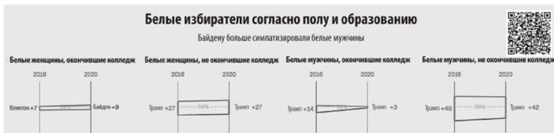
Рисунок 7. Белые избиратели, не окончившие колледж, поддержавшие Трампа в 2016 и 2020 годы

Если вы знакомы с историей, то знаете, что термин «американская мечта» впервые употребил Джеймс Траслоу Адамс в своей книге 1931 года «Эпос Америки». Он описал это так: «мечта о стране, в которой жизнь обязательно будет лучше, богаче и полнее для всех и предоставит возможности каждому в соответствии с его способностями или достижениями». Принцип прост: если вы много работаете, чем-то жертвуете и идете на определенный риск, то можете достичь успеха, о котором и мечтать не смели ни ваши родители, ни предшественники. «Американская мечта» также гарантировала, что вашим детям жить будет лучше, чем вам. Но мечта эта основывалась на постоянном экономическом росте, справедливом распределении богатства и сохранении возможностей для следующего поколения. К 1980-м годам этот экономический потенциал для подавляющего большинства населения США истощился.