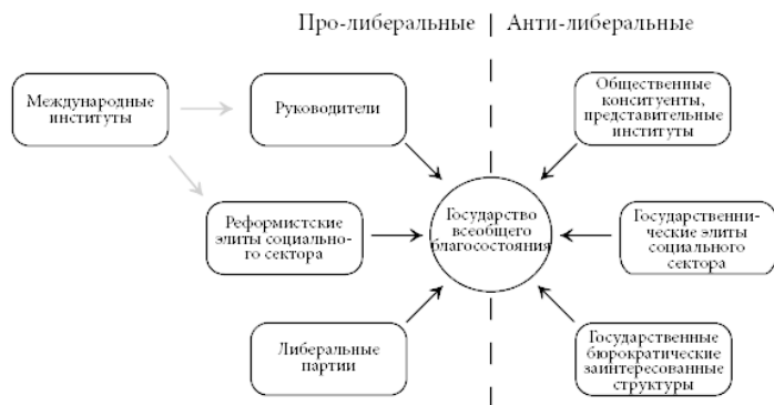
Рис. 1.1. Основные акторы в посткоммунистическом ре-

страторов социального сектора, министерства социального сектора и другие бюрократические структуры, никогда не были подотчетны своим рядовым участникам или широкой общественности. Они занимали привилегированные позиции в государстве всеобщего благосостояния. Когда коммунистическая система рухнула, эти элиты социального сектора раскололись на реформистскую группу либеральных технократов, которые объединились с исполнительными властями, и группы государственников, защищавших старую систему (рис. 1.1). Там, где оставались сильные государственных заинтересованные структуры, они сосредотачивались на сохранении ресурсов и прерогатив или на торговле, чтобы компенсировать потери как формальными, так и неформальными стратегиями.