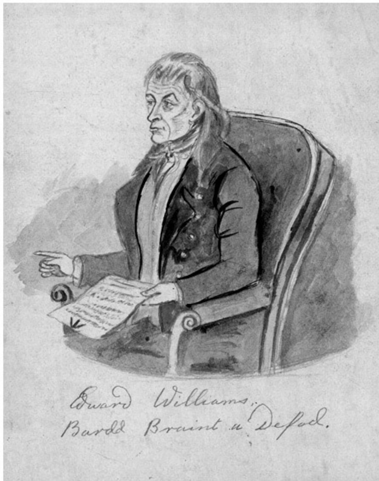
Неизвестный художник, портрет Йоло Моргануга (ок. 1800).