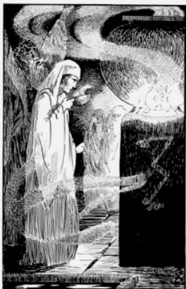
THE RITE OF INITIATION