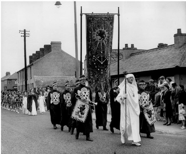
Процессия бардов и друидов, Национальный эйстедвод (1951).

Со времен Йоло Моргануга ключевой фигурой романтического движения был бард Талиесин, «величайший из поэтов». (Йоло даже назвал его именем своего сына.) Некоторые средневековые источники, имеющие отношение к Талиесину, рассказывают о его способности изменять облик, присутствовать повсюду и видеть все, так что, возможно, его считали кем-то вроде друида. В наши дни в моду вошел ша-