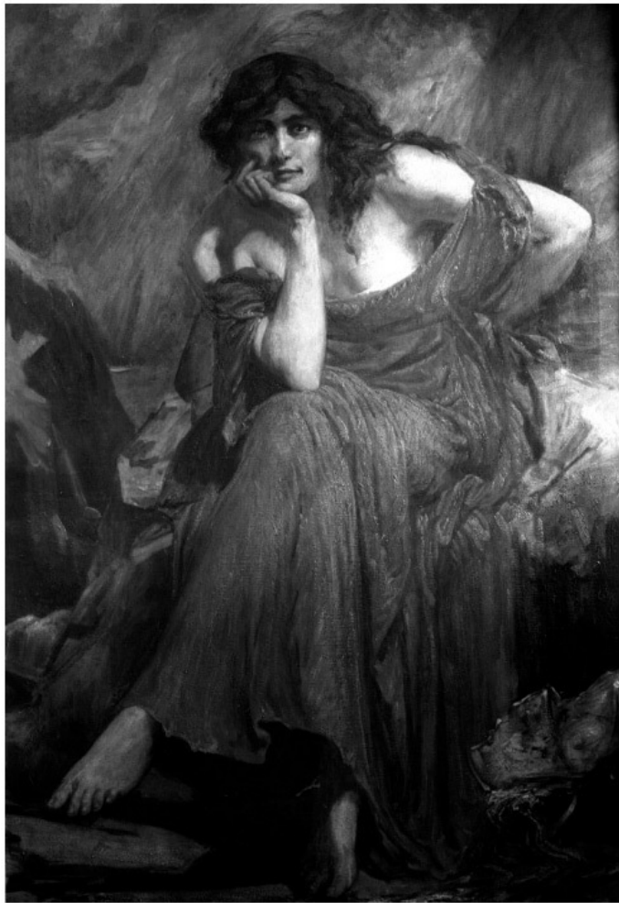
Кристофер Уильямс, «Керидвен» (1910). Glynn Vivian Art