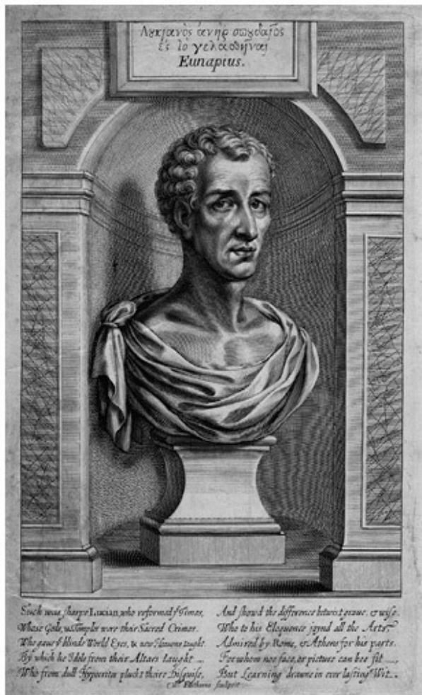
Уильям Фэйторн, «Лукиан Самосатский» (1711). National