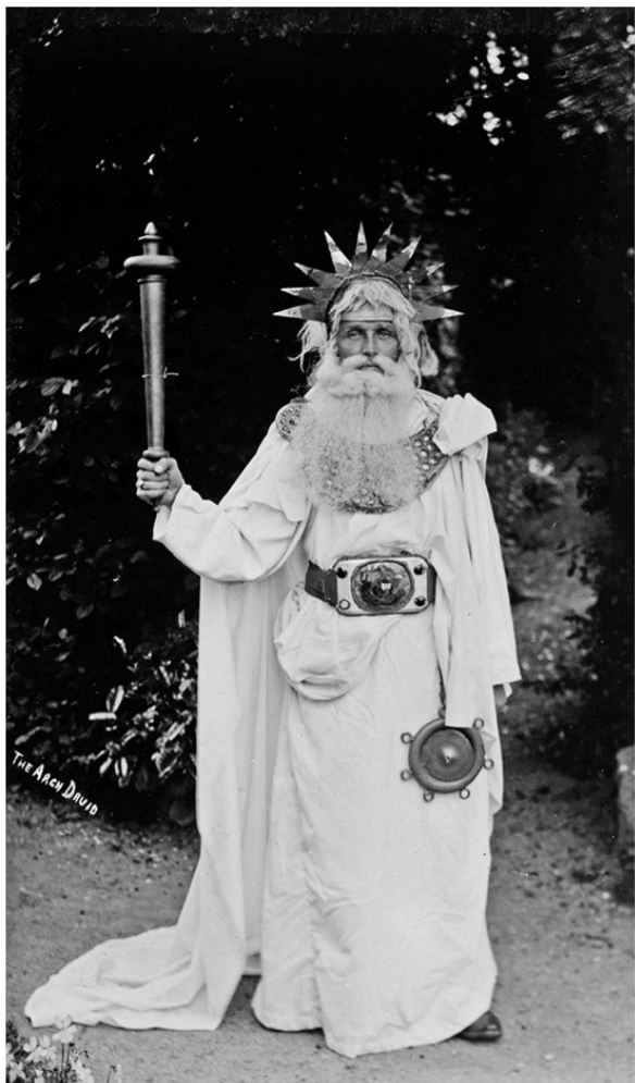
Архидруид из Билт-Уэллза, историческое празднование