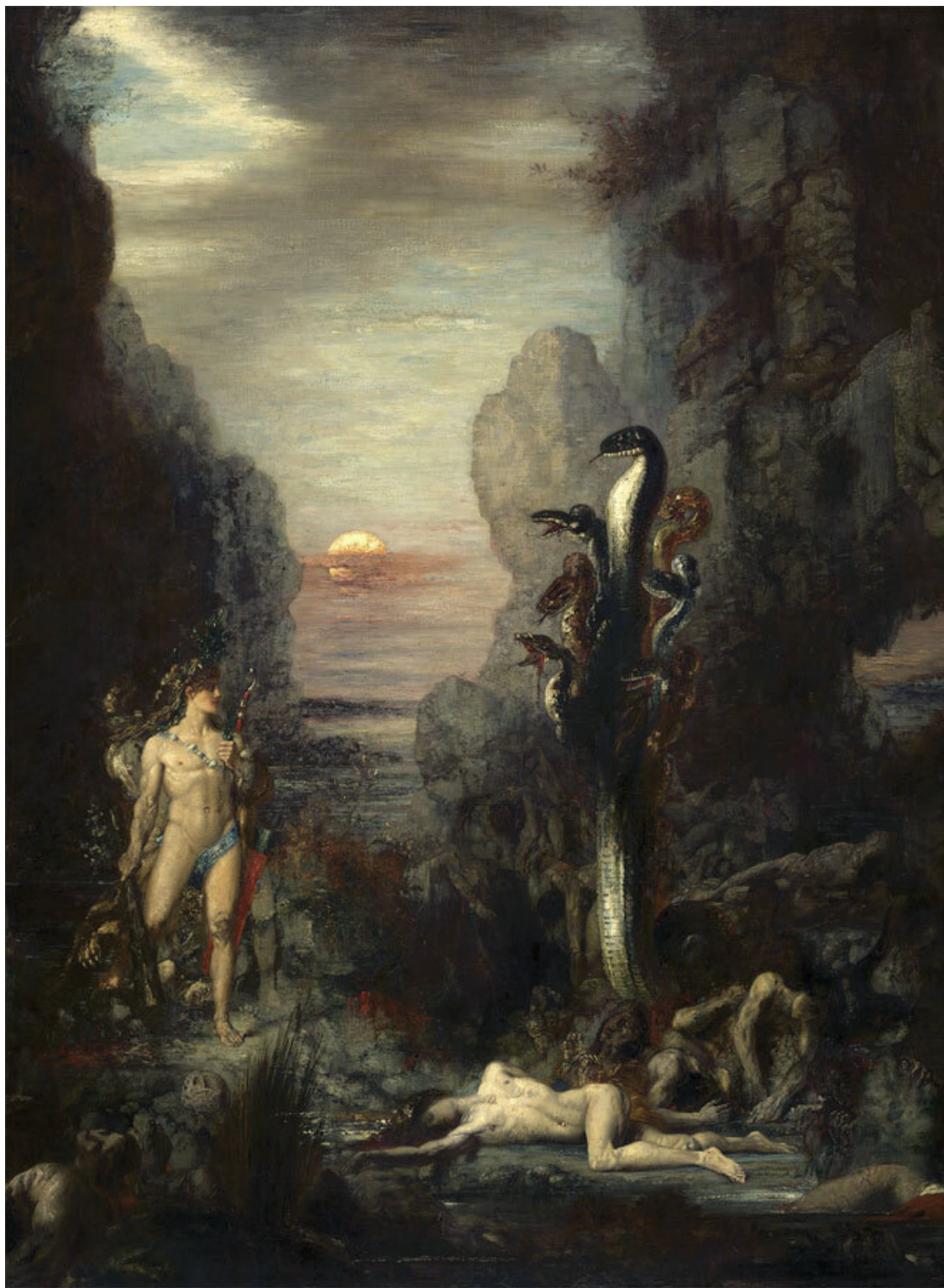
Геркулес и лернейская гидра на картине Гюстава Моро. Art Institute of Chicago