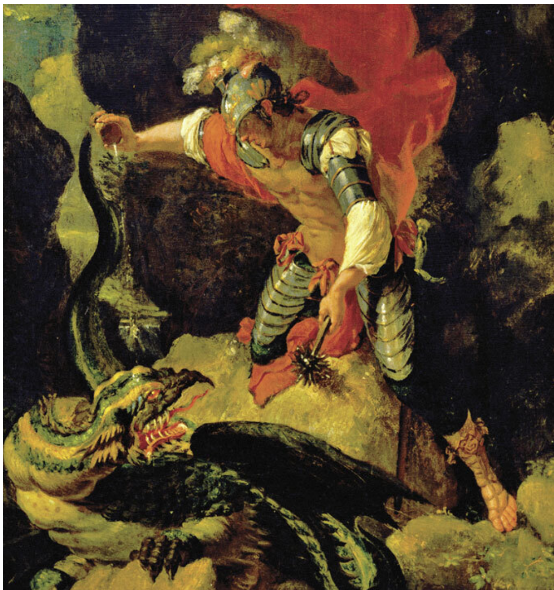
Ясон усыпляет дракона, чтобы добыть золотое руно. Сальватор Роза, XVII в.