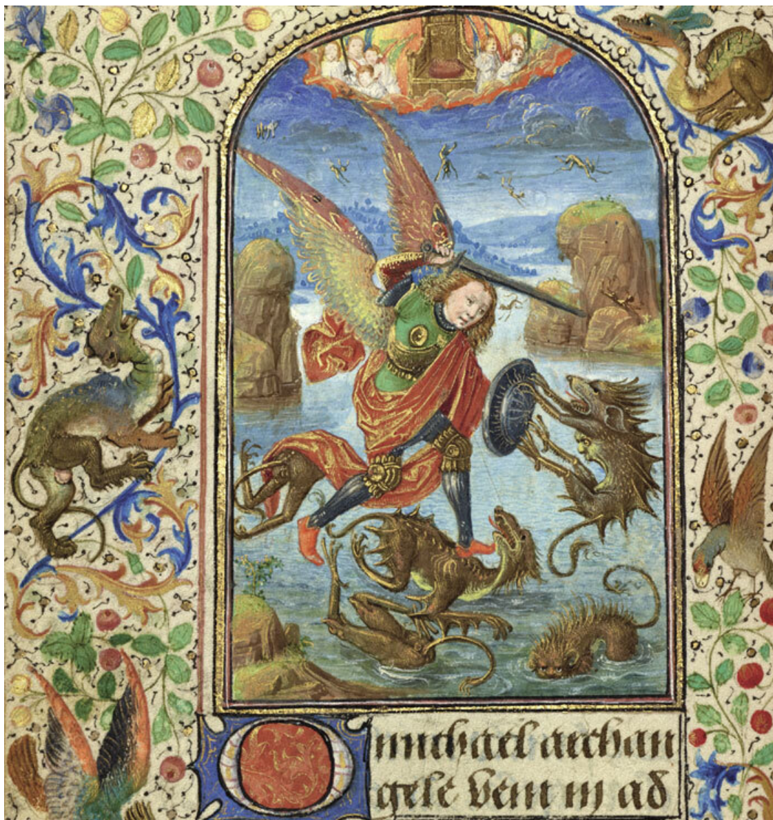
Архангел Михаил побивает Сатану в образе дракона. Ливен ван Латем, XV в.