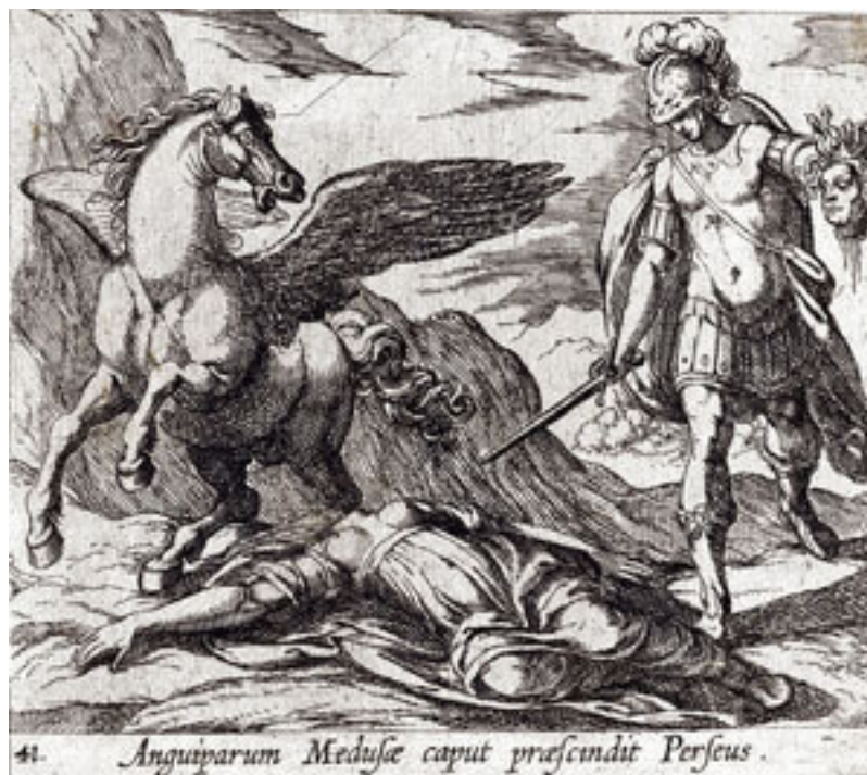
Персей убивает Медузу. Metropolitan Museum of Art (Нью-Йорк)

Но вот запекаясь кровь поднимает из пыли голову гадюки, раздувающуюся от смертельного сна, которым она грозит. Сюда попало больше ядовитой крови, поэтому гадюка и стала самой ядовитой змеей. Привыкшая к теплу, она селится в песках до самого Нила, не заползая в холодные земли. Но жадность человеческая не ведает стыда, и в поисках ливийской смерти мы превратили гадюку в выгодный товар.