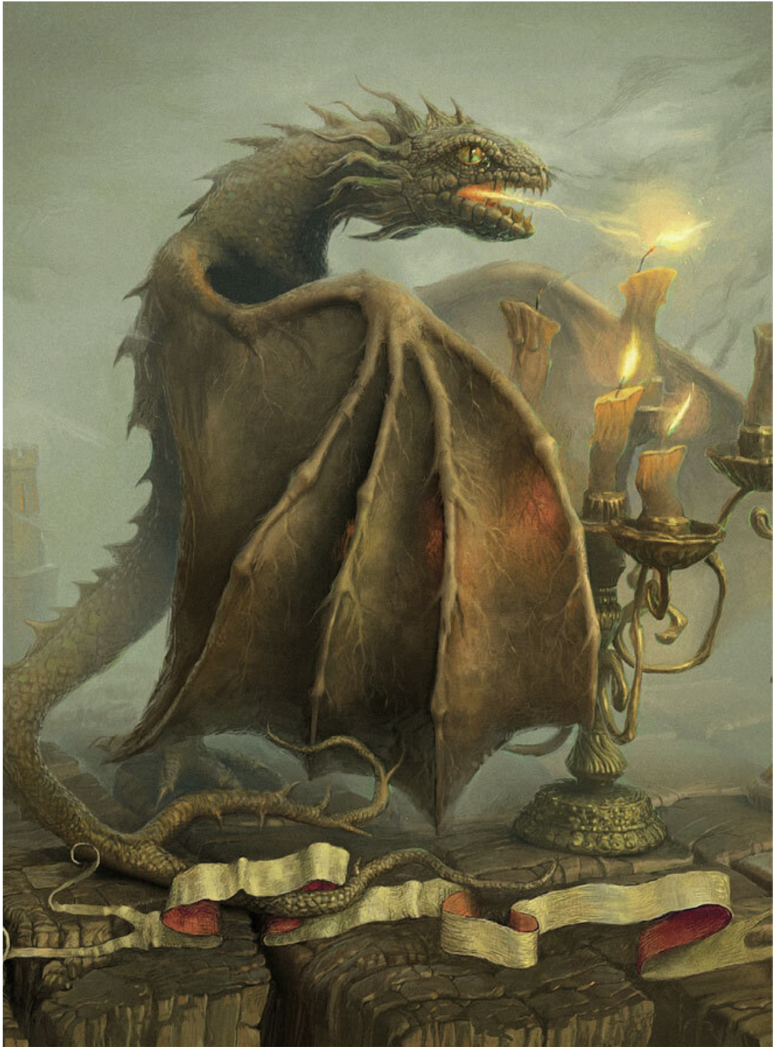
Иллюстрация Андрея Фереца