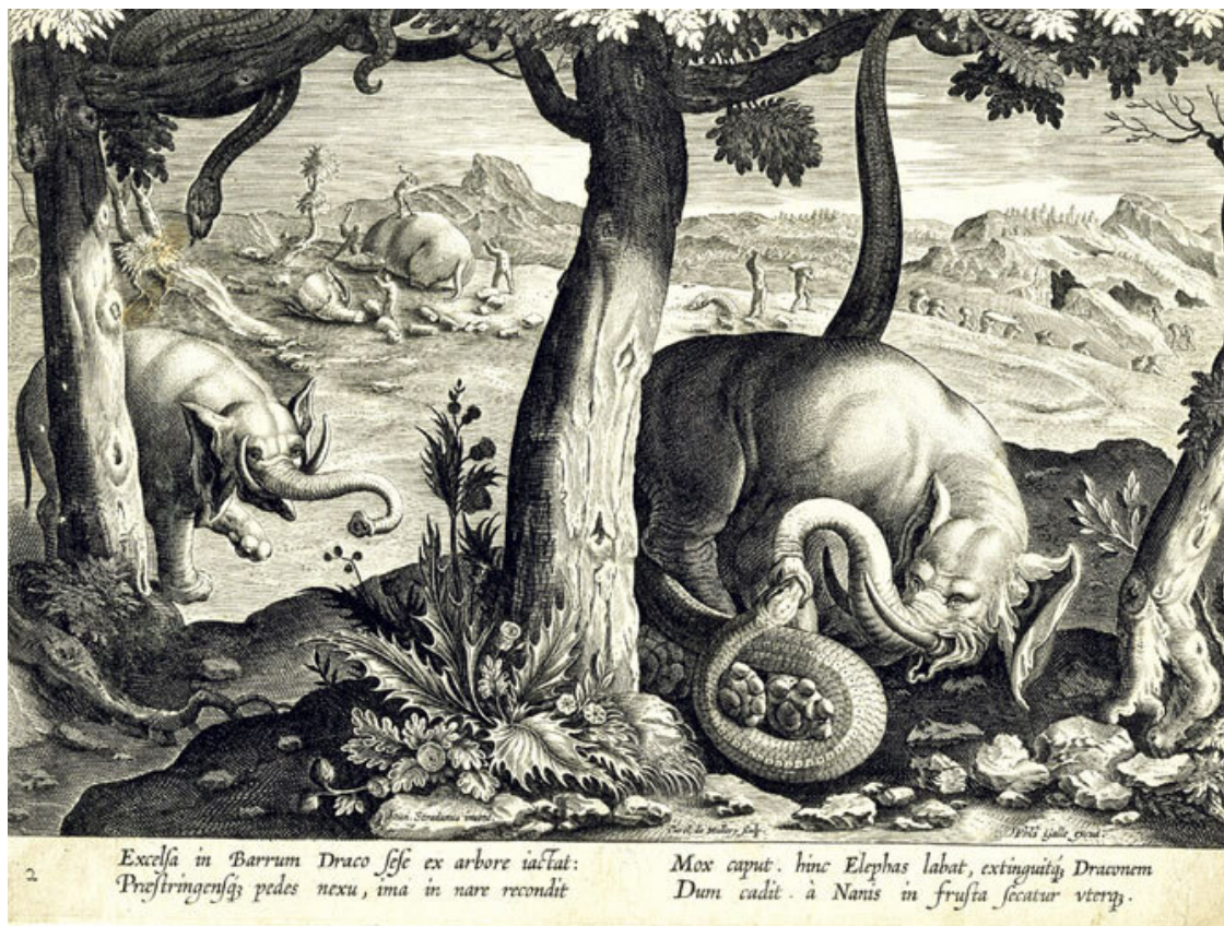
Чудовищные змеи и слоны на гравюре Яна ван дер Страта.

Дракон всегда готов к такому трюку: своим хвостом он обвивает ноги слона, тогда как слон пытается освободиться с помощью хобота. Однако дракон бьет головой в слоновьи ноздри, тем самым ранит нежный хобот и перекрывает своему противнику дыхание. При непредвиденной встрече дракон взвивается вверх лицом к лицу с врагом и метит головой в глаза слону. Вот почему так часто попадаются слепые, истощенные слоны, гибнущие от голода и страданий.