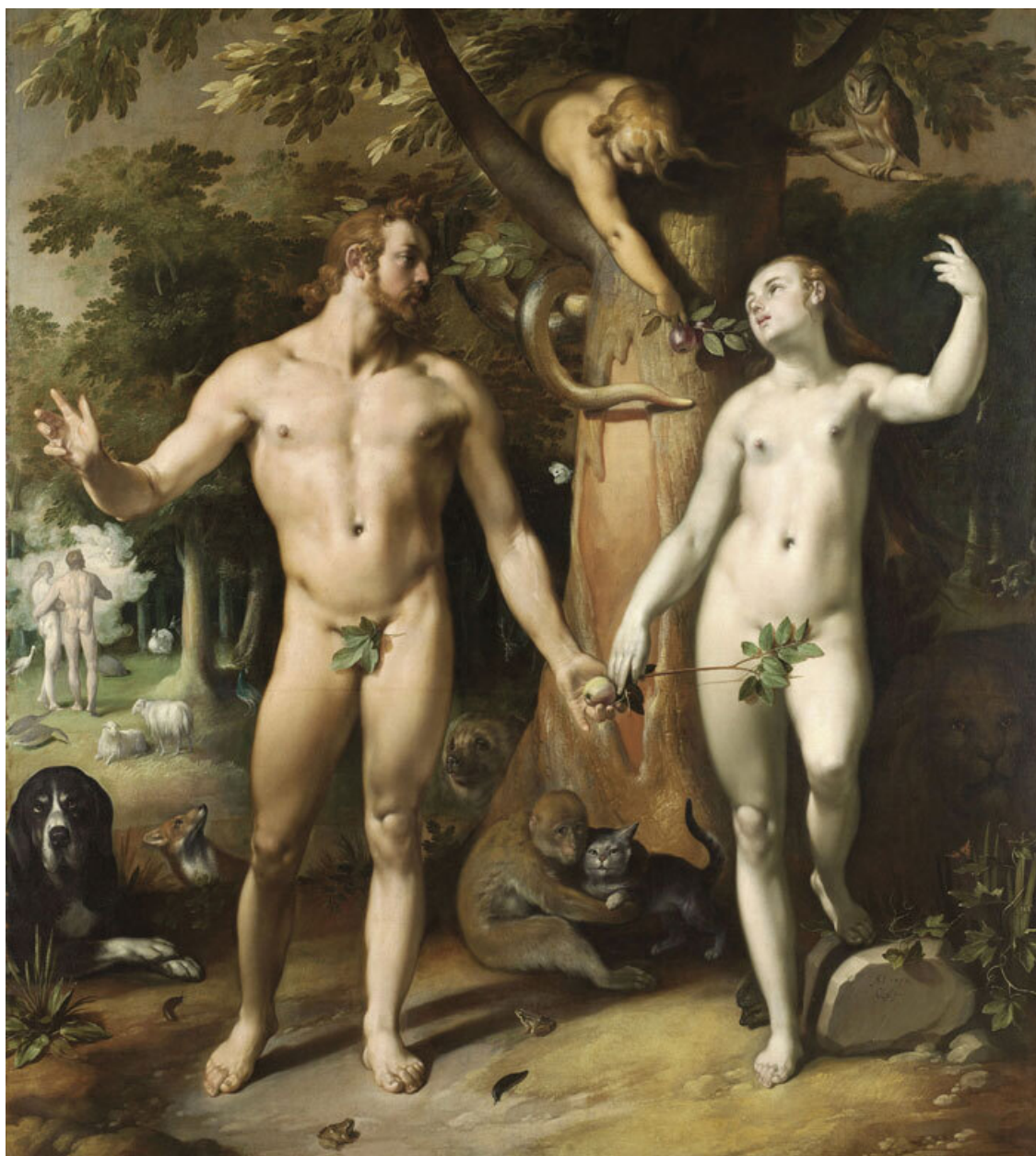
Змей-искуситель на картине Корнелиса Корнелиссена (1592). Rijksmuseum (Амстердам)