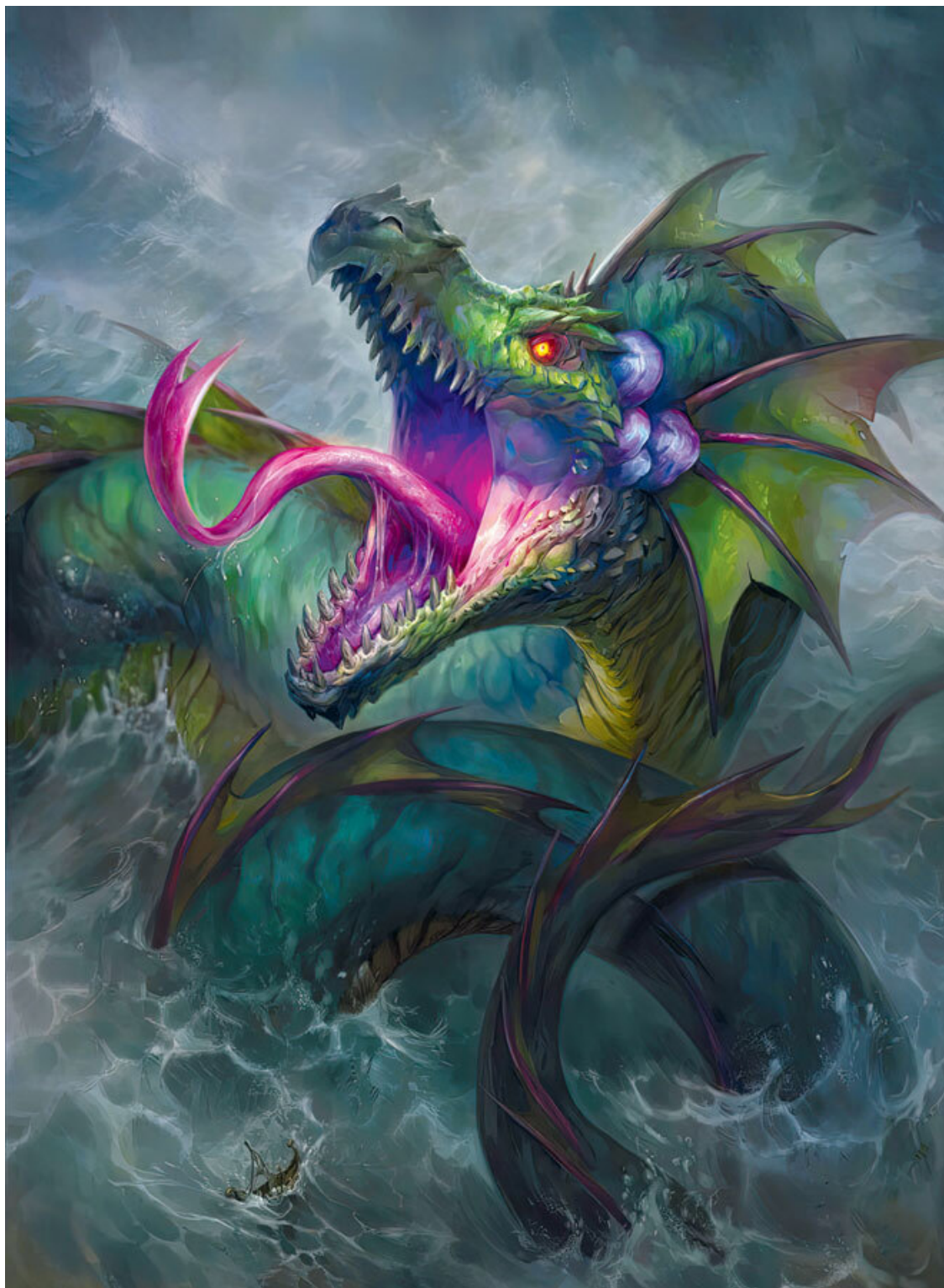
Морской змей на иллюстрации Оксаны Керро