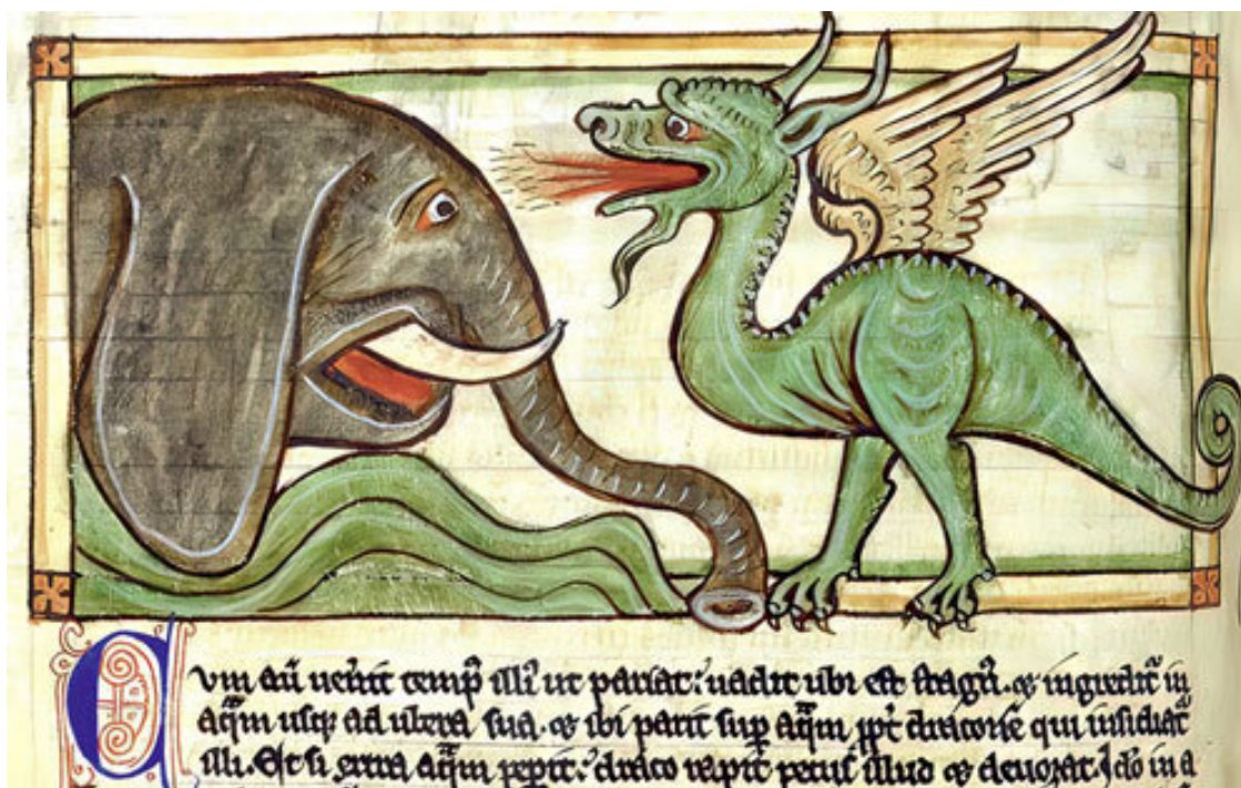
Противостояние слона и дракона в средневековом манускрипте.

С потрясающим упорством и трудолюбием римский государственный деятель Плиний Старший (23–79 гг. н. э.) составил необъятную энциклопедию чудес природы 13 . Плиний был наделен острой наблюдательностью и с неумным любопытством изучал данные современной ему науки о животном и растительном мире, о царстве минералов и о естествознании в целом. Работая над главой о слонах, Плиний не мог не упомянуть о драконах, ибо эти гиганты животного мира были непримиримыми врагами. Римский ученый определил Индию как среду обитания драконов и описал смертельные схватки ползучих тварей с их громадными противниками, обитателями далеких джунглей. Плиний погиб при извержении Везувия в 79 г., но его энциклопедией зачитывались на протяжении веков и после его смерти, а мыслители средневековой Европы искали скрытый смысл в битвах между драконами и слонами и толковали его как аллегорию искушения дьяволом Адама и Евы.