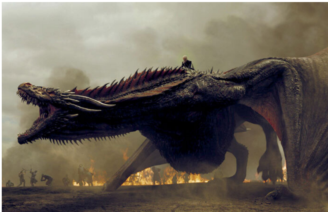
Один из самых знаменитых драконов современности. Кадр из сериала «Игра престолов». GAME OF THRONES (2011), directed by DANIEL MINAHAN.

Вдали от средневековой Европы, в Аравии, Южной Азии, Китае и Японии, литература создавала совершенно иной образ дракона. Да, в восточных сказках эти создания часто изображаются как страшные враги (это помогает подчеркнуть доблесть благородных героев), но в азиатском мировосприятии драконы могли быть и уязвимыми жертвами, которые искали союзников среди людей, чтобы сразиться с еще более устрашающим противником. В этих сказаниях драконы могли жить рядом с людьми, превращаться в прекрасных женщин и мужчин и пользоваться всеми благами жизни аристократов. Их привязанность к людям даже приводила к романтическим отношениям.