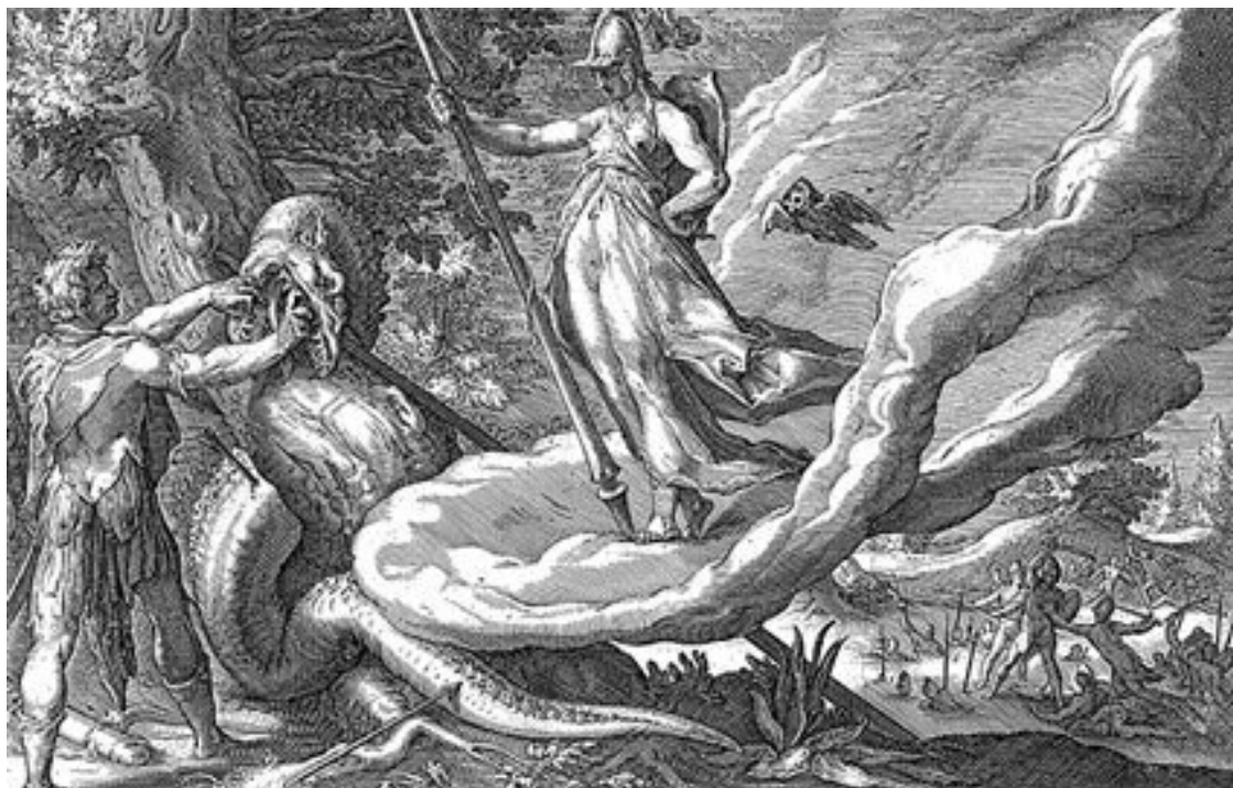
Паллада повелевает Кадму посеять драконьи зубы. Albertina Museum (Вена)

Вот он свернулся гигантской спиралью, а вот вздыбился вверх выше деревьев и опять, подобно раздувшейся в половодье реке, яростно полз, грудью раздвигая деревья и пролагая путь через чащу. Кадм слегка отступил, парировал натиск с помощью львиного щита и отразил копьем устрашающие челюсти. В ярости змей грыз наконечник копья, но зубы его не могли прокусить железо. И вот ядовитая кровь хлынула у змея из горла, орошая зеленую траву. Но рана не была смертельной, и змей отступил назад, втягивая раненую шею; это спасло его от более глубокой раны и от более точного удара. Тем временем сын Агенора теснил его, все глубже пронзая горло чудовища, пока змей не уперся спиной в дуб, а шея его не оказалась припилена к стволу. Дуб согнулся и застонал под ударами бьющегося хвоста.