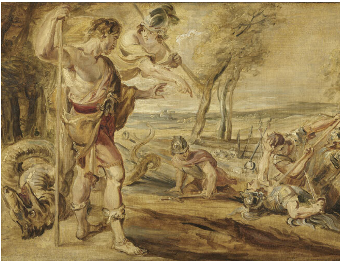
Кадм и поверженный дракон. Мастерская Питера Пауля Рубенса. Rijksmuseum (Амстердам)

Рядом находился густой лес, не знавший топора дровосека, а в глухой чаще была пещера, заросшая ивняком и другими деревьями, с естественной каменной аркой, наполненная пенящимися родниками. В этой пещере прятался змей Ареса: у него был великолепный гребень из золота, глаза его метали огонь, а тело раздувалось от яда, во рту росли острые зубы в три ряда и за ними пряталось тройное жало. На свое несчастье, финикийские путешественники ступили в рошу и опустили сосуды в воду. Услышав их, темный сверкающий змей высунул голову из глубин пещеры и страшно зашипел. Кувшины выпали у людей из рук, кровь отхлынула от сердца, и они содрогнулись от ужаса. А змей свил свое чешуйчатое тело кольцами и пружиной взмыл в призрачный воздух, озирая весь лес. Он был огромным, как созвездие Змея между двух небесных Медведиц, если распрямить все кольца его тела. Без промедления чудовище кинулось на финикийцев. Часть из них готовилась к бою, другие решили спастись бегством, а некоторые от ужаса не могли двинуться с места. Змей уничтожил их всех до единого, поражая клыками, ядовитым дыханием и удушающими кольцами.