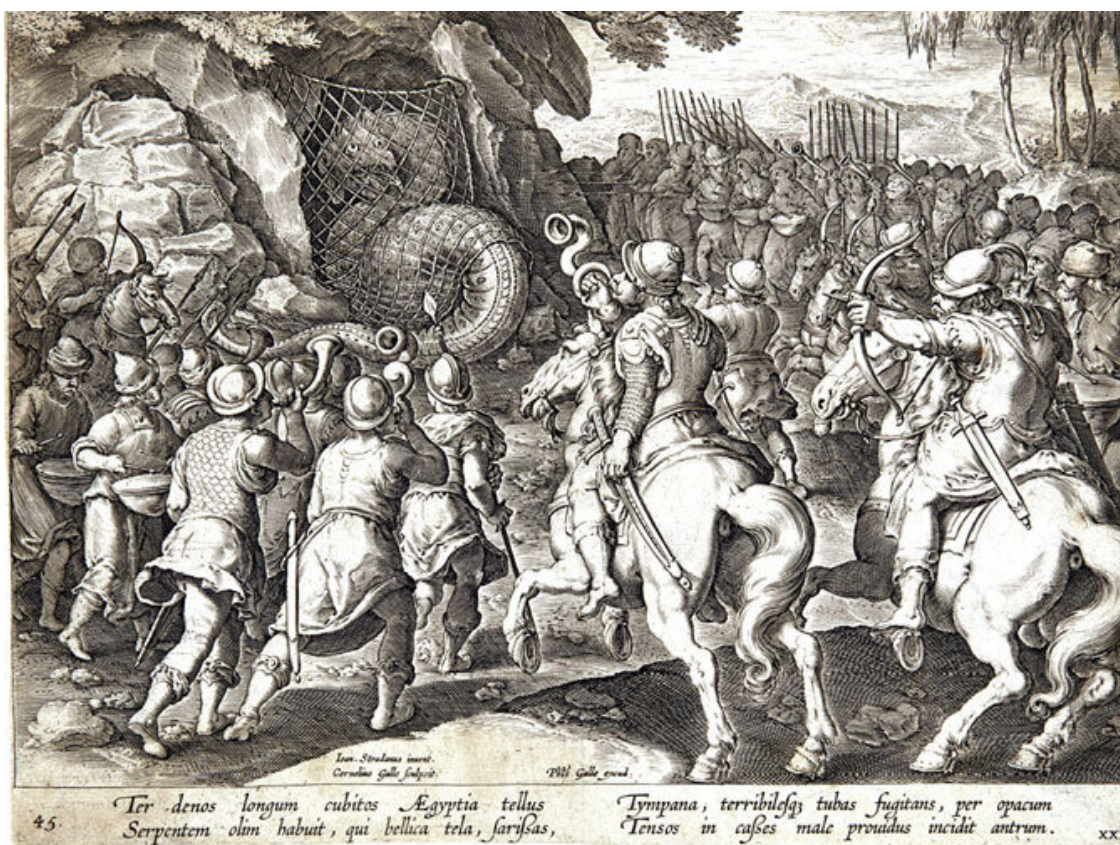
Пленный дракон на гравюре Яна ван дер Страта, 1595 г.

Драконий камень, или драконит, находят в мозгу дракона; но камень кристаллизуется и превращается в драгоценный только в момент смерти дракона, и голову ему нужно срубить, пока он жив. Именно поэтому ее отсекают у спящего дракона. Сотак 15 поведал, что видел подобный камень у одного царя, а чтобы добыть драконий камень, нужно запрячь в колесницу двух лошадей, при виде дракона высыпать на его пути порошок из дурмана, а уснувшему зверю голову заживо срубить. По описанию Сотака, камень этот белый и прозрачный и не поддается ни полировке, ни гравировке.