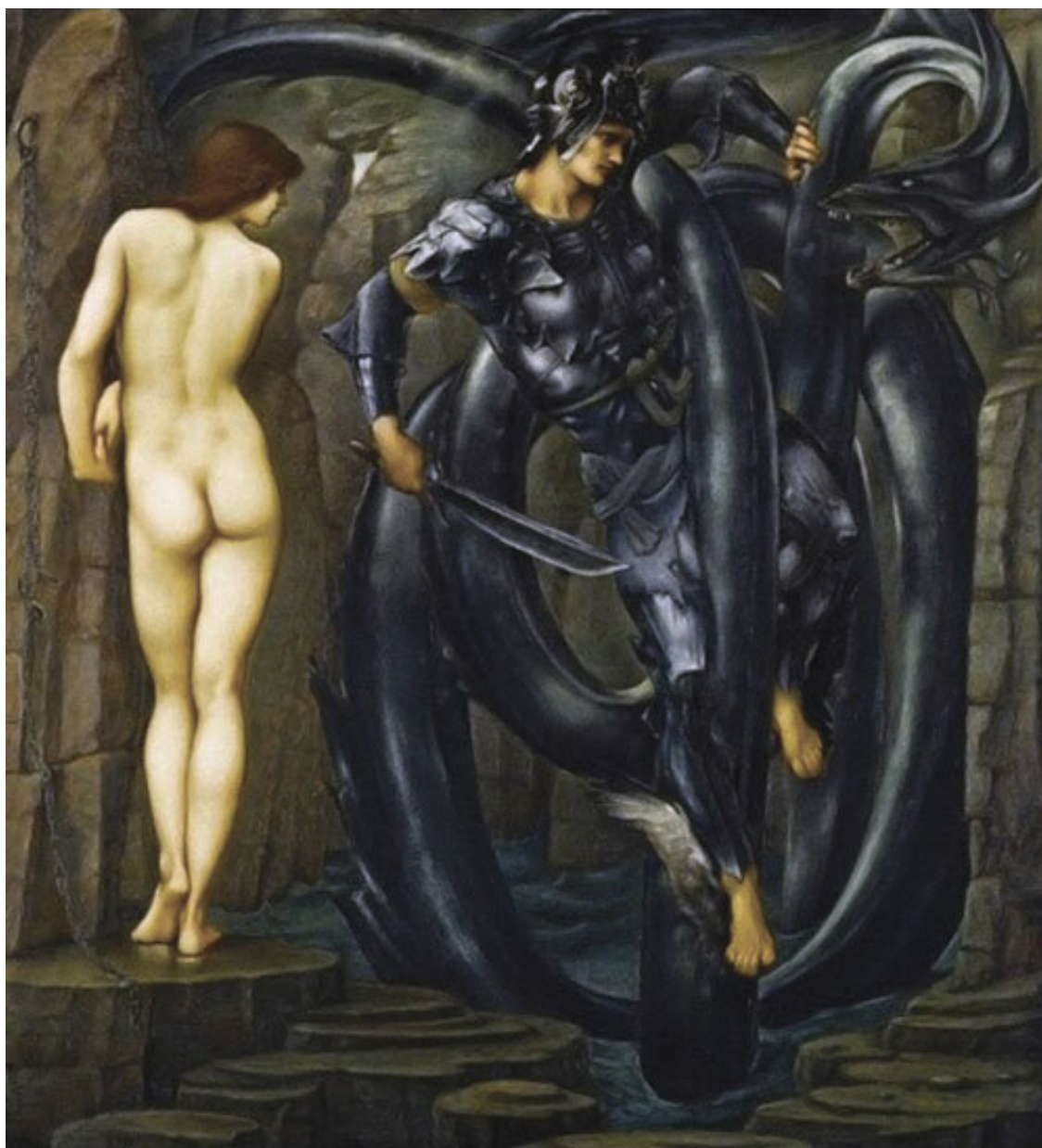
Персей и Андромеда на картине Эдварда Бёрн-Джонсона (1888)

Вот уже кони смогли окружить окровавленный луг, где погибли те двое. Змей, пробудившись от грома копыт на лужайке, вылез из грота и выдохнул вонью шипящей. Жуткое пламя сверкало в глазах у дракона; гребень его возносился над лесом дремучим, жало тройное дрожало и будто бы неба касалось, из пасти свисая. Трубы взревели, и змей отступил, своей тушей огромною вздрогнув; севши на хвост, изогнулся он в кольца переднюю частью. Тут же он резко вскочил, разогнув свои кольца и вытянув полностью тело, пастью касаясь передних рядов нападавших. Кони всхрапели от страха пред змеем, не подчиняясь узде, раздувая горячие ноздри. Чудище, высясь над войском смятённым, в ярости шею раздуло, качаясь то влево, то вправо, вверх поднимало солдат и, бросив о землю, крушило их весом огромным. Кости дробя, упивался он черною кровью, пастью кровавой хватая всё новые жертвы. Воины кинулись прочь, а дракон, торжествуя, их достает ядовитым дыханьем все дальше. Тут уж и Регул крикнул солдатам сражаться: «Нам ли пристало, Италии детям, так отступать перед змеем поганым, Рим ли уступит ливийскому змею? Если дыхание змея лишило вас силы, если вы храбрость растратили, видя кровавую морду, значит, я буду отважно сражаться один на один с этим змеем».