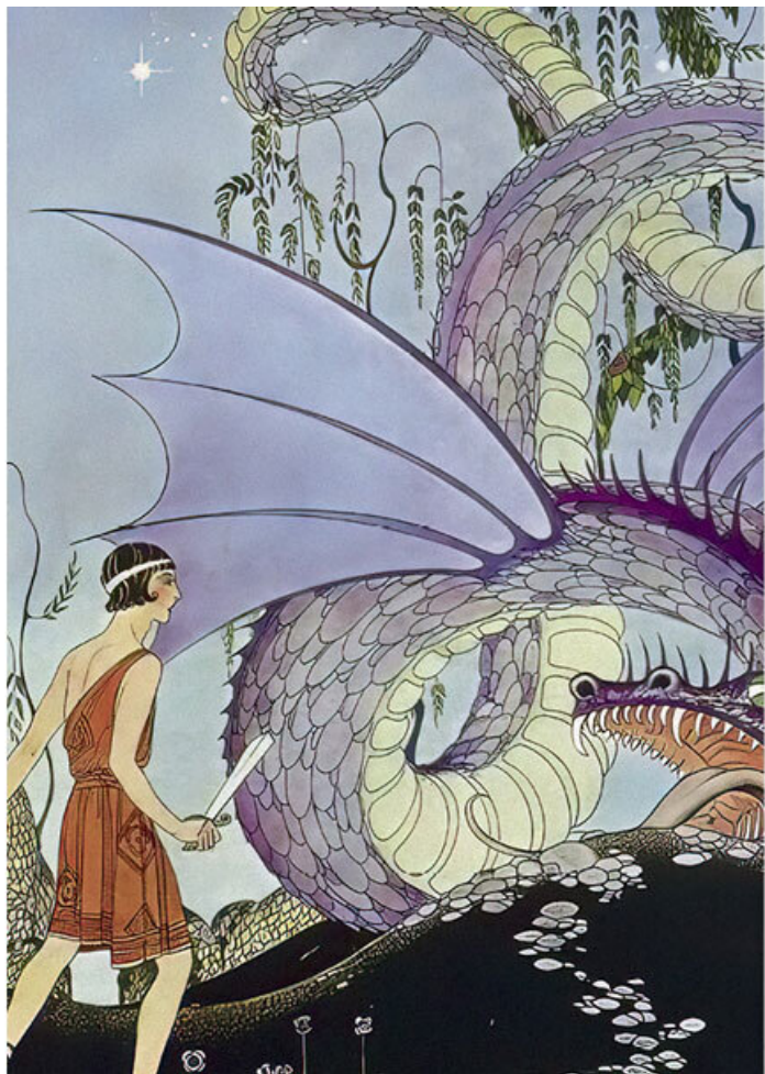
Кадм и дракон. Вирджиния Фрэнсис Стеррет.