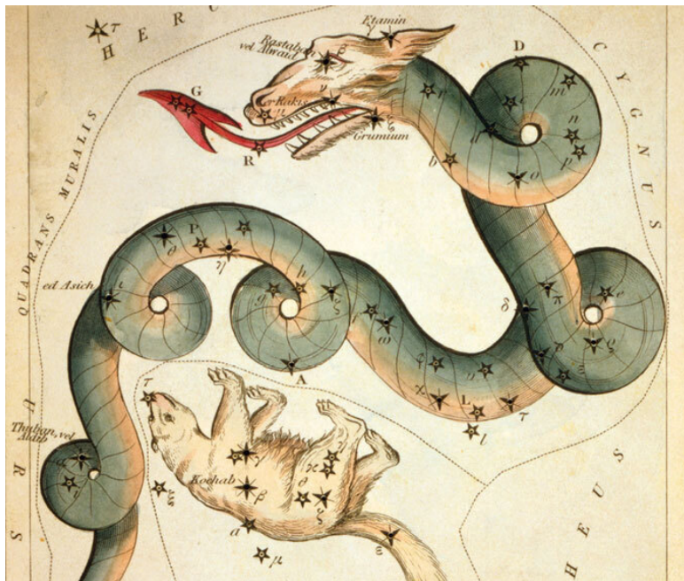
Созвездия Дракон и Малая Медведица на астрономической карте, 1825 г.