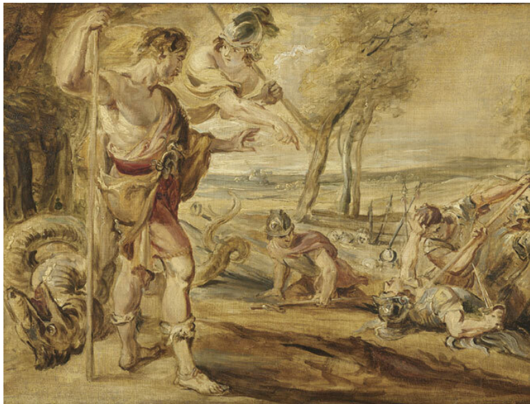
Кадм и поверженный дракон. Мастерская Питера Пауля Рубенса. Rijksmuseum (Амстердам)