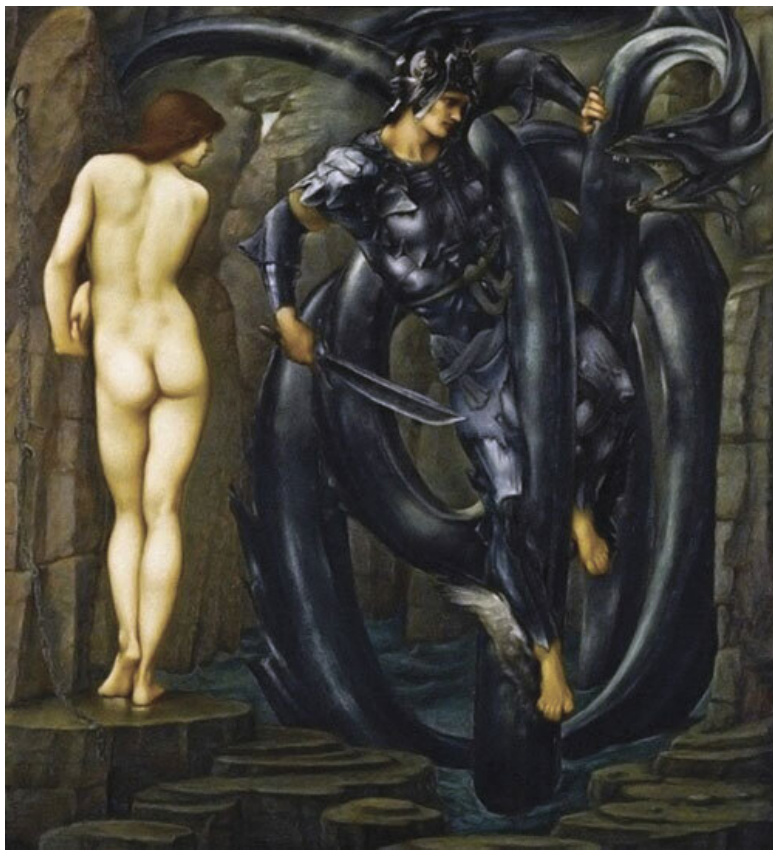
Персей и Андромеда на картине Эдварда Бёрн-Джонсона (1888)