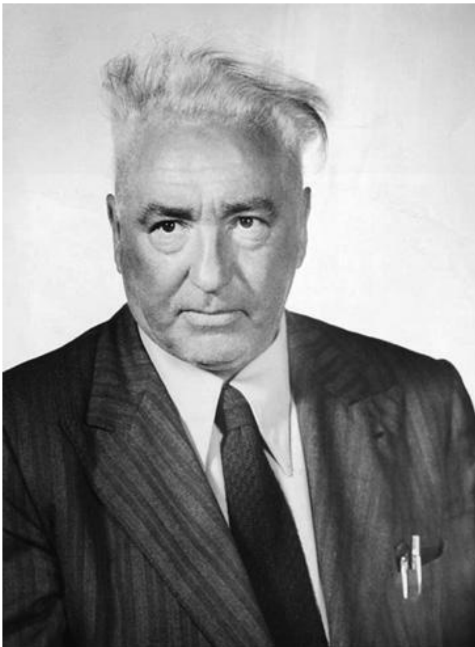
Вильгельм Райх (1897–1957). Последователь Фрейда, психоаналитик, автор оргонной теории. Фотография 1952 года