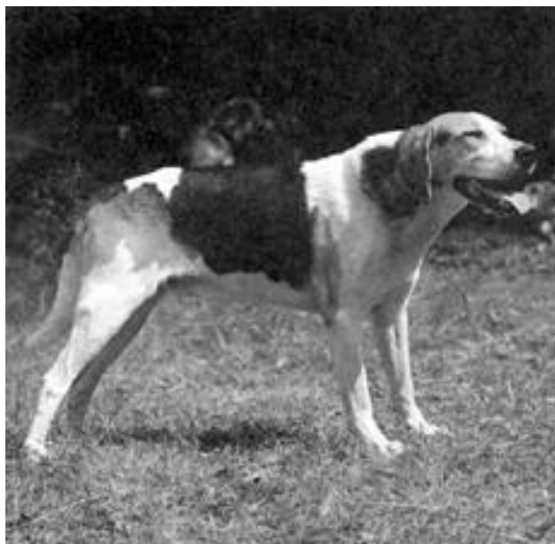
Русская пегая гончая

Кроме перечисленных, в России разводили такие породы, как польско-русские гончие, арлекины и брудастые гончие.