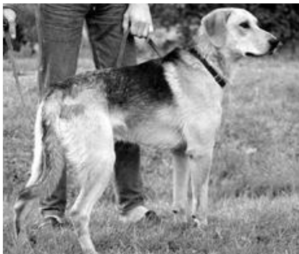
Гончая восточного типа

Описаний этих собак в древнерусской литературе очень мало. Только в «Записках о Московии» Зигмунда фон Герберштейна, где он описывает охоту на зайцев великого князя московского Василия III (1505-1533), упоминаются собаки, похожие на русских гончих. Годы правления князя отмечены расцветом псовой охоты, да и сам он был известным охотником и часто выезжал «на зверя».