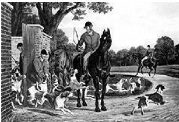
Инглис Шелдон Уильямс. «Утренняя охота». XIX в.

Над разведением гончей породы работали также в Словакии (словацкий копов), в Польше (польский огар), в Югославии (истрийский бракк), в Швейцарии (швейцарская, бернская, люцернская и юрская гончие), в Австрии (австрийский, таксообразный, штирский жесткошерстный, тирольский бракки) и др.