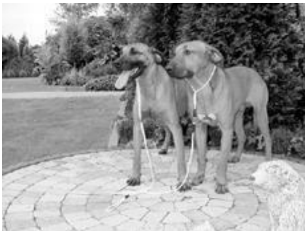
Для прогулок нужны поводок и ошейник

Ошейник начинают использовать после того, как у щенка окрепнут кости. До этого существует опасность повредить питомцу шею, поэтому лучше надевать на него для прогулки шлейку. Ошейники бывают 2 видов: обычный, изготовленный из кожи, кожзаменителя или специальной тесьмы, и строгий, с металлическими шипами.