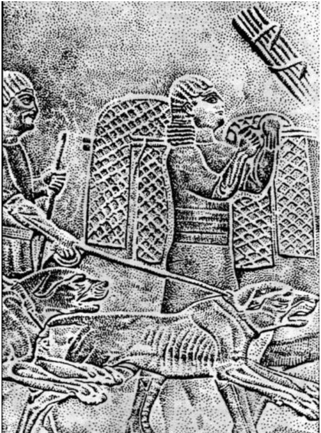
Фрагмент рельефа «Царь на колеснице поражает львов стрелами». Дворец Ашишурбанипала в Ниневии (669-635 до н.э.)

С течением времени менялся характер охоты и, соответственно, роль собак на ней. Если раньше они не только обнаруживали зверя, но и могли самостоятельно завалить его, то со временем от собак требовалось только нахождение и гон зверя на конного охотника. Парфорсная охота, зародившаяся в конце Античности, получила свое дальнейшее развитие в эпоху Средневековья. Наибольшую популярность она приобрела во Франции, Англии, Германии, Испании и некоторых других западноевропейских государствах.