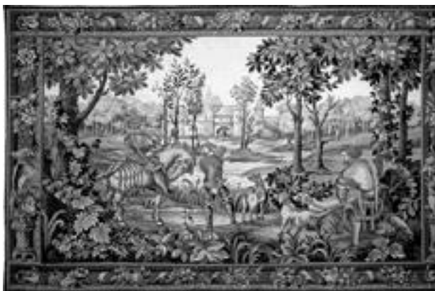
Возвращение с охоты. Гобелен X в.

В это время охота приобрела необычайную популярность и превратилась в сложную науку со своими правилами. Большое внимание уделялось физической подготовке собак, которых тренировали ежедневно, развивая у них силу и выносливость.