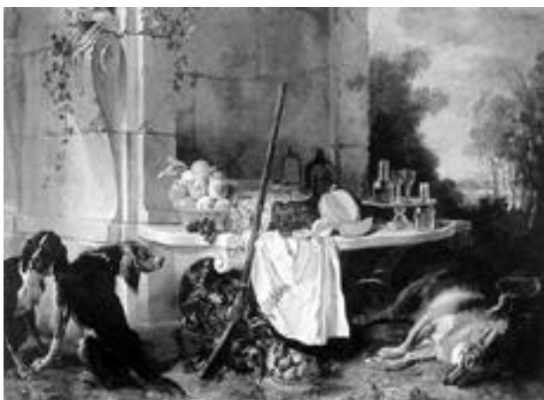
Ж.-Б. Удри. «Убитый волк». XVIII в.

Благодаря работе собаководов-любителей появилось множество новых охотничьих пород, в том числе и гончих. Так, например, во Франции были выведены породы гончих, называемые бракками, отличающиеся прекрасным чутьем.