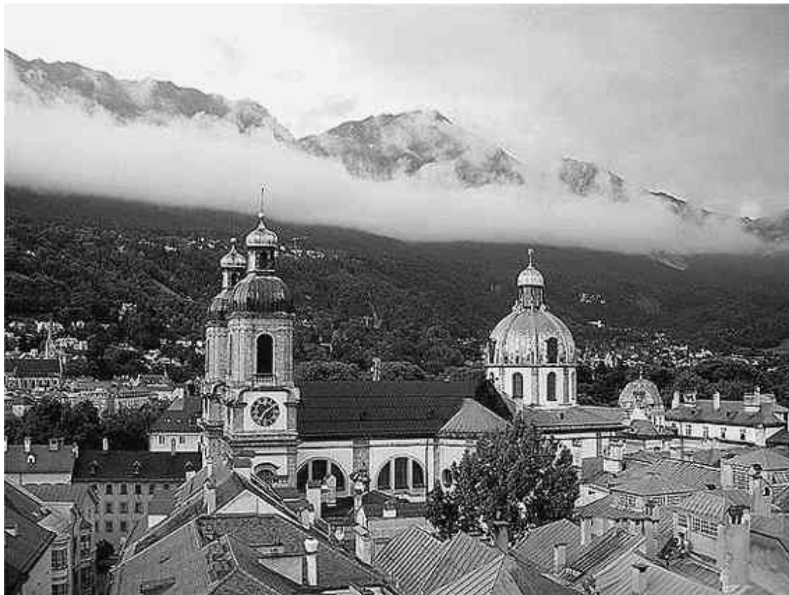
Легкие облака у горных вершин – предвестники фёна

ваются росой и горы, оказавшись на синевато-фиолетовом фоне, кажутся ближе. Затем начинает дуть порывистый, неожиданно холодный ветер, и после нескольких минут тишины налетает фён, низвергаясь потоками теплого воздуха, которые быстро превращаются в ураган.