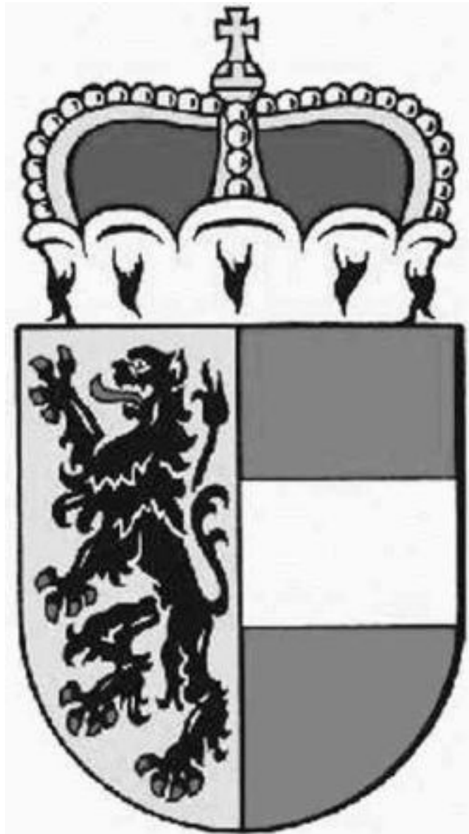
Герб бывшего архиепископства Зальцбург

в духовные дела. В ответ на притеснения тирольцы подняли восстание, благо нашелся человек, способный увлечь законопослушных соотечественников на борьбу с властями. Таковым оказался Андреас Хофер, который, выдвинув лозунг верности Габсбургам, одно время был фактическим правителем Тироля. Одержав несколько блистательных побед, восставшие расположились в Инсбруке и вынудили франко-баварскую армию к капитуляции. Через год новая французская армия вытеснила австрийцев, против чего выступило уже все население края. Тем не менее мятеж был подавлен, Хофера казнили, и тирольцам пришлось ждать 5 лет, пока Австрийская империя вновь не восстановила власть на их земле.