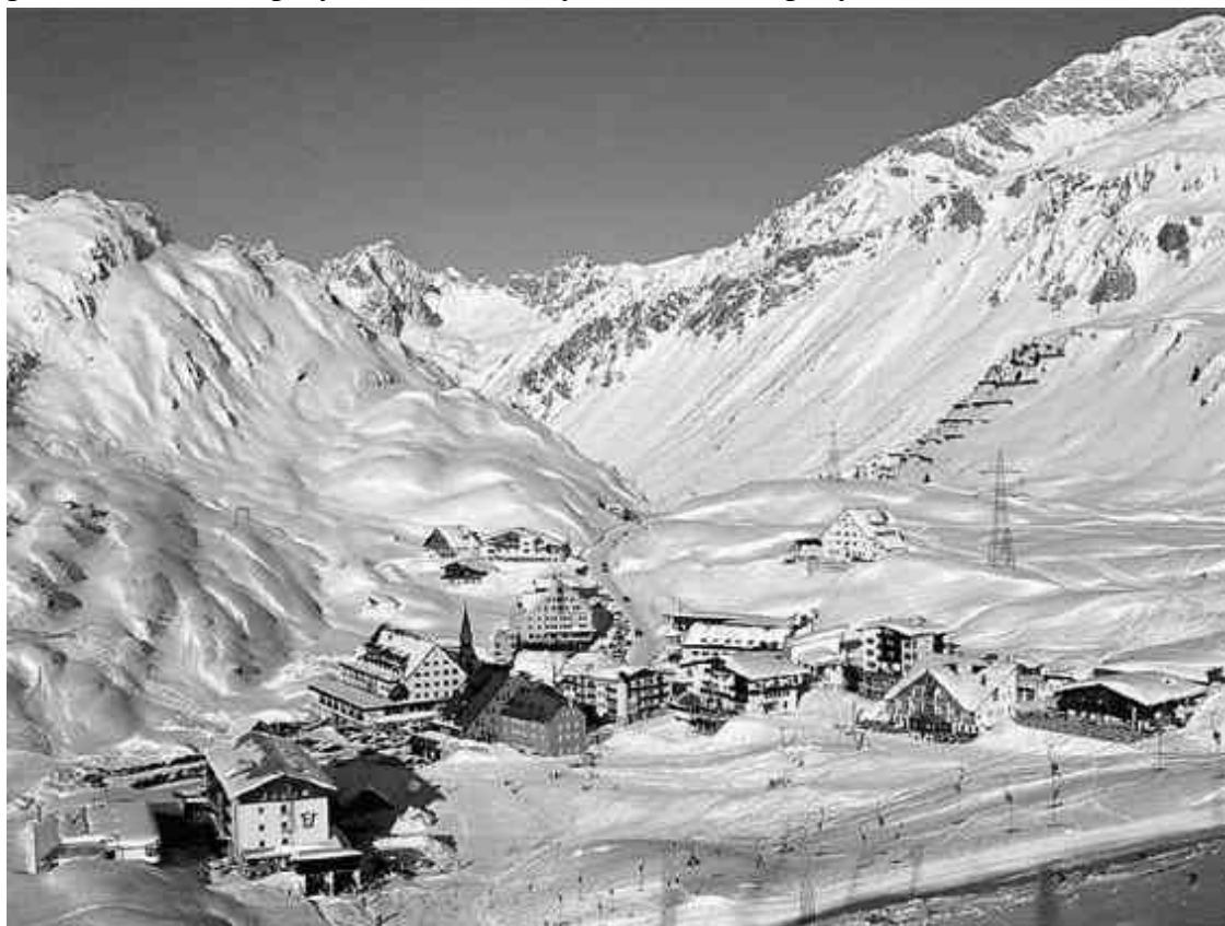
Горный массив Арльберг

В давке пассажиру больше, чем деньги и общественное положение, помогала ловкость, а также предусмотрительность: солидных пассажиров, особенно с багажом, просили прибывать на станцию заранее, чтобы успеть пробиться к вагону и занять указанное в билете место. Тогда, как и сейчас, европейские поезда ходили точно по расписанию, делая очень непродолжительные остановки. В отсутствие вагонов-ресторанов путникам приходилось запасаться провизией и не рассчитывать на прогулки в течение пути, чтобы не пропустить отхода поезда.