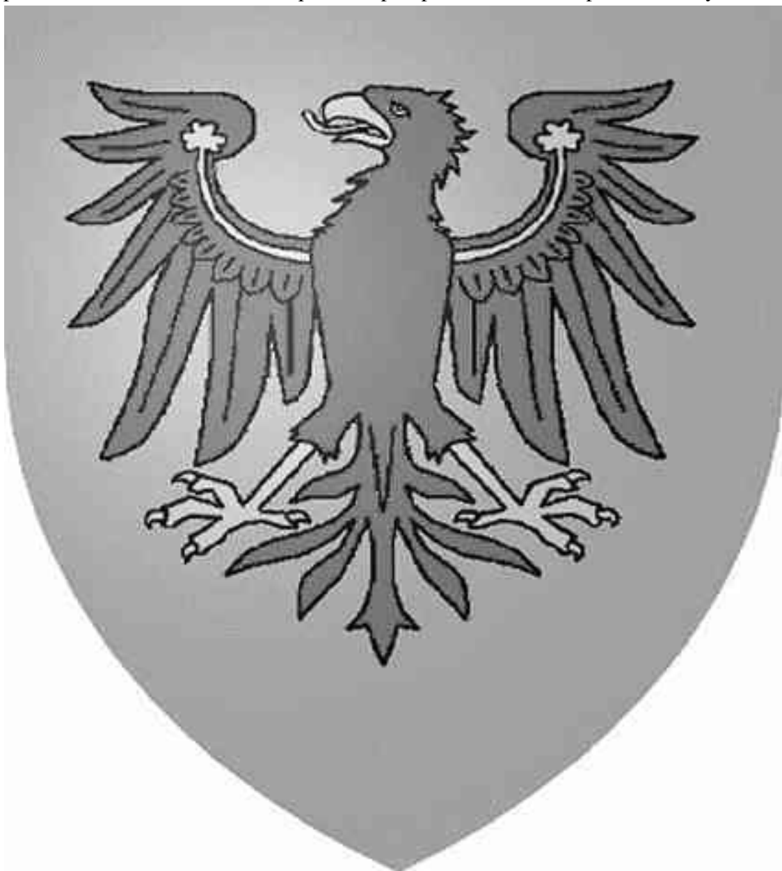
Герб графства Тироль

а войско кайзера уже не могло бы собраться в поход без металла с альпийских рудников. Однако, несмотря на всю мощь, в отдаленном графстве Габсбурги не могли проявить влияния во всю силу. Положения не изменил и просвещенный абсолютизм, когда так называемые урбаральные патенты Марии-Терезии, утвердившие повинности все имперских крестьян, сокращение барщины и право свободного перехода от одного хозяина к другому, почти не коснулись тирольцев. Также не подействовала таможенная реформа, зато перемены в образовании, как и обнародованный позже патент Иосифа II о веротерпимости, были приняты с энтузиазмом.