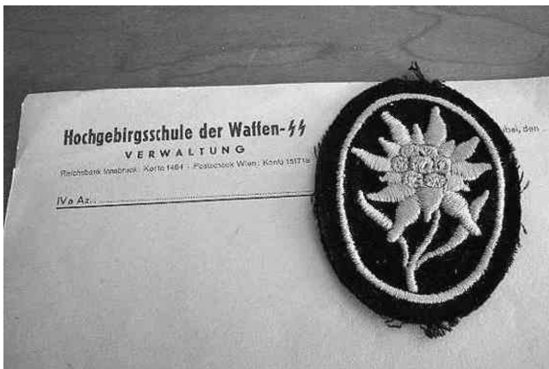
Нашивка с изображением эдельвейса – эмблема альпийских стрелков

В отличие от немцев служившие в вермахте тирольцы не стыдятся прошлого, более того, ревностно хранят боевые традиции. Опыт, полученный на фронтах Второй мировой, успешно применяется ими в современных боевых действиях: донныне существующая бригада альпийских стрелков является единственным формированием в НАТО, способным воевать в условиях высокогорья. В эту бригаду, прекрасно подготовленную и вооруженную самыми современными средствами ведения боя, помимо снайперов, входят альпинисты и разведчики-лыжники. Немалую ее часть составляют контрактники из Тироля, вышедшие из тех самых шютценов, каких и сегодня можно встретить в каждой тирольской деревне.