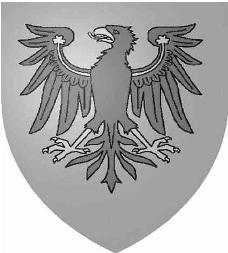
Герб графства Тироль

В самом конце XVIII века на землях Тироля проходили сражения между наступавшими войсками Наполеона и австрийской армией. Сумев захватить горный край, французы