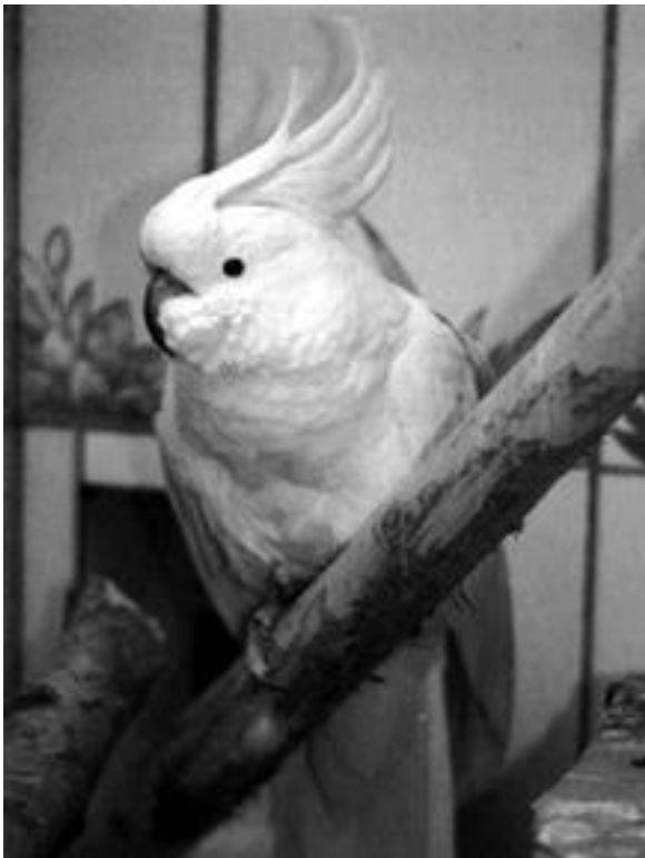
Большой желтохохлый какаду Мэтьюса.

Какаду принадлежит к одним из самых интересных комнатных птиц. Эти необыкновенно красивые пернатые завоевали популярность благодаря способности к воспроизведению человеческой речи, а также потрясающему таланту к исполнению различных цирковых трюков: приседаний, накло-