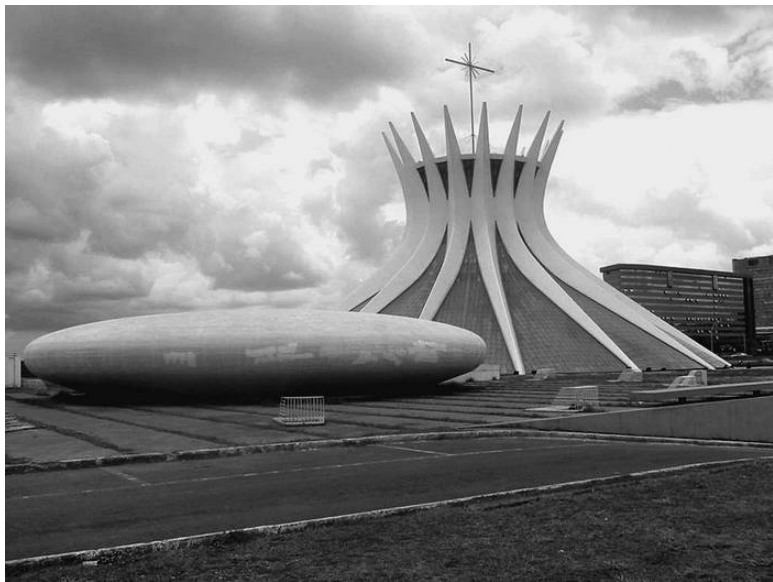
Кафедральный собор города Бразилиа

За Пиренеями находилась не только Африка. На протяжении нескольких десятков столетий на Иберийском полуострове формировалась своя неповторимая культура, выросшая из гармоничного соединения самых разных культур Европы, Африки, Азии, Америки. Таким образом, было бы справедливее утверждать о существовании за Пиренеями искусства, ставшего своеобразным синтезом искусства Запада и Востока.