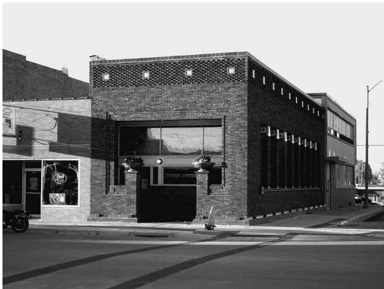
Дом Генри Адамса. Архитектор Луис Генри Салли- вен