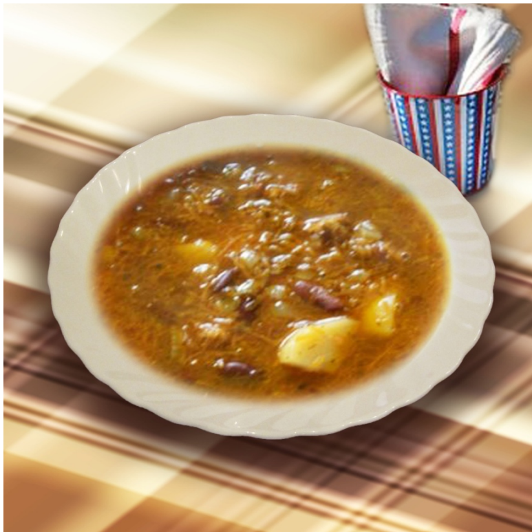
Суп с фасолью ( общевойсковой паёк )