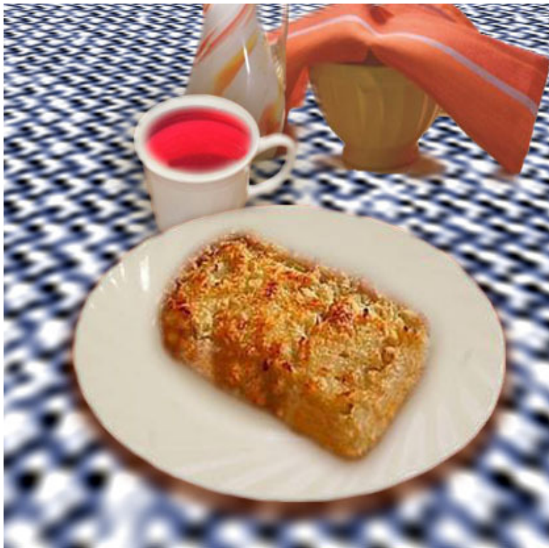
Картофельная запеканка ( общевойсковой паёк )