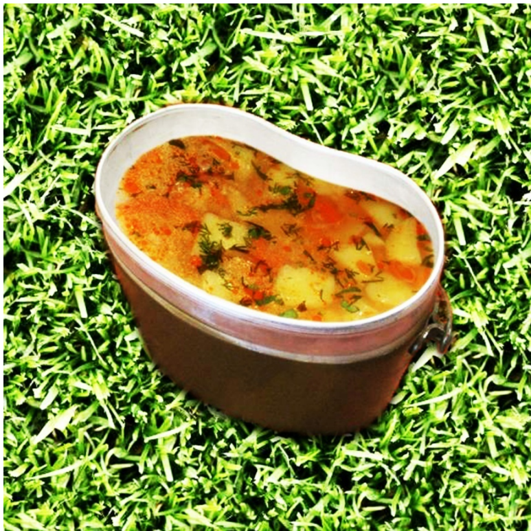
Рассольник «Ленинградский» (общевойсковой паёк)