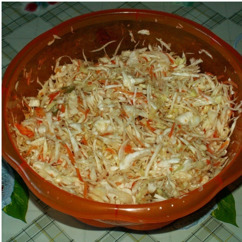
Салат «Освежающий» ( морской паёк )