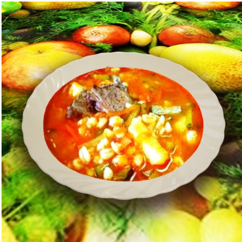
Рассольник (лечебный паёк)