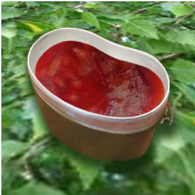
Борщ ( общевойсковой паёк )