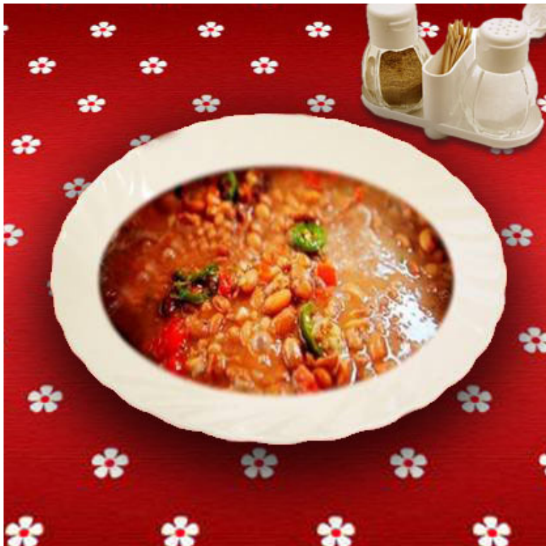
Суп из белой фасоли ( общевойсковой паёк )