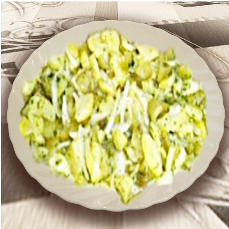
Салат картофельный с огурцами ( морской паёк )