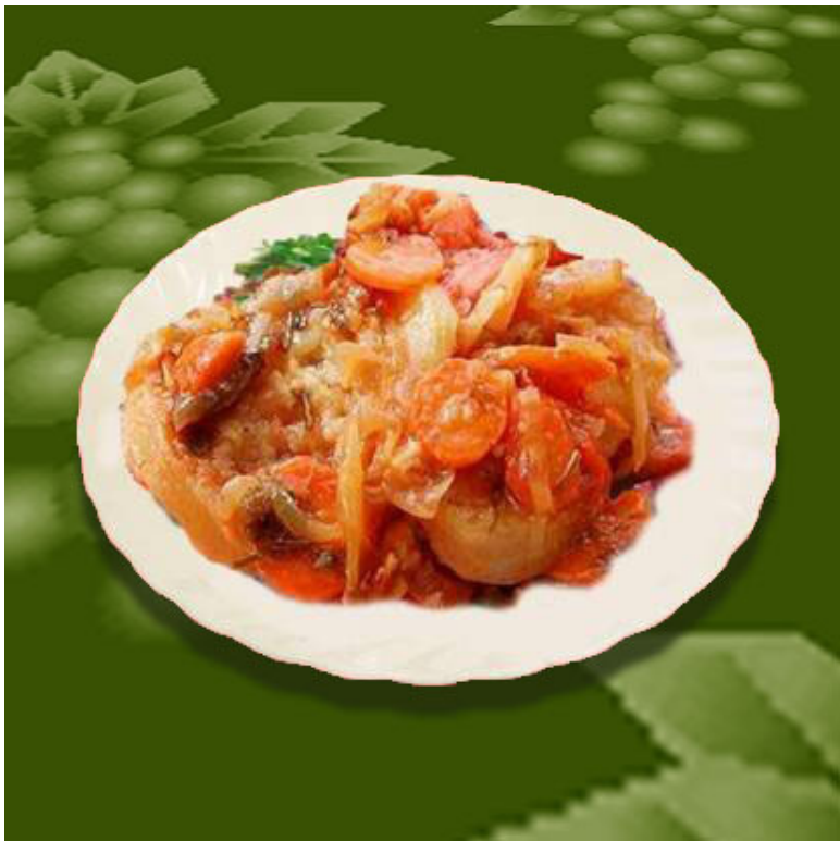
Овощное рагу ( общевойсковой паёк )