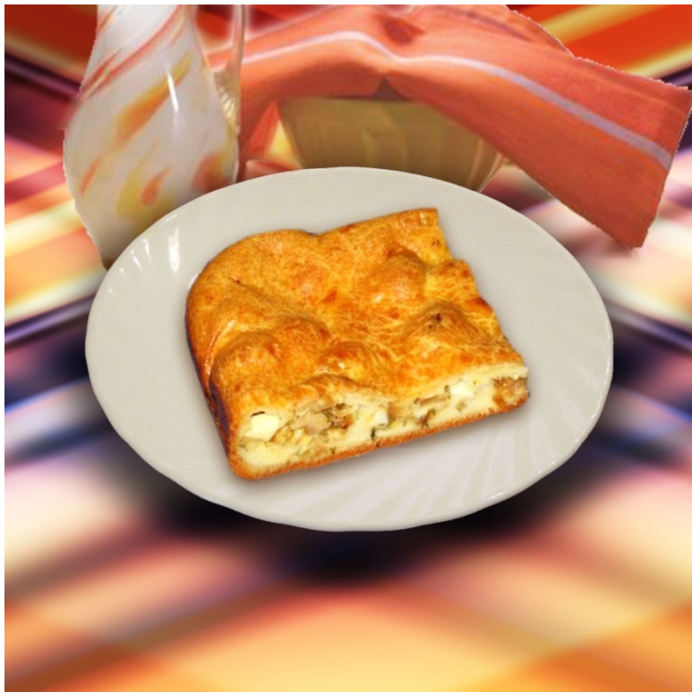
Пирог с капустой ( общевойсковой паёк )