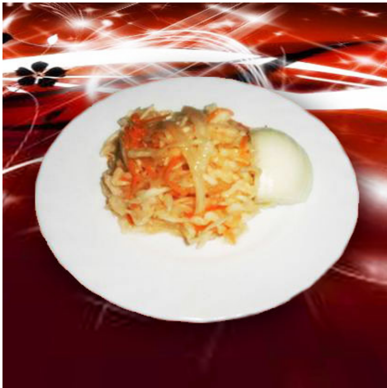
Салат витаминный ( общевойсковой паёк )