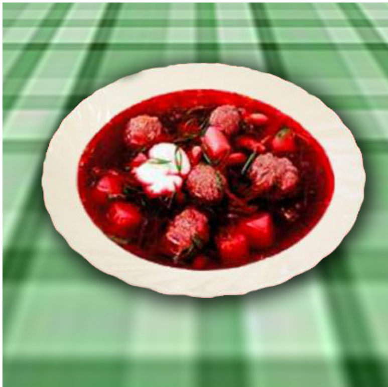
Борщ сибирский ( общевойсковой паёк )