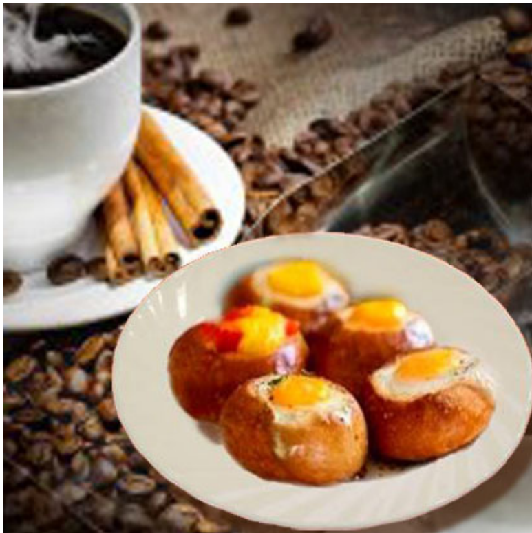
Булочки с яйцом(общевойсковой паёк)