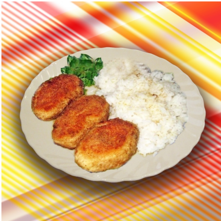
Куриные котлеты ( лётный паёк )