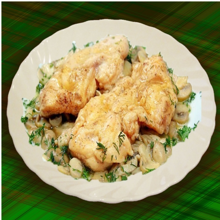
Эскалоп с грибами ( морской паёк )