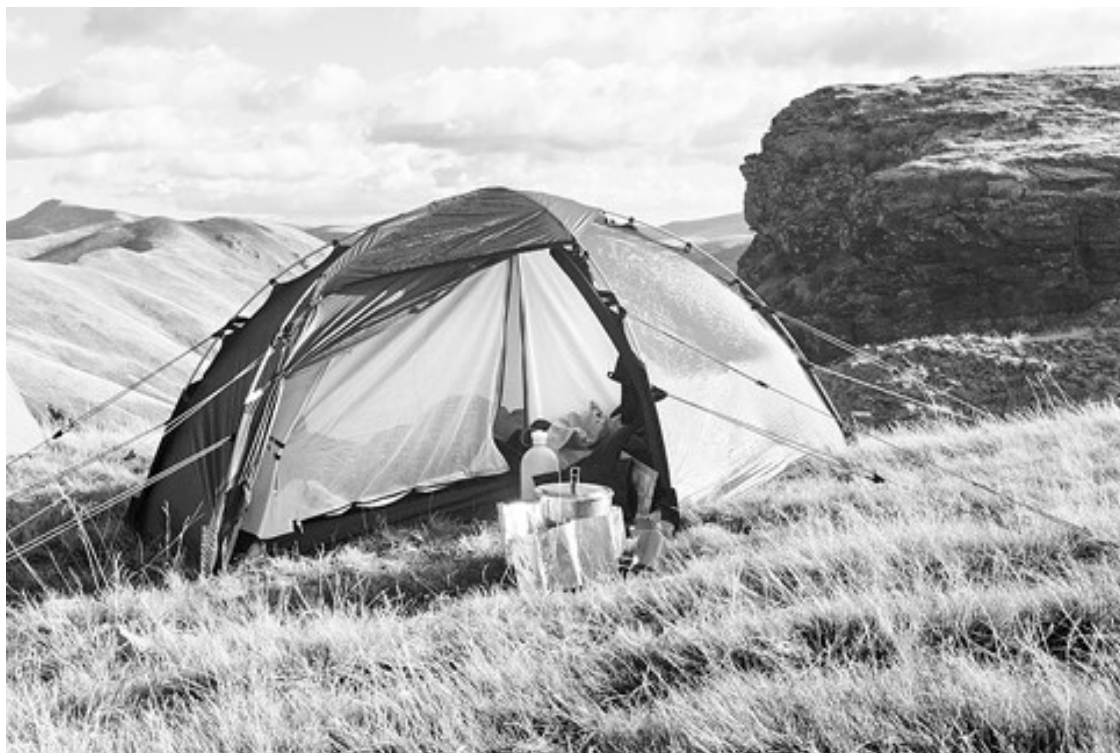
Медицина дикой природы

Вашей главной задачей будет эвакуация пациента в современное медицинское учреждение, даже если оно находится за сотни километров от места нахождения пациента. Как только вы передадите больного или пострадавшего в ближайшую медицинскую инстанцию, ваша ответственность перед ним закончится. Врачи скорой медицинской помощи и военные санитары определяют эту стратегию как «стабилизировать и транспортировать».