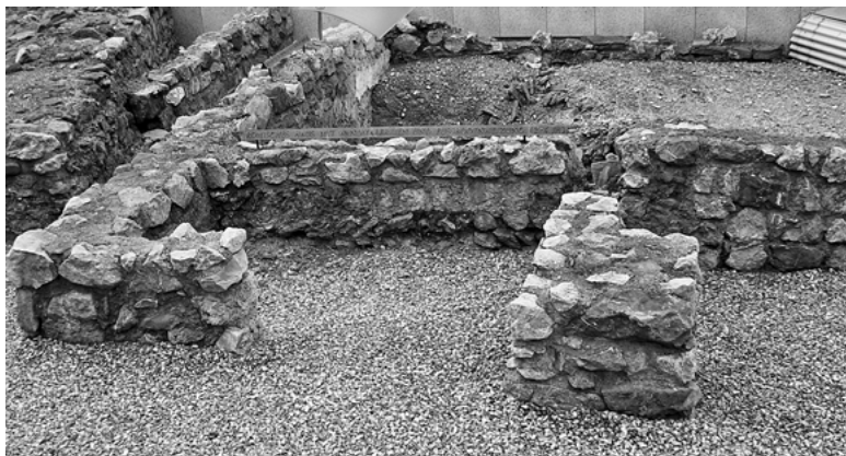
Римские руины Виндобона в Вене

В том месте, где сейчас находится Вена, город построили римляне, и он назывался Виндобона. Точнее говоря, примерно в 15 году после Рождества Христова кельтское поселение было завоевано легионом «Гемина» (Gemina) и превращено в форпост Римской империи, защищавший границы от нападений германских племен с севера. Изначально этот лагерь римлян назывался Виндобона. Это слово, кстати, сейчас можно встретить в названиях фирм, банков и различных учреждений Вены (Vindobona Prvat-Bank AG, Vindobona Betriebsführung GmbH, Vindobona-Apotheke и т. д.).