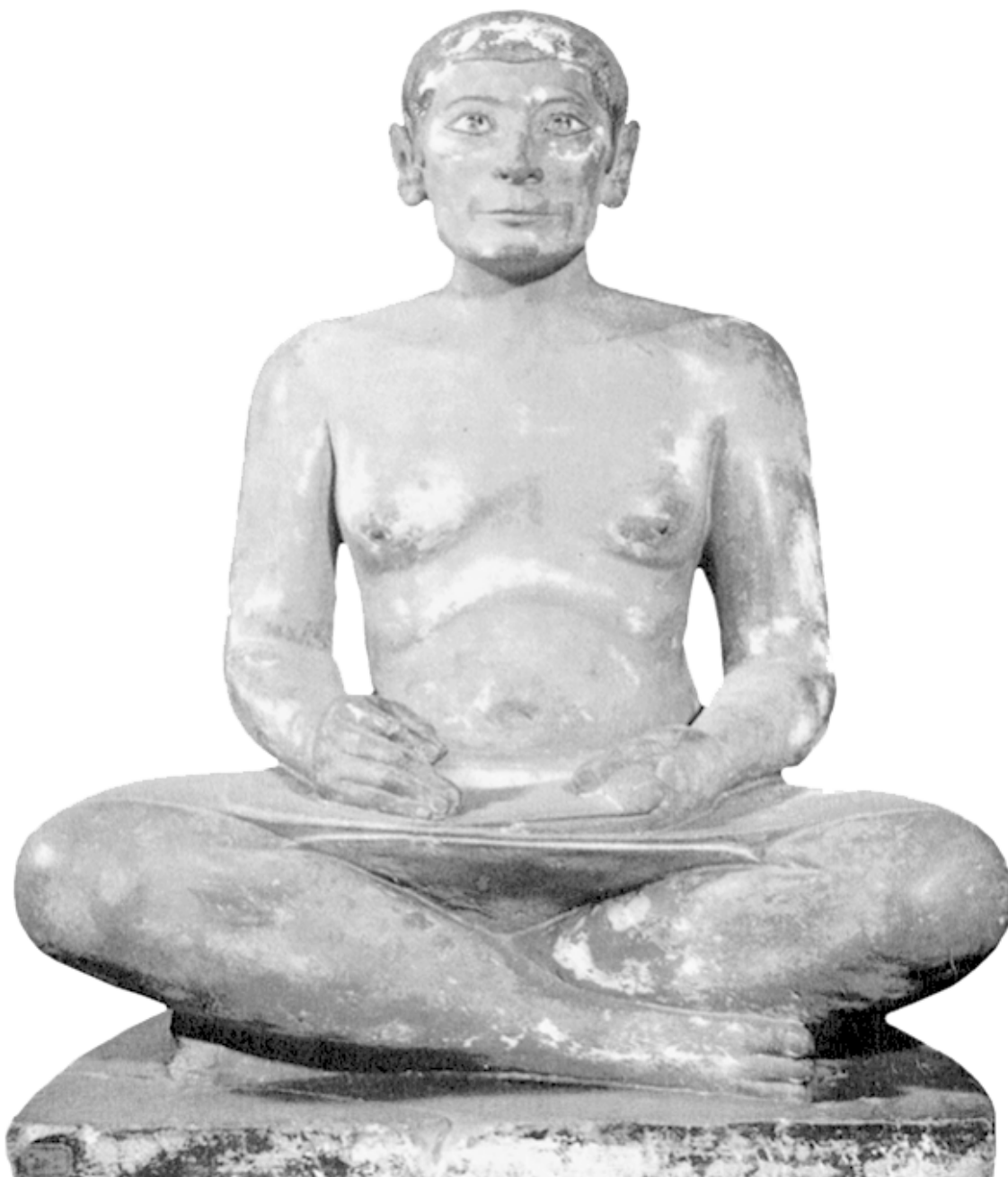
Царский писец Каи. Саккара. Скульптура. Середина III тысячелетия до н. э.

Поэтому создание специального бальзамирующего вещества явилось поистине победой египтян над тленом человеческим.