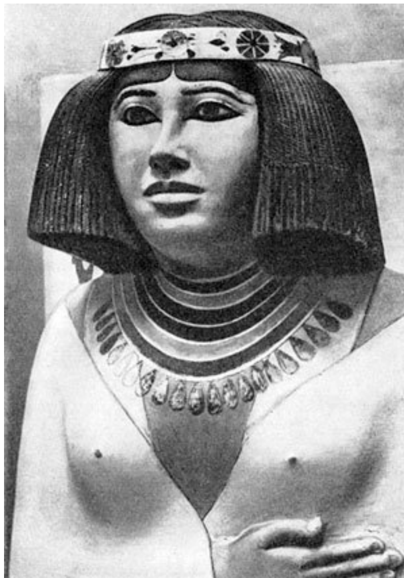
Скульптурный портрет царицы Нофрет. Фрагмент

Фрески на различных архитектурных памятниках рассказывают о буднях и праздниках египтян. Благодаря творчеству художников мы можем догадываться об образе жизни древних египтян и доподлинно узнавать о многих сторонах их деятельности. Тем более что этим изображениям доверять можно полностью, уже не раз археологи и исследователи убеждались, что древние художники были невероятно скрупулезны и все мельчайшие детали выписывали с потрясающей точностью. Так, всемирно известный путешественник Тур Хейердал, чтобы построить свой не менее известный папирусный корабль «Ра», внимательно изучал гравированные рисунки древних художников. Однако он не придавал значения разной толщине канатов в конструкции корабля, сочтя эту особенность несущественной. Позже ему и его товарищам пришлось поплатиться – в строительстве своего корабля они использовали слишком толстую веревку, которая уменьшила упругость всей конструкции, в результате сломались оба рулевых весла. Создавая уже «Ра-2», мореходы более доверительно относились к графическим изображениям и мастерству предков. Как выяснилось, каждая деталь рисунка, вплоть до мельчайшей черточки, имела свое особое значение.