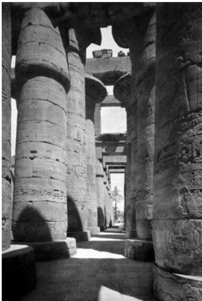
Круглые колонны храма Амона. Луксор. XV век до н. э.

Характерные для Верхнего Египта валики на порталах каменных храмов (ученые полагают, что это память о плетеных циновках, которые сворачивались валиком над входом в дом, храм или дворец) появляются и в архитектуре объединенного государства. А наклоненные внутрь наружные стены, которые также появляются в это время в гранитной форме, явно пришли из традиций Нижнего Египта. Именно там все монументальные сооружения вначале строились из необожженного кирпича, а наклонная форма для такого строительного материала была наиболее устойчивой, если к подножию строения подбиралась вода неожиданно высоко разлившегося Нила.