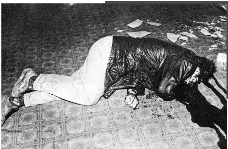
Петербург, 90-е, после стрелы