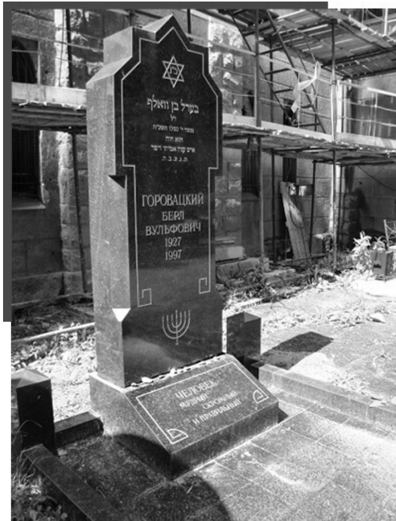
Петербург, Еврейское кладбище, могила Берла